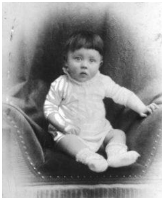
Adolf Hitler lapsuudenkuvassa