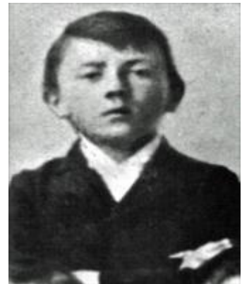
Adolf Hitler koulukuvassa