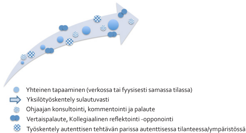
KUVIO 2. Autenttinen oppimisprosessi sulautuvan oppimisen viitekehyksessä

Artikkelissa kuvaamme opintojakson oppimaisema laadittiin Dillon ym. (2011) mallia mukaillen kuten alla olevassa kuviossa (KUVIO 2) on nähtävissä. Se kuvaa yhden opintojakson tasolla (mikrotaso) opiskelijan kasvuprosessia pedagogisesti taitavaksi, tutkivaksi opettajaksi kontekstuaalis-pedagogisessa viitekehyksessä.