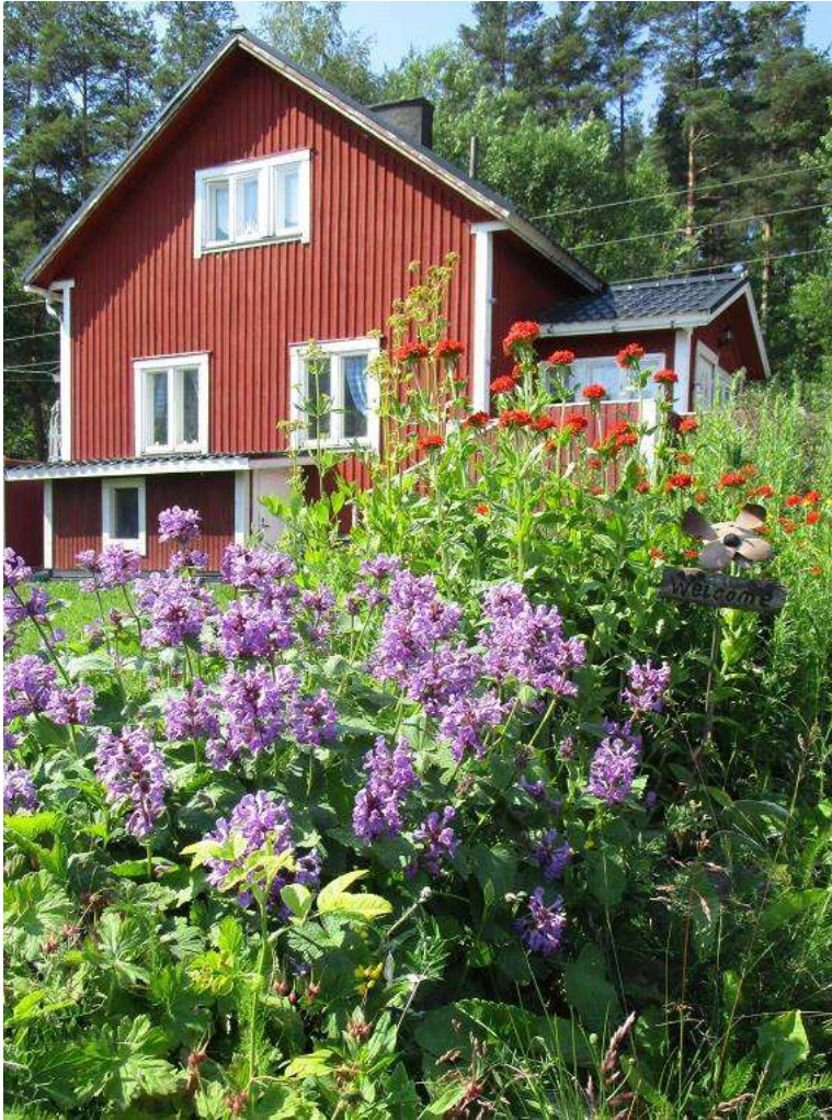
KUVA 1: Punainen tupa ja perunamaa. Suomalainen idylli asumisunelmana. Birgit Hiironen 8.7.2014.