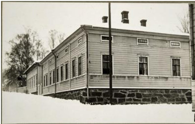
Kuva: Jyväskylän kuuromykkäinkoulu, Jyväskylä, Museovirasto, Historian kuvakokoelma

Nuorehkon rakennuskannan ohella koulut ja oppilaitokset määrittävät nyky-Jyväskylää. Kouluilla onkin ollut suuri rooli Jyväskylän kasvussa sekä kaupungin henkisen ilmapiirin muotoutumisessa. Moni teoksessa esitellyistä puretuista rakennuksista on ollut kouluja, tai ainakin niitä on käytetty opetustiloina jossakin vaiheessa rakennuksen elinkaarta. Usein koulujen kohdalla on käynyt siten, että ne ovat tarvinneet suuremmat ja modernimmat toimitilat. Näin oli esimerkiksi Vapaudenkadun varrella sijainneen rakennuksen tapauksessa, jonka viimeinen käyttäjä oli Kuuromykkäkoulu: oppilaitoksen tiloja kuvailtiin aikalaiskirjoituksissa synkeiksi, lohduttomiksi ja kylmiksi, ja vessassakin oppilaiden piti käydä läheisessä hotellissa tai sukulaisten luona (2017, 64).