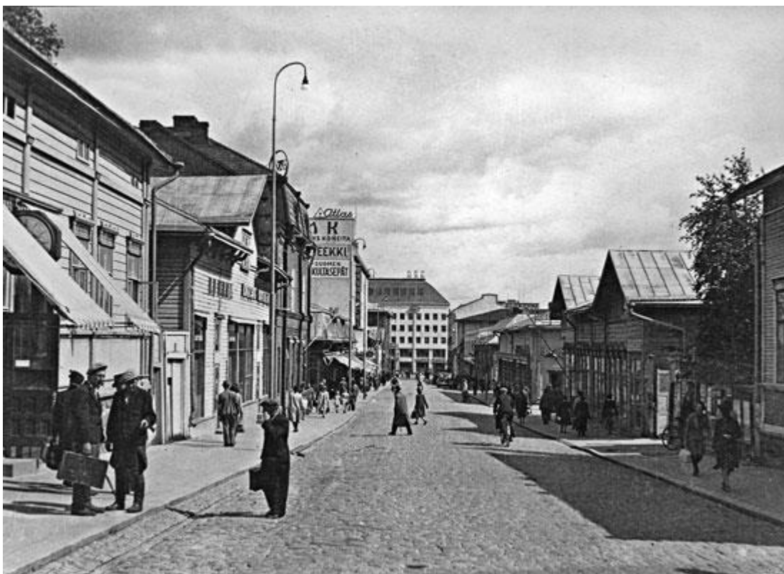
Kuva: Jyväskylää 1940-luvulla