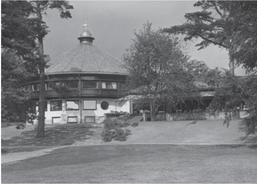
Valokuva 6. Takaisin alkuun.

Olen jälleen kulkenut aikaoven läpi ja tullut vehreään, lehtevään ja männyntuoksuiseseen ulkotilaan. Olen aikatasojen risteyskohdassa. Käsillä on niin ikään epookillisten, aikakausien ja käännekohtien, makujen hetki. Toivematka -teoksessa esitetyt pohdinnat iäisyydestä sopivat tämän kerrostuneen nykyisyyden tarkasteluun. Onko makujen aika siis kaikkien nykyhetkien summa vai pienistä ikuisuuden palasista rakentunut kokonaisuus? Pystytäänkö sodan päivien pahoja asioita jotenkin sovittamaan ja pyyhkimään pois? Entä voidaanko ajatella, ettei tätä aikakauden makuonnea kykene minulta kukaan riistämään? Onko Kalastajatorpan aika olemukseltaan koveraa vai kuperaa?