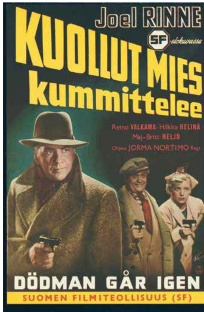
Valokuva 1. Elokuvan Kuollut mies kummittelee juliste.

elokuvan Kuollut mies kummittelee julistetta vasten. Kuulen entisyyden: yhtäkkiä olenkin Arkkitehti -lehden valokuvaajan kanssa upouuden Kalastajatorpan vieressä. Kuulen menneisyyden, jonka huminassa on mukana ääniä vuosilta 1939 ja 1940. Yksilönä oleminen on likimain kadonnut, ja sen tilalle on ilmestynyt jakamattomana kansana oleminen. Henkisen kulttuurin sekä elämänarjen laatua sävyttävät sitkeyden, sisukkuuden ja yhdessä tekemisen ihanteet. Toista ei jätetä pulaan. Jokaista apua tarvitsevaa autetaan. Krohnia mukaillen voisi ehkä puhua suomalaisesta kollektiivitajunnastakin. Yksilöä on siis mahdollista pitää yhteisön perillisenä. Eli hän ei pystyisi olemaan yksilö ilman yhteisöä.