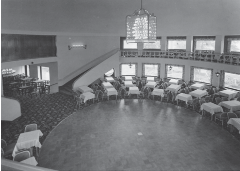
Valokuva 4. Elämän kehien aika.

kiekkoon sisältyy myös Kalastajatorpan elokuva-aika tai elokuvallinen aika. Se aika ei lainkaan katoa, vaan se on mukana kaikkien nykyisten ja tulevienkin tanssijaikäpolvien askelten keveydessä.