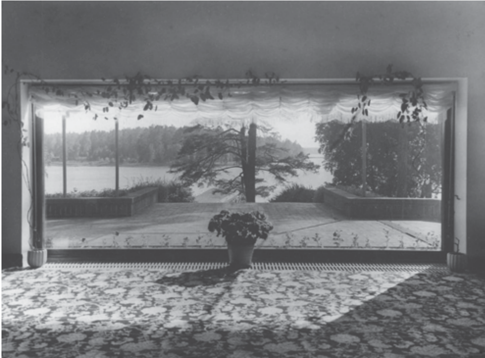
Valokuva 3. Taideikkuna.