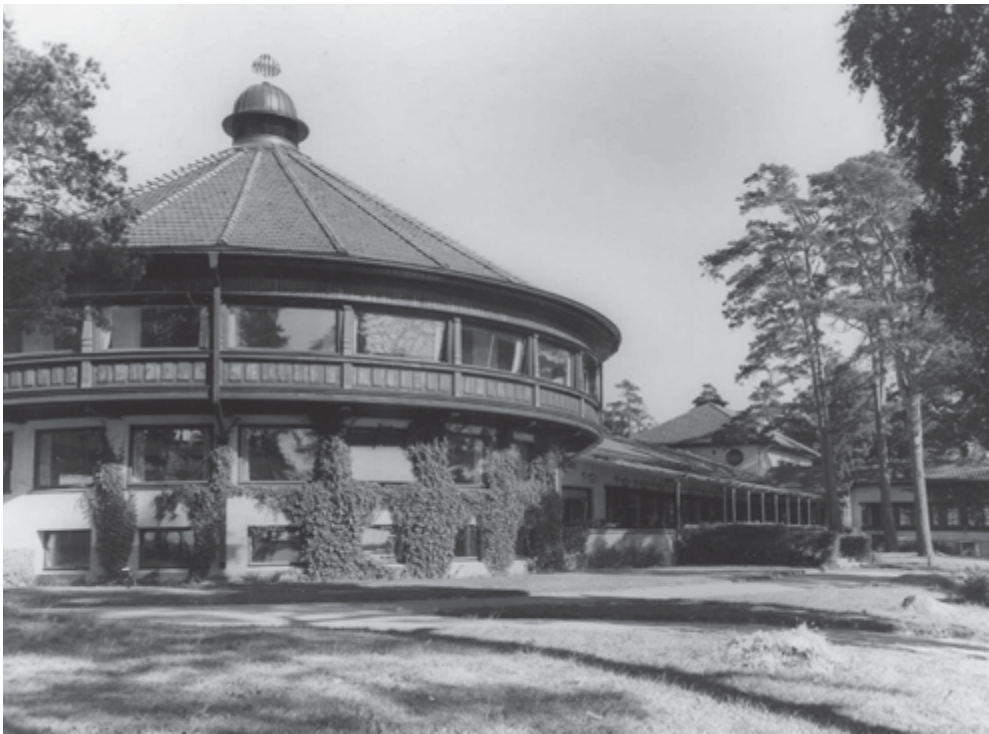
Valokuva 2. Kalastajatorppa kesällä kerran.

Tämä vuoden 1952 elokuvajuliste on myös aikaovi tai aikaportti, jonka kautta voidaan siirtyillä nykyisyydestä toiseen. Entisyysshumu olikin saanut minut sulkemaan silmäni ja mielikuvissani harppaamaan yli vuosikymmenen takaiseen nykyhetkeen. Minun olisi silti vielä aivan konkreettisestikin päästävä kuulemani olemispauhun osaksi. Silloin kykenisin niin ikään olemaan sekä elokuvan takana että keskellä elokuvan tapahtumavirtaa. Se onnistuu ainoastaan menemällä sisään Kalastajatorppaan. Astun tummaa vihreää hehkuvan julisteoven läpi ja saavun suviseen ja tuoksuja tulvillaan olevaan maisemaan. Etuoikeallani on kaunis ja muotokieleltään runsas ravintolarakennus.