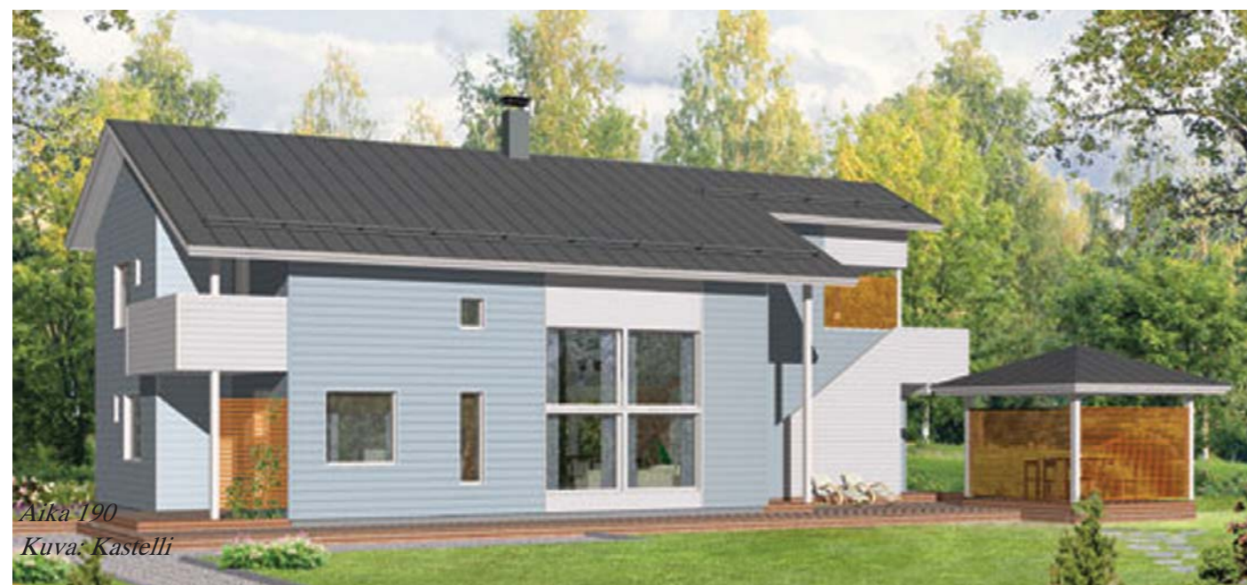
Aika 190

Pulkkinen suunnittelemat ratkaisut ovat askel käytännöllisyyttä ja asiakaslähtöisyyttä päin. Tavoitteena on, että koti muuttuu ajassa, perheen tarpeiden mukaan. Tilaratkaisuissa on huomioitu talon helppo muunneltavuus sekä perheiden erilaiset tarpeet. Esimerkiksi lasten kasvaessa pienen lapsen huone on helposti muunneltavissa muuhun käyttöön. Tiloja pystytään myös helposti yhdistämään ja jakamaan uu-