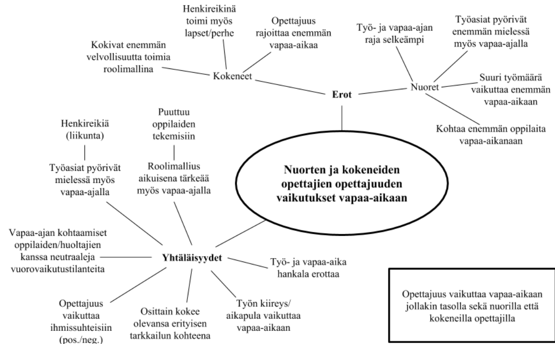
Kuvio 2 Yhteenvedo nuorten ja kokeneiden opettajien opettajuuden vaikutuksista vapaa-aikaan

opettajien kohdalla useassa eri haastattelun vaiheessa, ja näin ollen se vaikutti olennaisesti kokeneiden opettajien vapaa-aikaan. Kuviossa 2 on tiivistetysti nuorten ja kokeneiden opettajien väliset yhtäläisyydet ja erot.