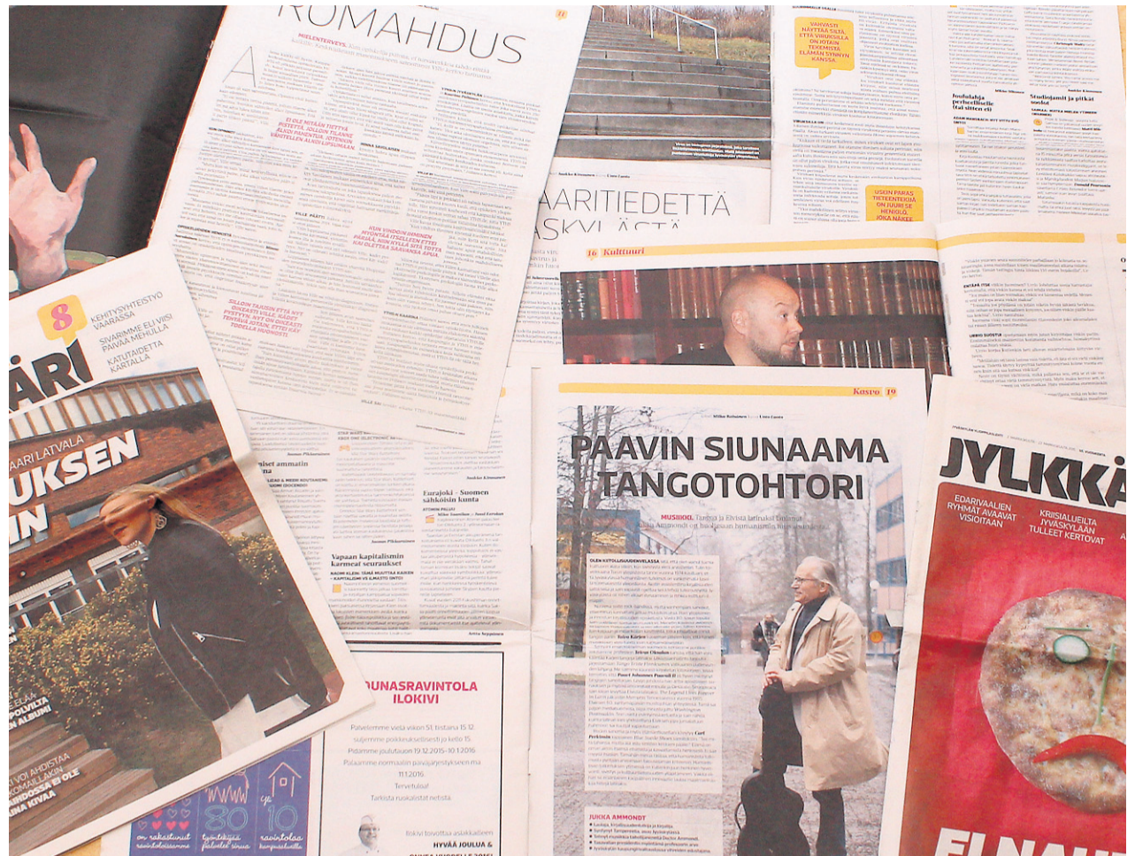
Nykyisin kolmen viikon välein ilmestyvää Jylkkäriä on julkaistu vuodesta 1960 lähtien.

teksti Jaakko Kinnunen