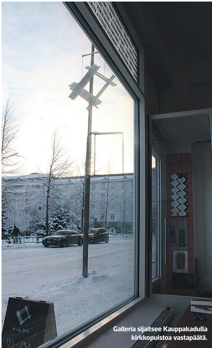
Galleria sijaitsee Kauppakadulla kirkkopuistoa vastapäätä.

tiuhaan, mutta kävijät paljastuvat pääosin taideihmisiksi, joiden tavoite on vierailla vuoden jokaisessa näyttelyssä.