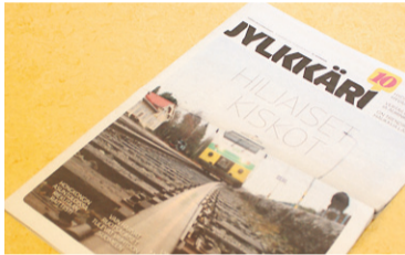
Jylkkärin matkakertomus Seinäjoen reitiltä julkaistiin lehdessä 10/2015.