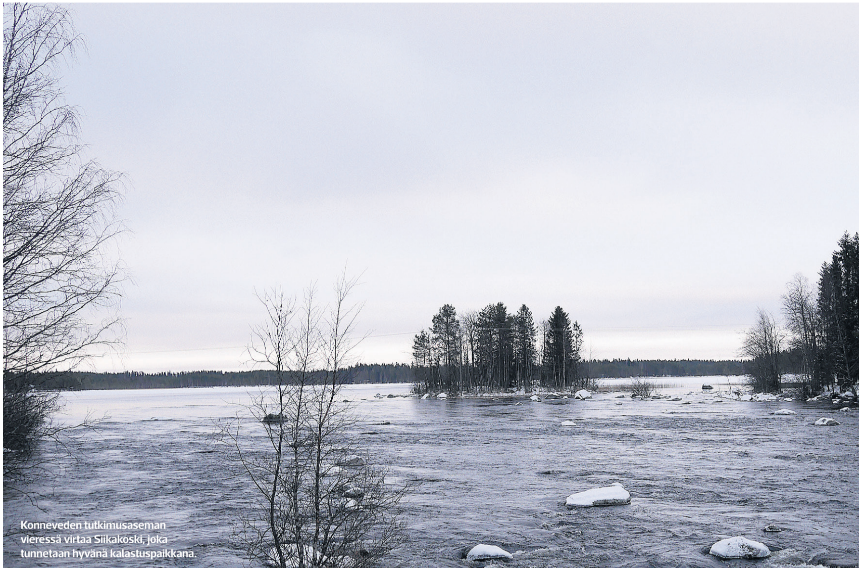
Konneveden tutkimusaseman vieressä virtaa Siikakoski, joka tunnetaan hyvänä kalastuspaikkana.