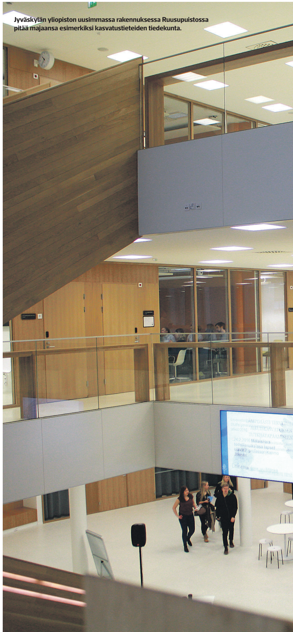
Jyväskylän yliopiston uusimmassa rakennuksessa Ruusupuistossa pitää majaansa esimerkiksi kasvatustieteiden tiedekunta.

suuremman koon etua resurssien hallinnassa. Näin meille ei jää liian pieniä tulosyksiköitä. Muutosten ei pitäisi millään lailla heikentää opiskelijoiden mahdollisuuksia korkealaatuiseen opiskeluun.”