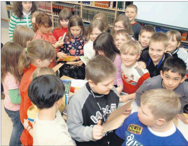
Vinkkaustuokion päätyttyä esillä olleista kirjoista lähes tapeltiin.

— Paljon vinkkaan kotimaisia kirjoja, ehkä siksi, että