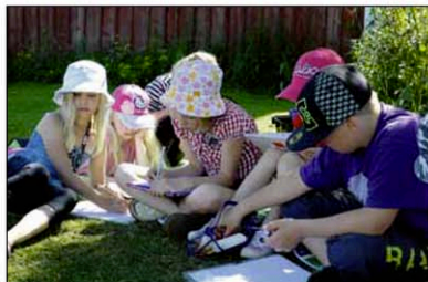
Sanataidebussin kiertueen aikana lapset kirjoittivat lukuisia tarinoita.

ohjata käsinukkenäytelmää tekevää ryhmää. Nuorimille toinen ohjaajista luki satuja ja loruja.