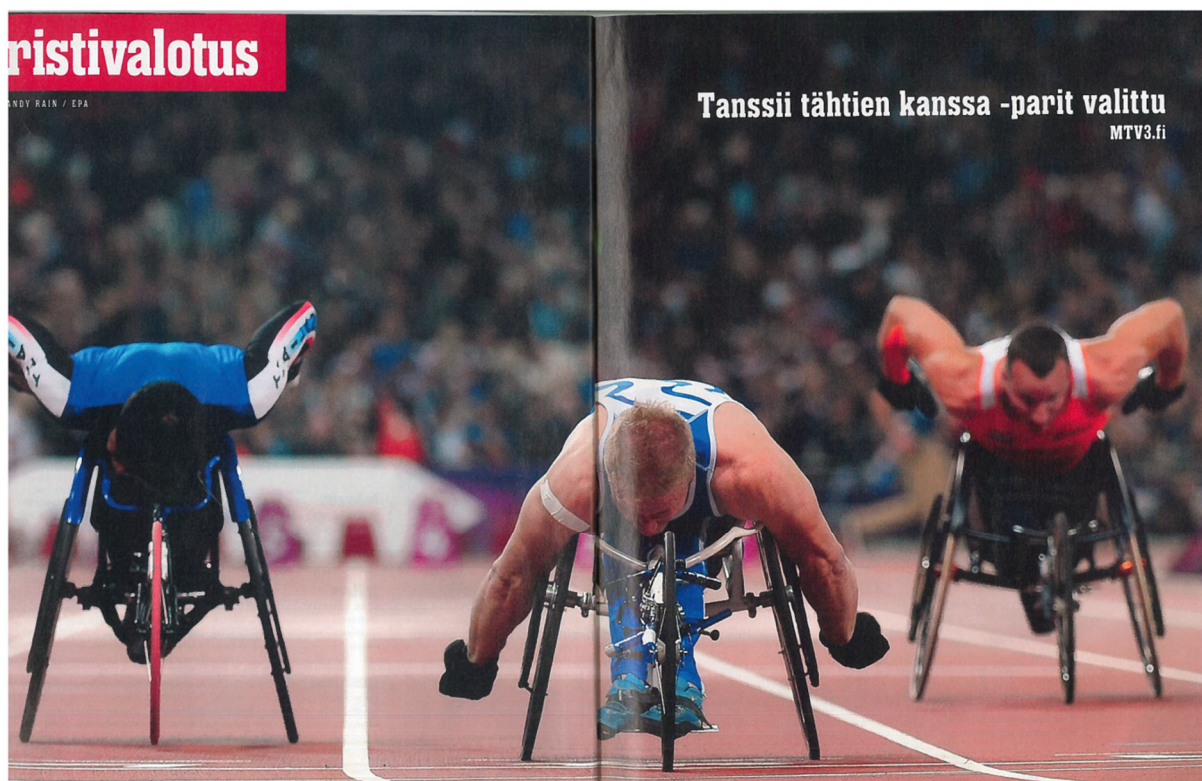
Kuva 6. Urheilulehti 36/2012