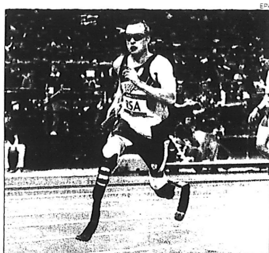
Oscar Pistorius on maailman tunnetuin vammaisurheilija.