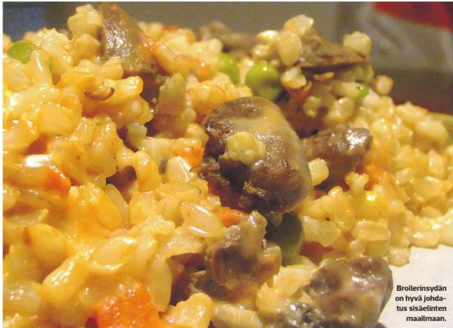
Broilerin sydän on hyvä johdatus sisäelinten maailmaan.

Jyväskylässä Harjun Lempiruokaa Tallinnasta –liike myy sydämiä kivipiirrojen ja broilerinmaksan ohella. Hintaa pumpuilla on 2€/400g. Kokeileminen ei siis kalliiksi tule.