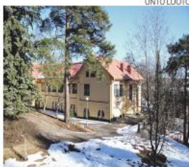
Myös sammakkohuvilana tunnettu Villa Rana.