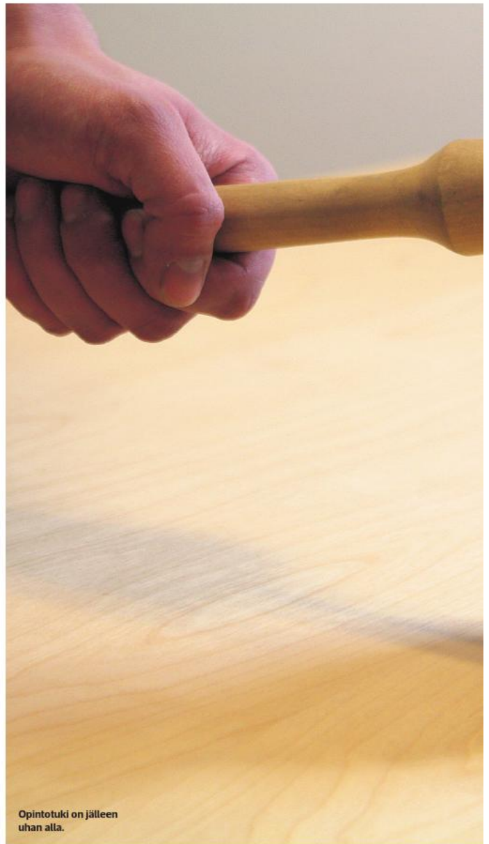
Opintotuki on jälleen uhan alla.

KÄYTÄNNÖSSÄHÄN OPINTOTUKI ON JO NYT RIITTÄMÄTÖN OPISKELIJAN PERUSTOIMEENTULON TURVAAMISEEN.