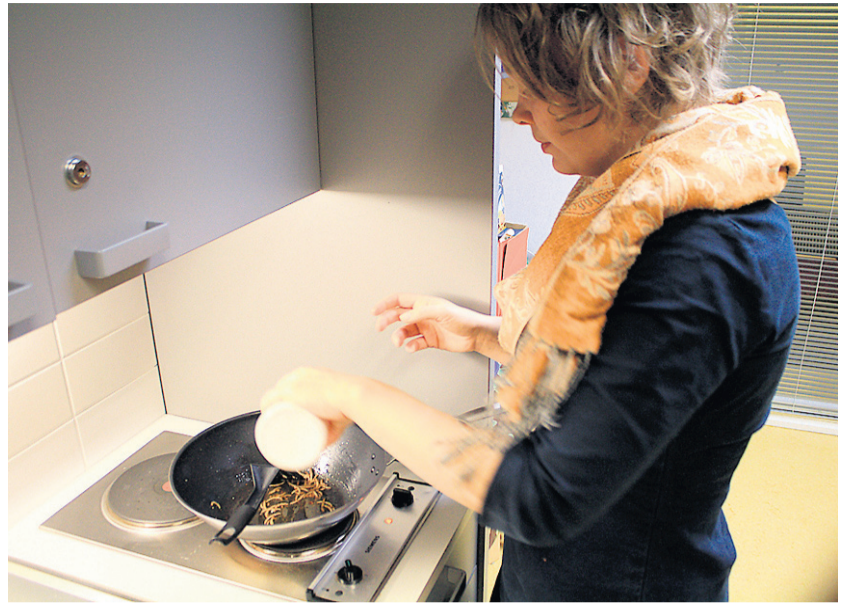
Because the lightweight maggots bounce off easily from the sizzling frying pan, a lid is recommended for cooking.

text Arimo Kerkelä translation Minna Tiainen