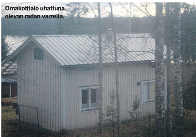
Omakotitalo uhattuna olevan radan varrella.

Höyryvetureiden ja rautateiden kehdoiksi kutsutulta Haapamäeltä uhkaavat junat kadota.