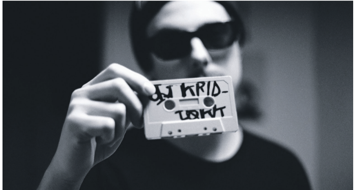
DJ Kridlokk on yksi Rentukan Ghetto Party Festivaalissa esiintyvistä kotimaisista underground-nimistä.