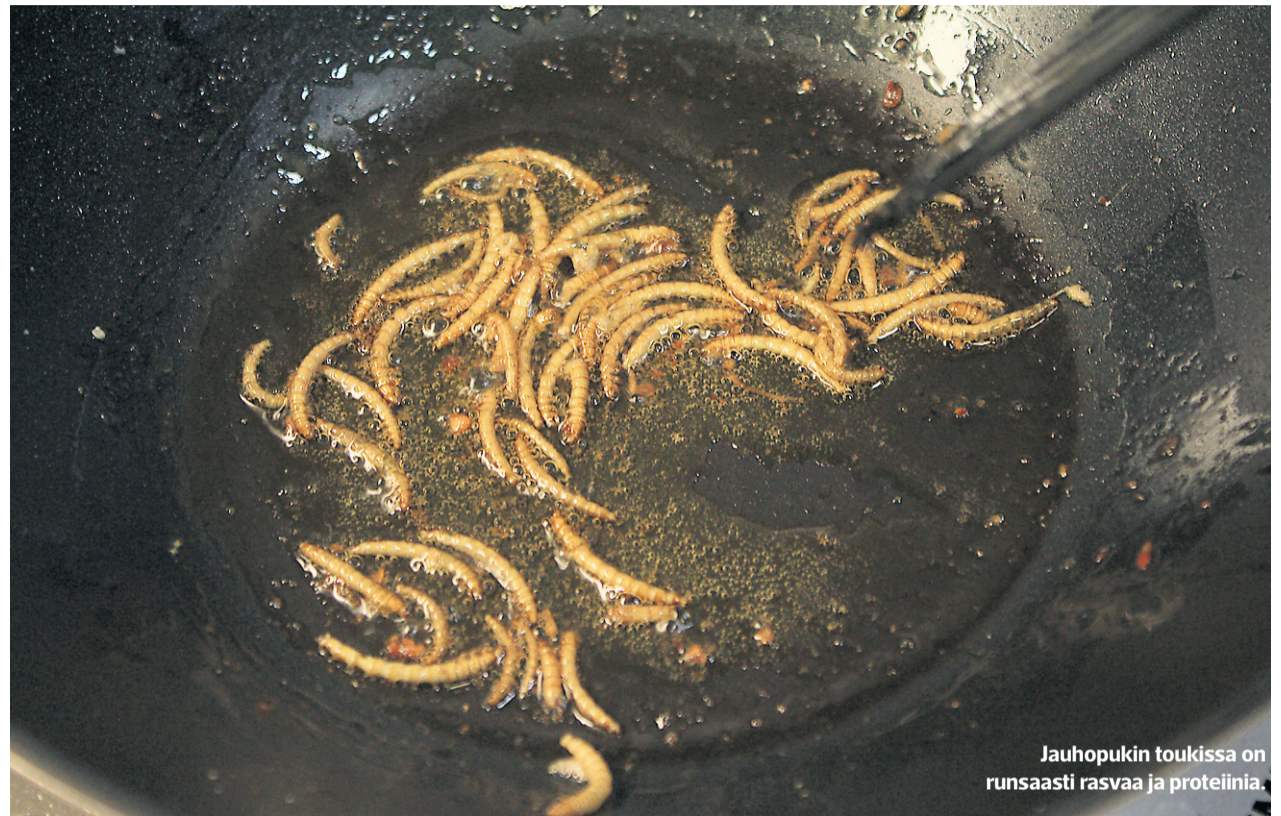
Jauhopukin toukissa on runsaasti rasvaa ja proteiinia.

Puolitaival kertoo, että EU on purkamassa lainsäädäntöä, joka rajoittaa