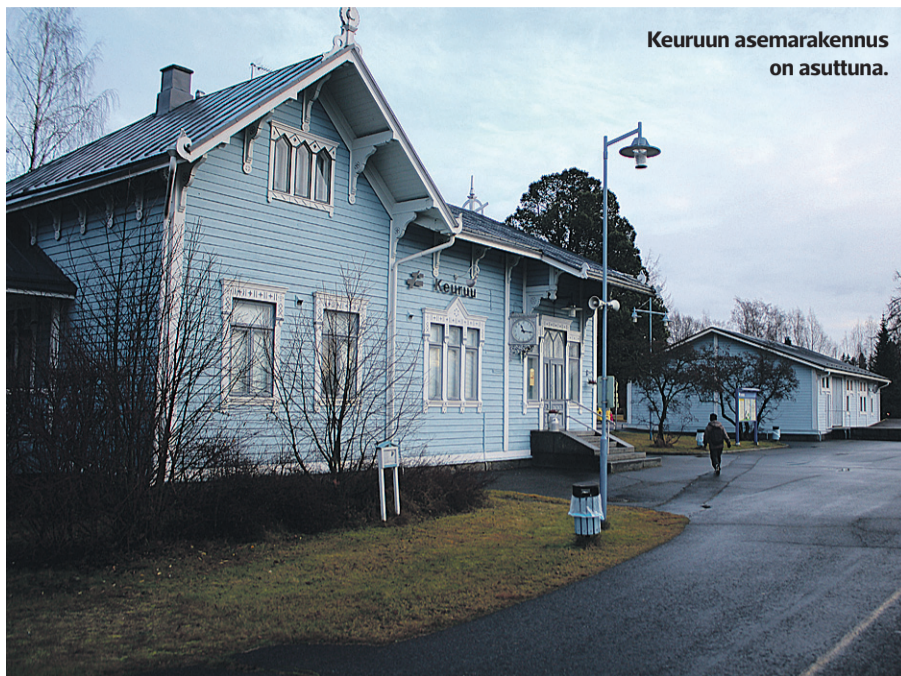
Keuruun asemarakennus on asuttuna.