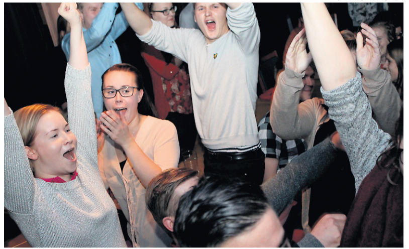
Pörssi&Dumppi tuuletti voittoaan vaalivalvojisissa Rentukassa 4. marraskuuta.

Kaikki kolme haastateltavaa vakuuttavat, että yhteistyö ruotsalaisten yliopistojen kanssa jatkuu, vaikka kansainvälisten kasvattien kiinnostus Suomea kohtaan pysyisi vähäisenä.