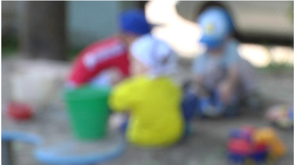
Lapset leikkivät anonymissä kuvassa päiväkodin pihalla. Koska kyseessä ovat nimenomaan lapset, on heidät haluttu kuvata tunnistamattomasti.