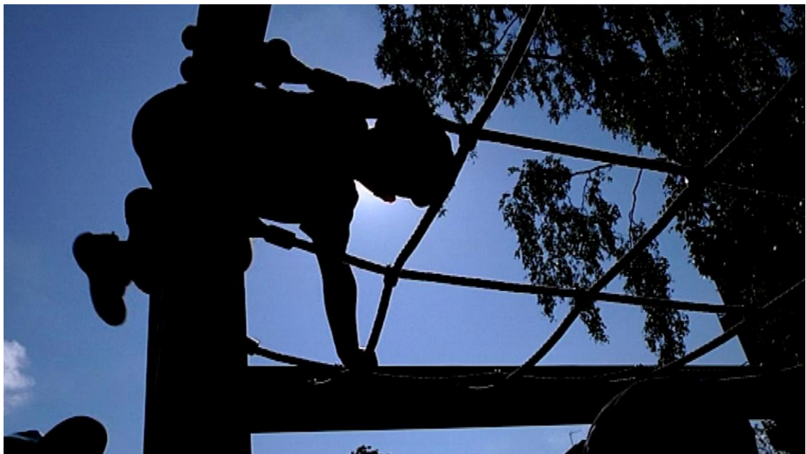
Lapset leikkivät päiväkodin pihalla, osa 2. Kuvaa on käsitelty siten, että vastavaloon kuvattu lapsi on mustattu täysin. Näin kuvassa olevan henkilön kasvoja ei voi edes kuvankäsittelyllä saada esiin.