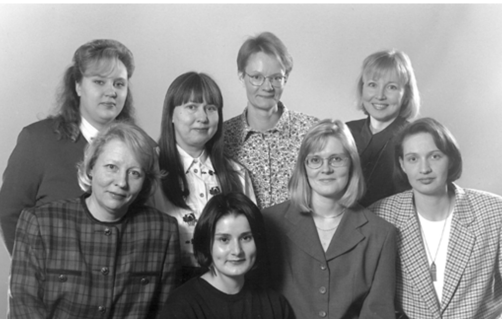
Avoimen yliopiston henkilökuntaa vuonna 1996...