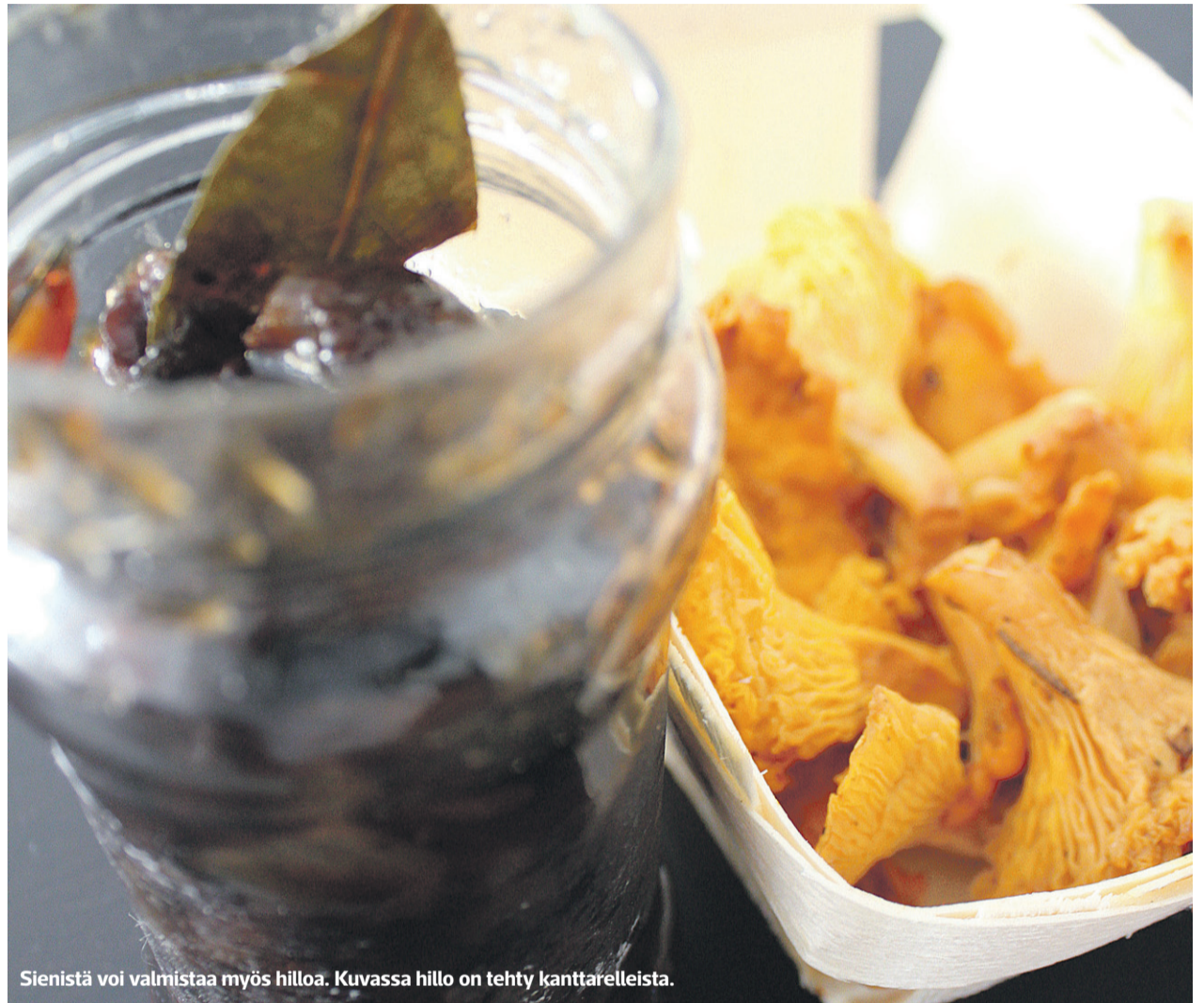
Sienistä voi valmistaa myös hilloa. Kuvassa hillo on tehty kanttarelleista.

SIENISTÄ ON ruokana todellakin moneksi. Niitä voi käyttää pizzoihin ja piirakoihin ja niistä voi tehdä risottoa tai vaikkapa sienipihvejä. Oma suosikkini on lapsuudesta tuttu kanttarelli-pekonikastike. Kermainen kastike on helppo valmistaa. Paista puhdistetut kanttarellit, kunnes neste on haihtunut. Nosta sienet odottamaan ja paista kuutioitu pekoni. Lisää pannulle kanttarellit, sipulia, voita ja mausteita. Lisää muutama ruokalusikallinen vehnäjuuhoja. Sekoita ja lisää purkillinen ruokakermaa sekä kaksi desiä vettä. Kymmenisen minuuttia hauduttamista ja kastike on valmis. Tarjoile keitettyjen pe-