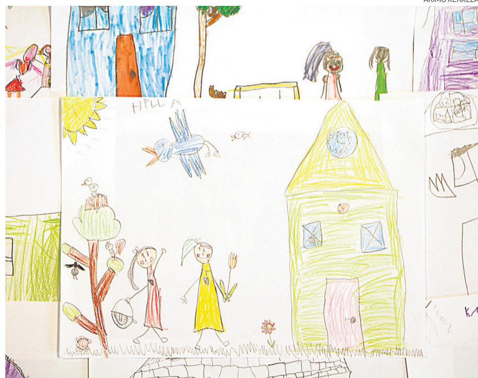
text Elisa Auvinen translation Minna Tiainen drawings Children of Kortesus Kindergarten

MINULLA EI OLE MITÄÄN SUOMALAIKIA VASTAAN, KUNHAN HE ÄLYVÄT JÄÄDÄ SYNTYMÄTTÄ.