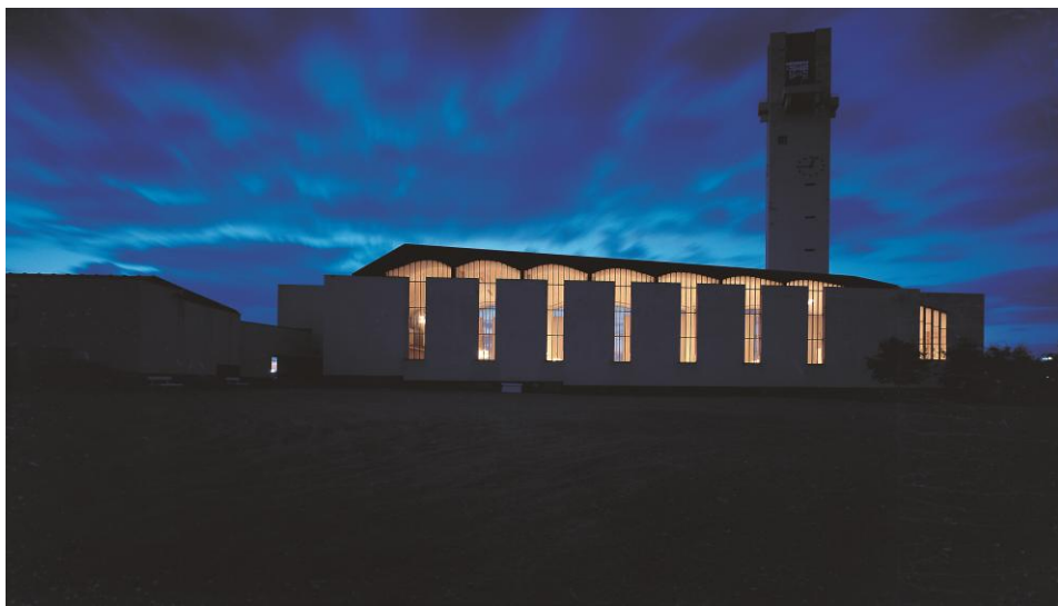
Kuva 9. Lakeuden Ristin kirkko sisältäpäin valaistuna.

Säätiloilla sekä vuoden- ja vuorokauden ajoilla on tunnelman kokemisessa suuri merkitys, kun tarkastellaan paikkoja ulkoapäin. On aivan eri asia katsoa esimerkiksi kaupungintalon sinistä sauvapintaa vesi- tai räntäsateessa kuin hohtavassa auringonpaisteessa. Vuorokauden aikoihin liittyen esimerkkinä voidaan mainita Lakeuden Risti, jonka ikkunoiden sanotaan näyttävän pimeällä sisältäpäin valaistuina jättiläismäisiltä kynttilöiltä. Tunnelma on tuolloin aivan erilainen kuin valoisaan aikaan. Säätila vaikuttaa yleisesti ihmisten tunnelmaan ja mielialaan. Kaatosade opastuskierroksen aikana voi pilata ihmisten mielialan, mikä puolestaan vaikuttaa yleisesti koko tilanteen tunnelmaan. Tunnelmaan vaikuttaa myös ympärillä tapahtuva toiminta ja ympäristön äänimaailma.