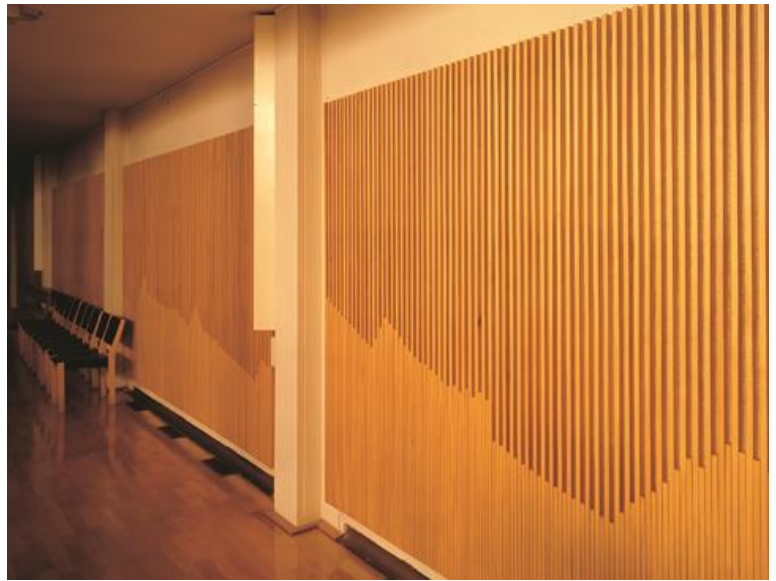
Kuvat 3. ja 4. Alvar Aallon suunnittelema ovenkahva ja puinen sisäseinä Lakeuden Ristin seurakuntakeskuksessa.