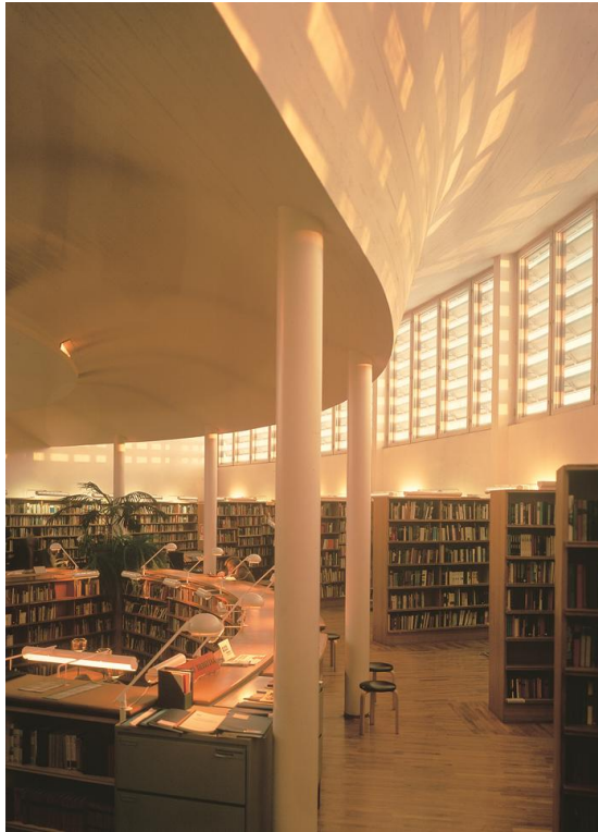
Kuvat 12. Luonnonvalo siivilöityy kauniisti säleikköjen lävitse Aallon kirjaston lukusaliin.