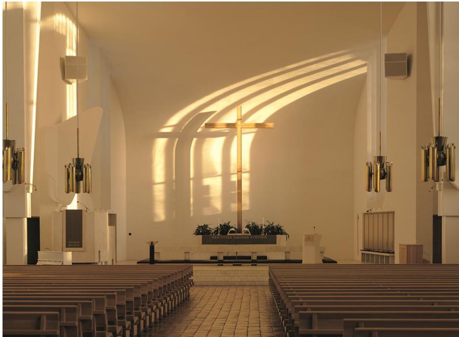
Kuva 2. Valon ja varjon leikkiä Lakeuden Ristin kirkkosalissa.

Lakeuden Ristin kirkko on hyvä esimerkki tilasta, jossa on mahdollisuus nähdä erilaisia valon ja varjon leikkejä säätilasta ja vuorokaudenajasta riippuen.