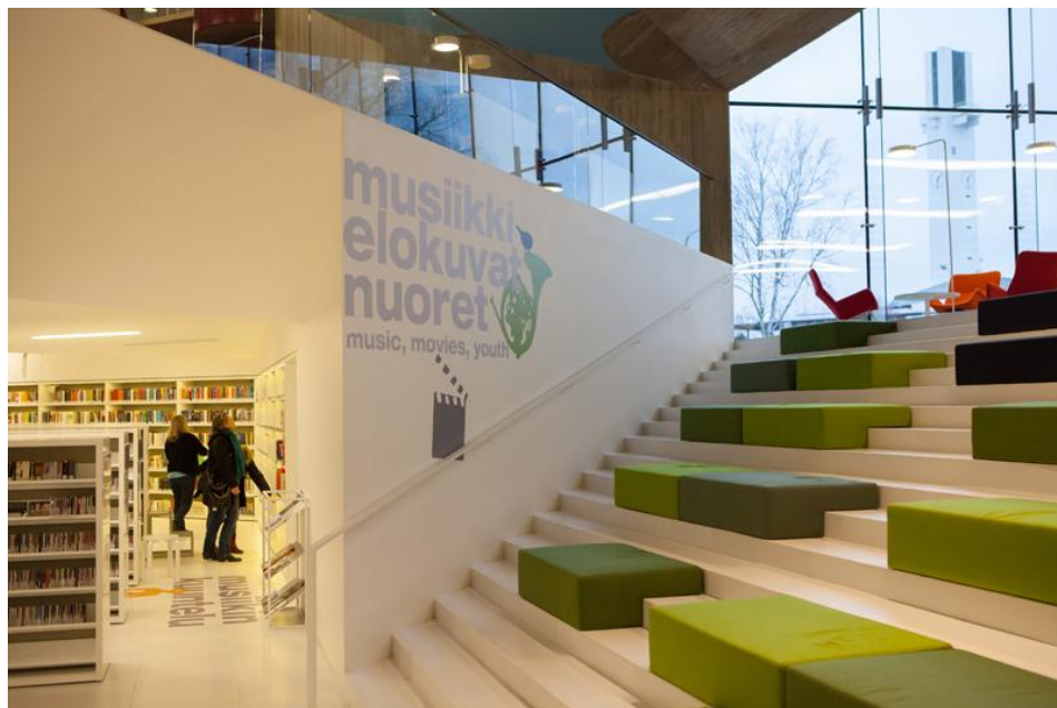
Kuva 8. Apila-kirjastoon tuo luonnonvaloa iso ikkunaseinä ja samalla se yhdistää sisä- ja ulkotilan yhdeksi kokonaisuudeksi.