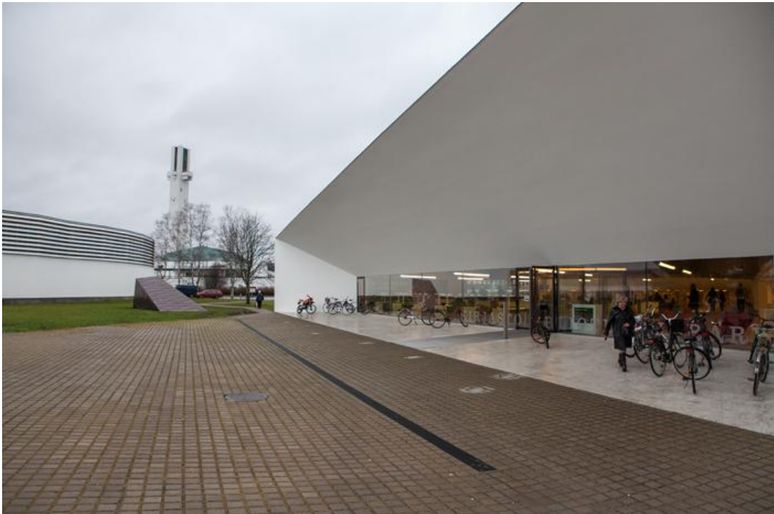
Kuva 7. Seinäjoen Apila-kirjasto sijoittuu hienosti Aalto-keskuksen ympäristöön. Taustalla näkyy Aallon-kirjasto ja Lakeuden Ristin kirkon kellotorni.