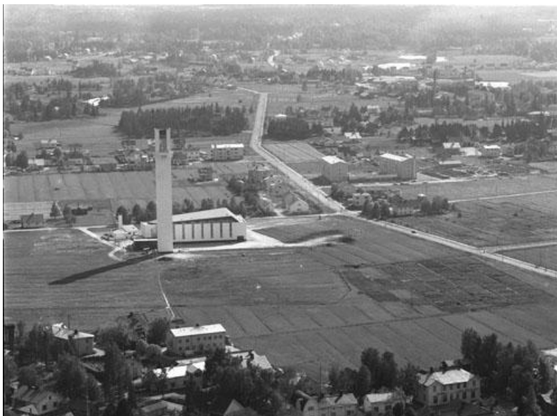
Kuva 11. Ilmakuva Aalto-keskuksen alueesta 1960-luvun alussa. Kuvassa näkyy maisemaan ensimmäisenä noussut Lakeuden Ristin kirkko.

N2: – – tuli mieleen, että kun sinne torniin kiivetään ja katsotaan tämän päivän näkymää. Sehän on aivan toinen, kun vertaa siihen, kun Lakeuden Ristiä rakennettiin. Sehän oli pelkkää peltoa. Historian kulku ja siihen mukaan, muun muassa vanhat valokuvat. Sitä kautta voisi katsoa, että silloin oli näin ja nyt on tämän näköistä ja miten se on rakentunut koko Aalto-keskus.