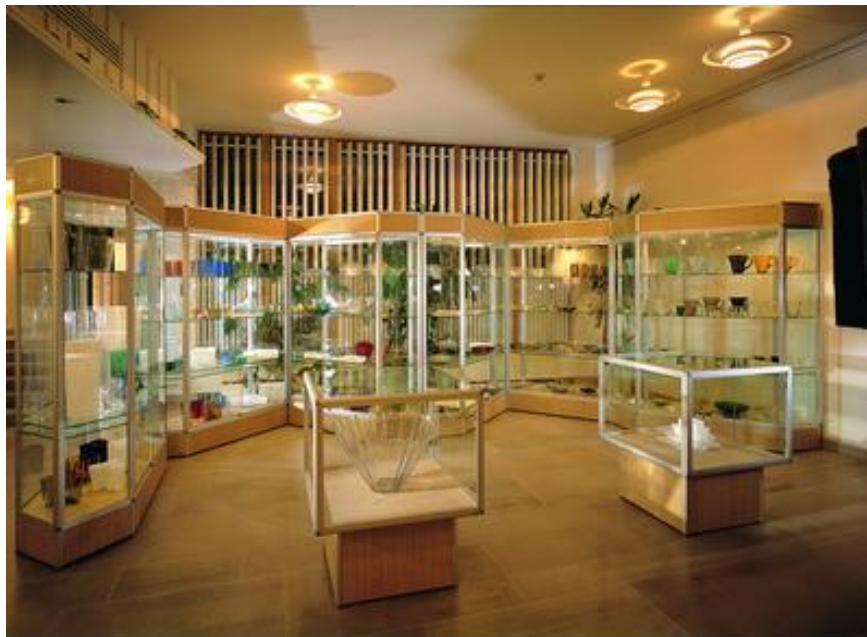
Kuva 10. Alvar Aallon lasikokoelma on sijoitettu kaupunginteatterin yläaulaan.