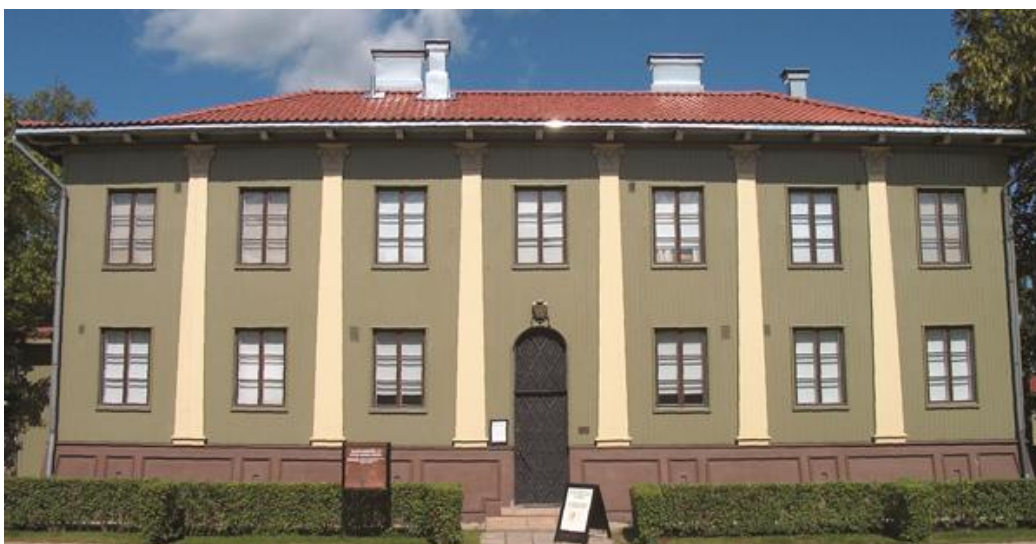
Kuva 5. Alvar Aallon suunnittelema Suojeluskuntatalo Seinäjoella.