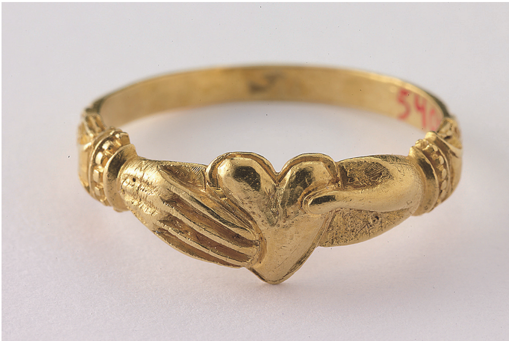
KUVA 8 Uskollisuussormus. 1500-l. loppu tai 1600-l. alku. Raisio