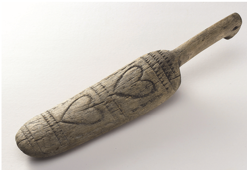
KUVA 6 Pesukarttu. 1600-luvun loppu. Kurikka.