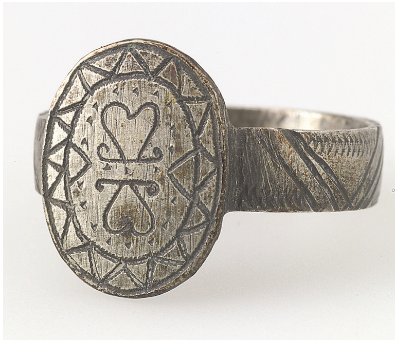
KUVA 5 Kantasormus. Jaakkima.