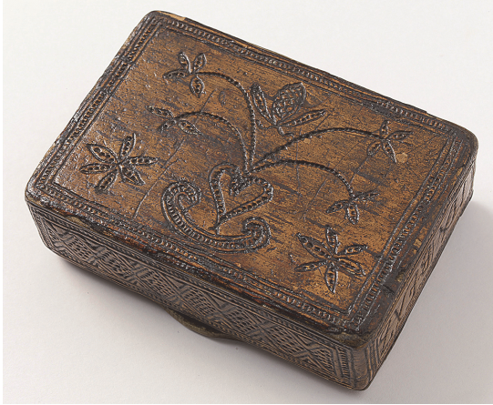
KUVA 2 Sormusrasia. 1854. Asikkala