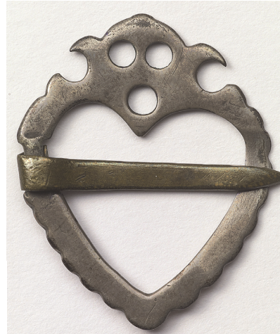
KUVA 3 Rintasolki. Jaakkima.