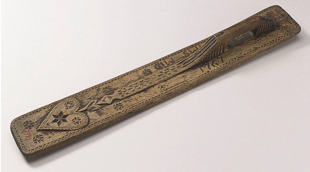
KUVA 7 Kaulauslauta. 1767. Ylistaro.