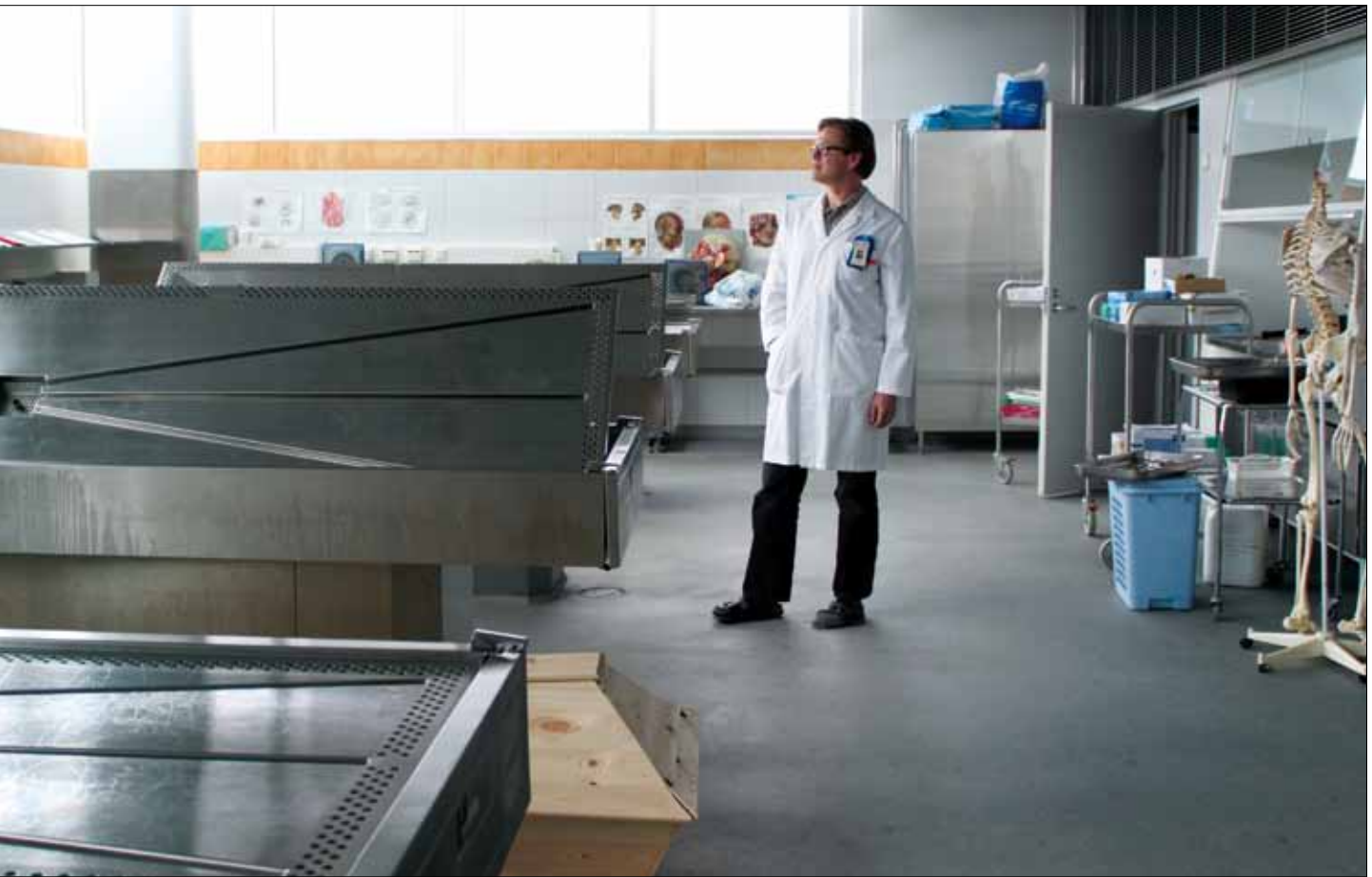
aan kalloa ja keskushermostoa.

hipiirilleen niin kauan, että hän tunsu olevansa valmis jatkamaan eteenpäin.