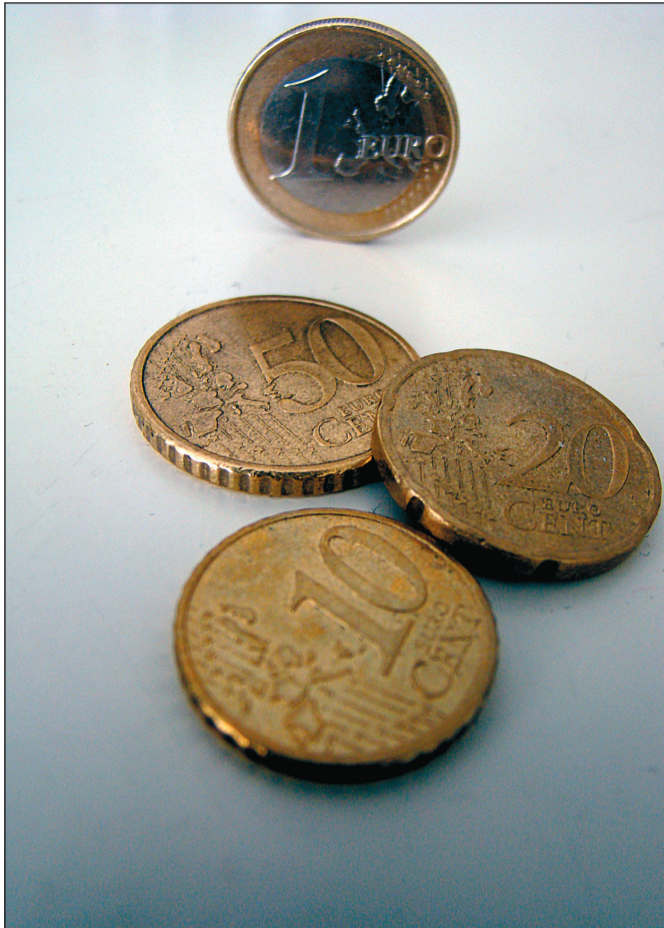
Opiskelijan euro on tällä hetkellä kahdeksankymmentä senttiä.

Opintotuesta jää siis vuokran jälkeen käteen al-