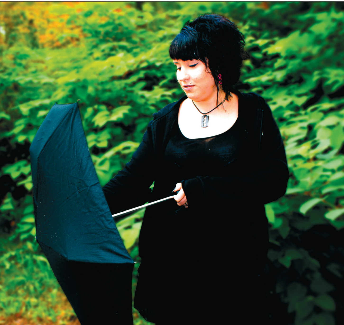
masennukseensa. Takana on yhdeksän vuoden mittainen masennusjakso ylä- ja alamäkiin.