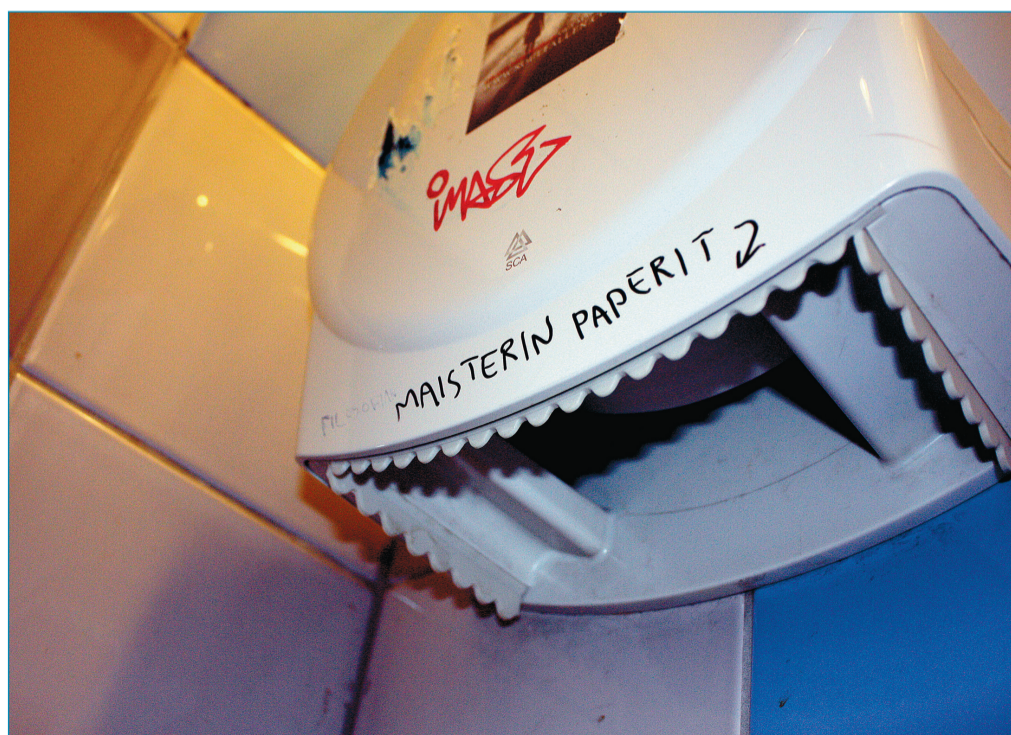
Vessoissa kukkii yliopistohuumori.