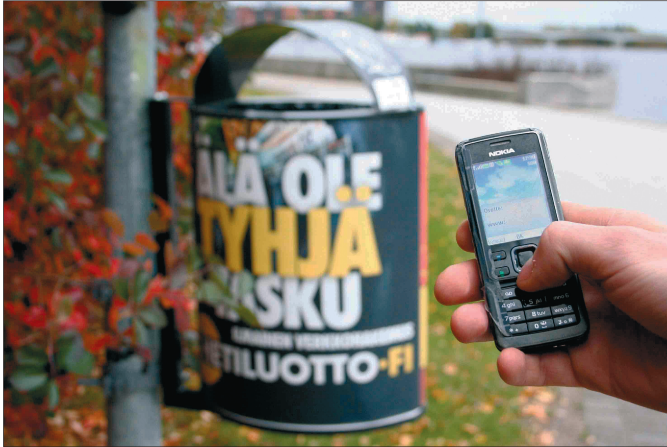
Pikavippejä markkinoidaan usein aggressiivisilla mainoslauseilla.

– Yrityksissä vaihdetaan hallituksen jäseniä sen mukaan, kuka täyttää rekisteröinnin edellytykset. Esimerkiksi jos yrittäjiltä puuttuu laissa vaadittu luottotoiminnan tuntemus, he värväävät hallitukseen kauppatieteiden maisterin, jotta ehto täyttyy, Karsimus kertoo.