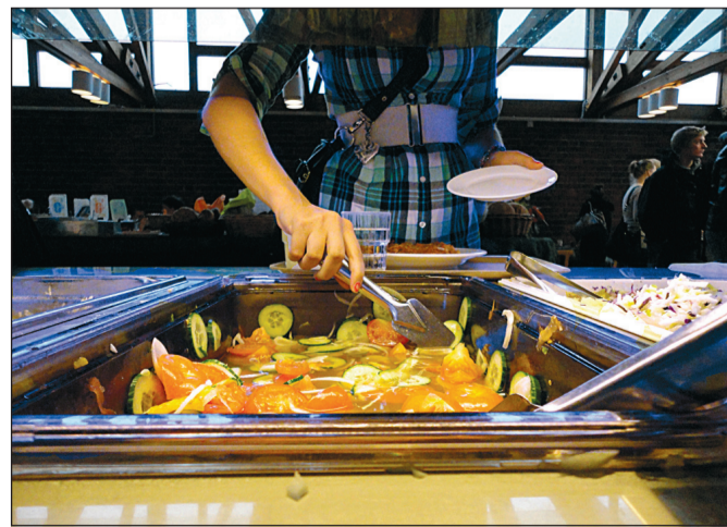
Sonaatin Lozzi-ravintolassa ruoka maksaa 2,50 euroa. Hinta on ollut sama viimeiset kolme vuotta.

– Hintataso on pysynyt samana viimeiset kolme vuotta, vaikka palkat ja raaka-aineiden hinnat ovat nousseet. Haluamme kuitenkin tarjota sekä opiskelijoille että henkilökunnalle heidän tarpei-