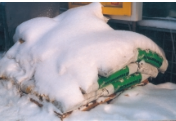
Sesonkituotteen myyntikausi on ohi.

Seuraavat kaksi tankkauspistettä ovat kylmäasemia. Molemmat ovat