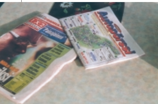
Huoltoasemien vakioasiakkaiden joukkoon soveltuakseni valitsin mukaan epätavallista luettavaa.

Erillistä tupakkaosastoa ei ole, vaan pöytiin on siroteltu satunnaisesti savuttelun kieltäviä merkkejä. Yhdessä savuttomassa pöydässä vanha mies jyräsi sytyttämätöntä sätkää muistellessaan vastapäätä istuvalle, sähköyhtiön haalariin pukeutuneelle nuoremmalle miehelle menneitä. Mo-