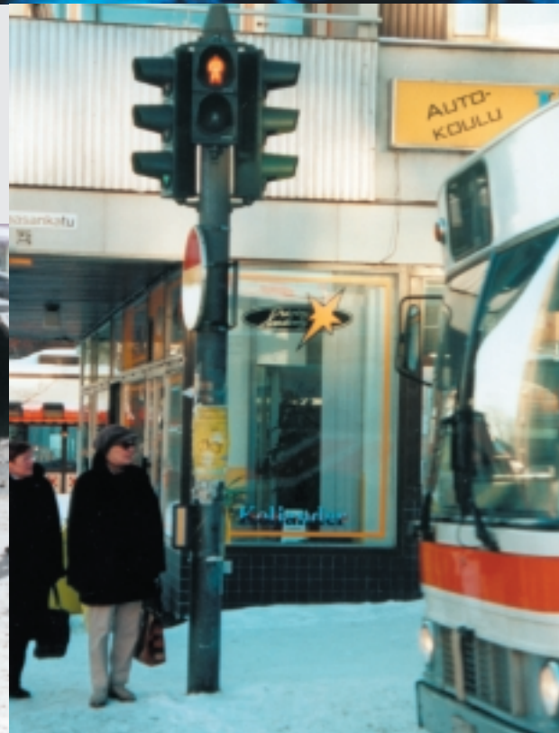
kuvat ja teksti: Mikko Meriläinen