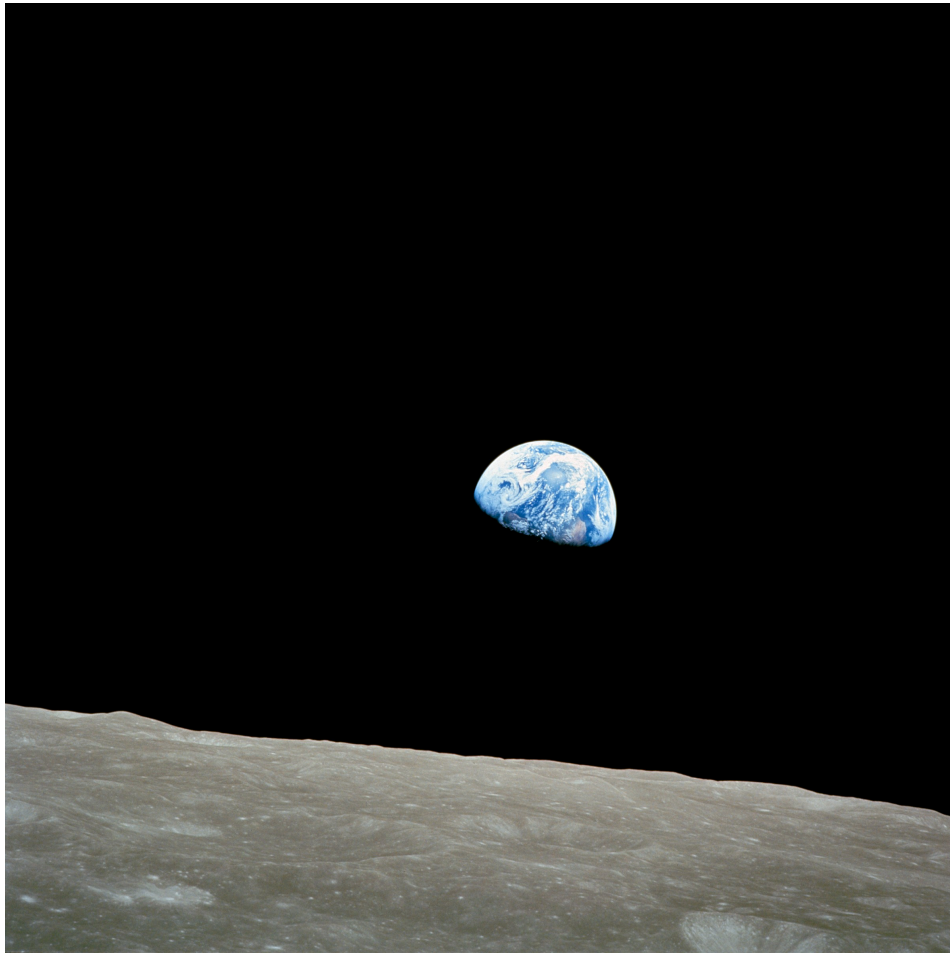
Kuva 1. Earthrise -valokuva (Public domain).

ihmisen aktiivisen roolin sen elinolojen ylläpidossa. Elinkelpoisuus-näkökulma tulee hyvin esiin, koska kontrasti karuun kuun kamaraan on suuri ja tietoisuus etäisyyksien pituuksista on ilmeinen.