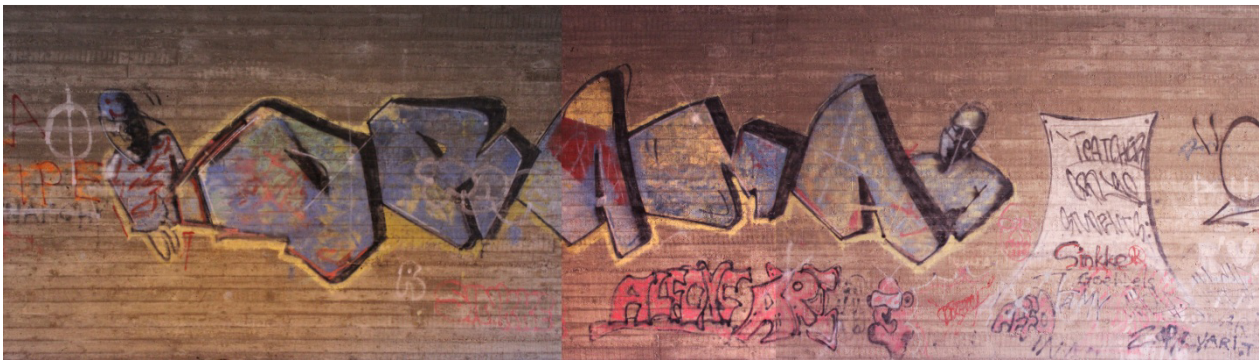
Kuva 35. Cruso: Drama.

Hatsalan ja Kuopion yliopistollisen sairaalan välistä kulkevan, neljakaistaisen Puijonlaaksontien alittavissa tunneleissa sijaitseva Drama -piissi (Kuva 35) tarjoaa mielenkiintoista tietoa graffitimaalareiden oppipoikasuhteisiin liittyen. Maalauksen tarkka ajoittaminen ei onnistu, sillä työstä ei löydy vuosilukua. Kuitenkin maalausta voisi muotokielensä ja värisävyjensä puolesta luonnehtia vanhemman koulukunnan työksi. Työn haalistuneet sävyt kertovat myös sen iästä, ja sen voisi muihin ajoitettuihin töihin vertailtuna arvella olevan peräisin 1980–1990-lukujen vaihteesta. Kiinnostava yksityiskohta löytyy oikeaan reunaan sijoitetusta kyltistä tai paperiliuskasta, joka tuo ilmi jonkin sorttisen oppipoikasuhteen: Kyltissä nimetään ilmeisesti nimellä Cruso maalannut tekijä opettajaksi, ja alapuolella sijaitsee oppilaiden nimet, joita on vaikea erottaa kyltin alapuolelta ja