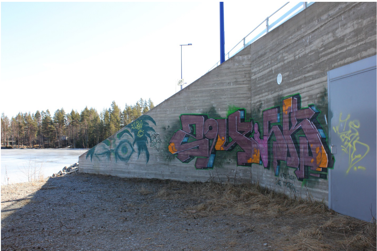
Kuva 6. 2Quick, 2011? Maalaus sijaitsee Korkeasaarella Saaristokadun varrella.

suuri merkitys itse työlle. Varsovan ja Montrealin graffitimaalauksia keskenään vertaillen Chmielewskan mukaan lokaatiot tuovat esille graffitin paikallista omalaatua luonnetta, jota määrittelee kaupungin tarjoamat kankaat – maalauksen mahdollistavat sijainnit rakenteineen ja pintastruktuureineen. 122 Yhden lähtökohdan kuopiolaisuuteen alueen graffitissa voisikin kenties löytää sen sijoittumisesta kuopiolaisiin ympäristöihin ja Kuopiolle luonteenomaisiin rakenteisiin.