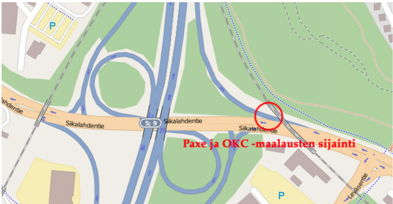
Kuva 13. Paxe ja OKC-maalaukset kartalla. © OpenStreetMapin tekijät.