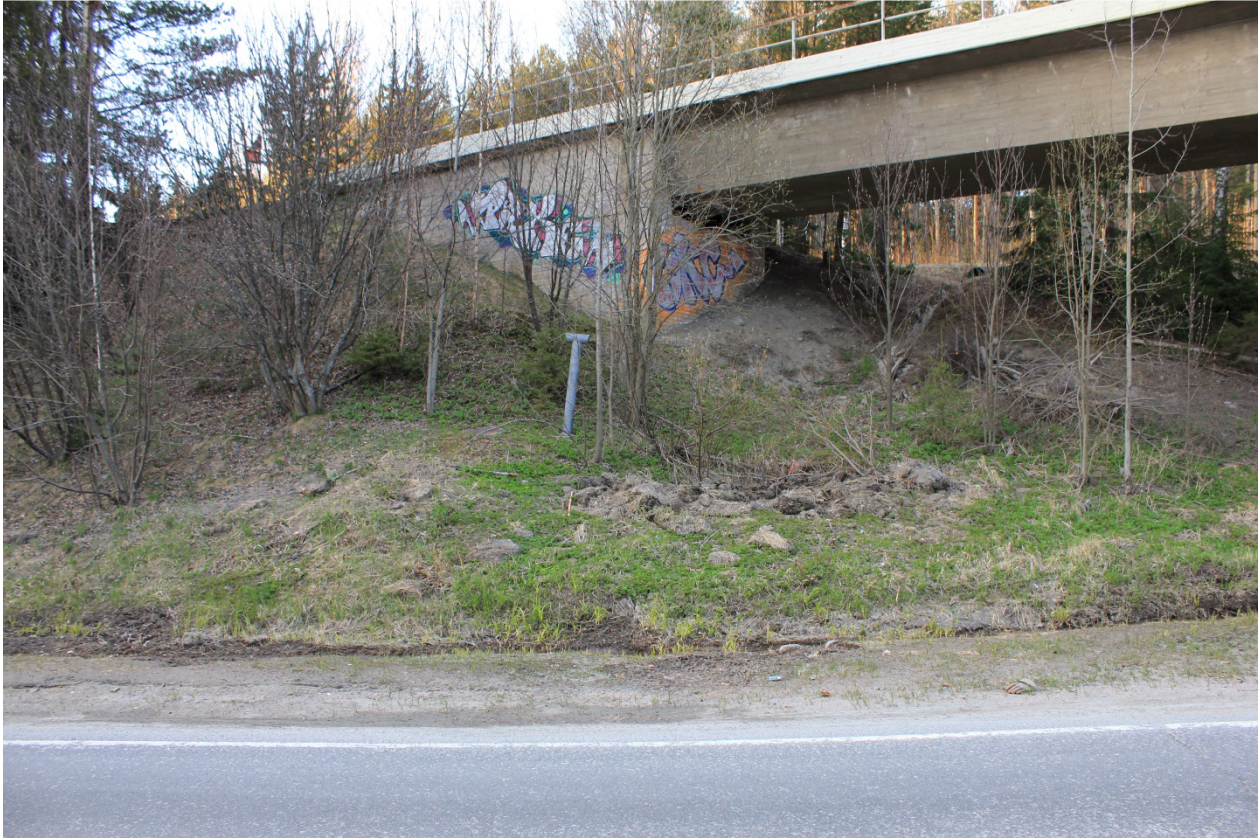
Kuva 12. Paxe , 2013–2014? & OKC 2013. Tasavallankadulta moottoritietä pohjoiseen suuntaavan liittymän varrella.

muuten löytyvän vähemmän liikutuilta alueilta tämän tunnelin sijaitessa aivan ruutukaava-alueen reunalla.