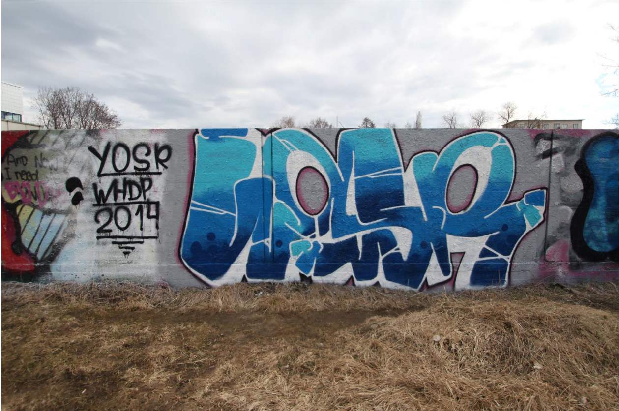
Kuva 45. Yosr, 2014. Luvallinen graffitiseinä.

lukumäärän sijaan. Näin hän tuntuukin edustavan yhtä graffitimaalareiden ääripäätä, toisen ääripään keskittyessä nimen massoittaiseen levittämiseen.