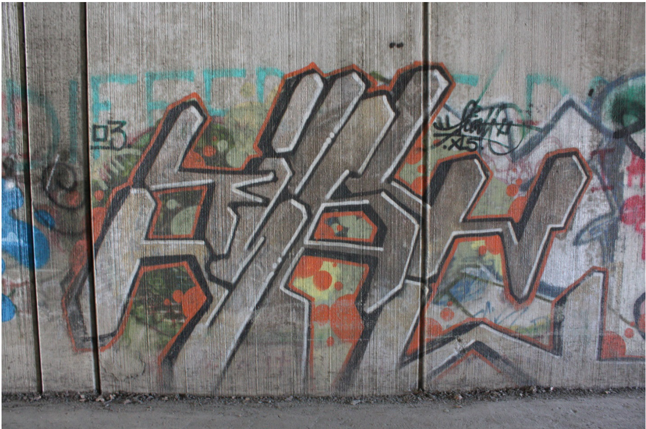
Kuva 37. Fiat, 2003. Maalaus sijaitsee Tasavallankadun alikulkutunnelissa.

on tehty käyttäen kaarevia ja suoria viivoja, joista jälkimmäisiä löytyy enemmän. Kirjaimet koen muodoiltaan epäjohdonmukaisiksi muotojen lennokkaan vaihtuvuuden vuoksi. Ne tuntuvat tyyllisesti kuuluvan yhteen, mutta kirjoituskonemaista jatkuvuutta niistä ei pysty löytämään. Kirjaimien päätteet ja nimeä molemmin puolin reunustava ornamentaalinen viiva sisältävät viitteitä nuoliin, ja paikoitellen näyttääkin siltä, että nuolien kärjet olisi ikään kuin leikattu pois.