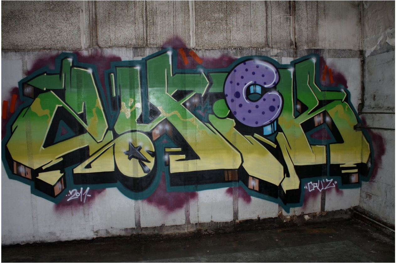
Kuva 41. 2Quick, 2011. Maalaus sijaitsee tulitikkutehtaan toisessa kerroksessa.

Kolmedeet, joihin tekijän maalaamat blinkit tuovat paikoitellen valoa, luovat syvyytsvaikutelmaa. Vahvat outlinet keskeytyvät paikoitellen niiden päällä sijaitseviin blinkkeihin. Muodoiltaan epäsäännöllistä vaihtelua tarjoavien kirjainten linjojen paksuus vaihtelee paikoitellen. Kirjaimiin on käytetty kaarevia ja suoraa viivoja. Kirjaimet limittyvät paikoitellen aavistuksen päällekkäin C-kirjaimen limittymisen määrän tuntuessa poikkeukselliselta suhteessa kokonaisuuteen. Ensimmäisen ja viimeisen kirjaimen reunat lähestyvä symmetrisyyttä, mutta eivät ole kuitenkaan täysin symmetriset. Negatiivisen tilan määrä ei tunnu Q-kirjaimen tähteä lukuun ottamatta poikkeuksellisen vähäiseltä, vaan tavanomaiselta. Nuoliaiheita löytyy numerosta kaksi ja kirjaimista U ja K. Nuolet naamioivat hieman kirjaimia, ja etenkin U-kirjaimen nuoli tuntuu ohjaavan katsetta. Nuolien lisäksi ornamentaalisia elementtejä ovat myös pääasiassa kirjainten päätteiden yhteydessä esiintyvät palikat. Toinen, paksu harmaa outline ympäröi kolmedeitä. Kirjainten takaa näkyy niukan kokoinen savumainen tausta. Punaiset paksut viivat toisten outlinejen ulkopuolella tuntuvat tuovan hieman liikkeentuntua kirjaimiin kokonaisuutena. Gottlieb