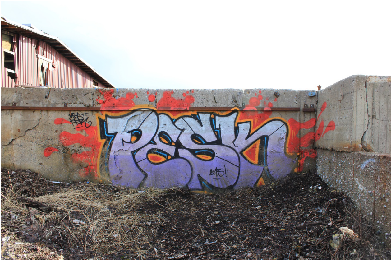
Kuva 48. Pesk, 2013. Maalaus sijaitsee tulitikkutehtaan pihapiirissä.

Kirjainten komposition on ahdas. Ne limittyvät päällekkäin ja negatiivista tilaa on rajoittuneesti. Laitimmaisten kirjainten reunat eivät ole symmetrisiä suhteessa toisiinsa. Kaarevista ja suorista viivoista koostuvien kirjaimien linjojen paksuus vaihtelee monin paikoin. Kirjainten muodoissa on paikoitellen terävää vauhdikkuutta, jota luodaan linjojen paksuuden vaihtelulla, ja kaarevilla viivoilla. Paikoin pehmeän pyöreät ja paikoin veitsen terävät kirjaimet eivät tunnu muodoltaan johdonmukaisilta. Kiillot auttavat hahmottamaan mustaa kolmedeetä, jonka luoman perspektiivin pakopiste on keskellä työtä. Kolmedeetä ympäröi toinen outline, joka on väriltään keltainen. Niukka sininen tausta kuplii. Crew-nimistä, sekä tekijän toisinaan käyttämästä Dirty-etuliitteestä löytyy tarkoituksellisilta vaikuttavia maalivalumia. Maalaus sisältää myös tervehdyksen COV-crew:lle: "YO COV!". Gottlieb'in systeemillä saan piessin analyysin tuloksena sarjan A3B3C2D2E1F3G2H3I3J2K2L1L2M1, joka ei vastaa suoraan mitään suurista tyyleistä.