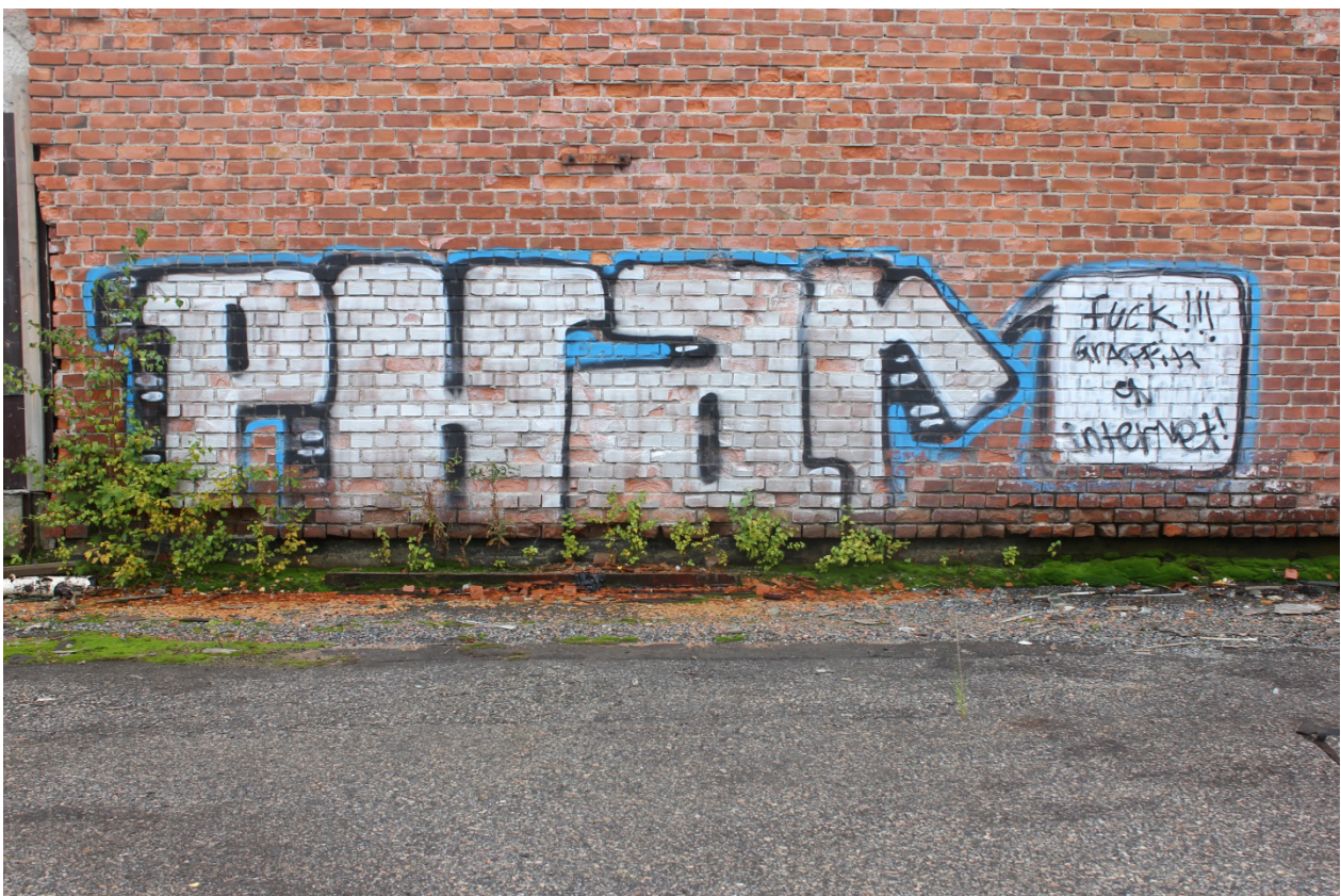
Kuva 1. "Fuck!!! Graffiti on internet!". Phar:in maalaus sijaitsee vanhan tulitikkutehtaan ulkoseinässä.

sekä Instagramissa. Sosiaalinen media onkin ottanut tuntuvaan aseman graffitimaalauksista otettujen kuvien jakamisessa, ja nimekkäillä graffitimaalareilla on hyvin usein Instagram-tili graffiti-identiteettinsä nimissä. Pääosa aktiivisista kuopiolaisista tekijöistä ei tunnu omistavan graffiti-identiteettinsä nimissä olevaa Instagram-tiliä, kenties graffitimaalari Phar:in maalauksessaan välittämä viesti (Kuva 1) kertoo joidenkin alueen tekijöiden asennoitumisesta kuvien levittämiseen sosiaalisessa mediassa. Tästä huolimatta onnistuin löytämään ainakin yhden tutkielmassani käsittelemäni kuopiolaisen graffitimaalarin Instagram-tilin, jonka kautta sain lisätietoa tekijän maalaukseen liittyen.