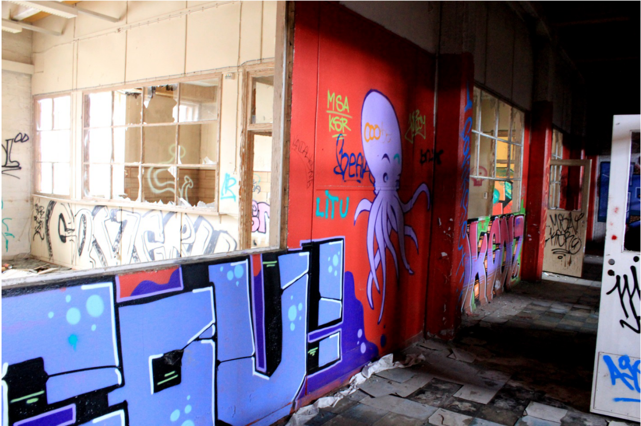
Kuva 23. Näkymää tulitikkutehtaan yläkerrasta. Ikkunoiden alapuolelle jäävässä tilassa näkyvät piissit COV ja OKCOV.