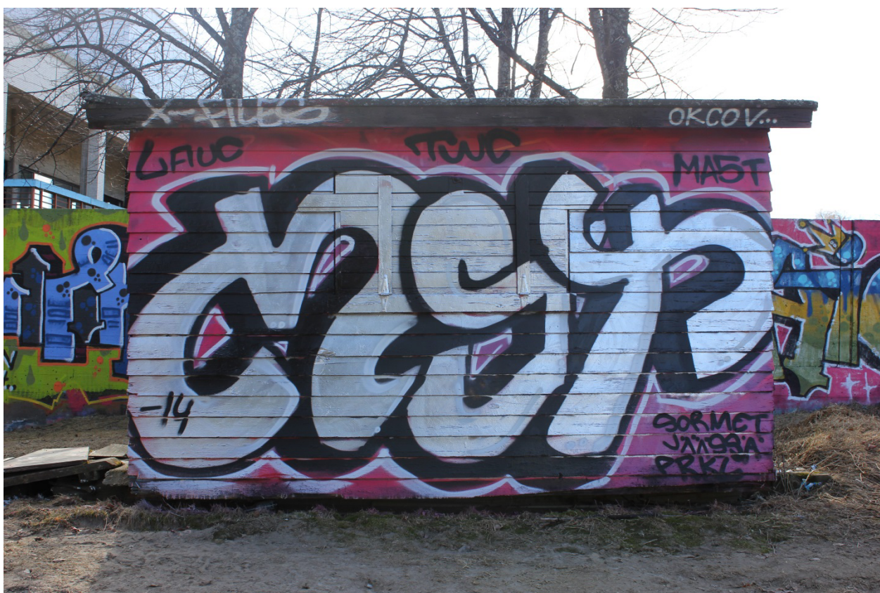
Kuva 4. Sormet jäässä prkl. Mast: MST, 2014. Piissi sijaitsee luvallisen graffitiseinän vieressä.

Castlemanin mukaan graffitimaalarit ovat toistensa innokkaita kriitikkoja. 61 Tyypillinen esimerkki on maalauksen yhteyteen kirjoitettu termi toy (tai suomenkielinen käänös lelu ), joka merkitsee vähäpätöistä. 62 Graffitiin päälle maalattuna se on kritiikin muoto, joka ilmaisee tekijän joko olevan kyvytön tai sitten aloittelija, joka ei vielä hallitse tekniikoita. Maalauksien yhteyteen ilmenevä kritiikki tai kommentit saattavat päätyä sanojen vaihtoon piissin yhteydessä sen maalaajan vastatessa niihin, kuten tässä luvalliselta graffitiseinältä löytyneen Jasf -piissin päällä käydyssä keskustelussa, jossa nimetön kriitikko julistaa maalauksen tekijän leluksi ja työn baitatuksi 63 (Kuva 5). Kritiikin joukossa on herjaava väänös graffitimaalarin crew-nimen akronyymien merkityksestä ” MDFK = Mindfucked Kids ”, johon on vastattu akronyymien oikealla merkityksellä kenties piissin tekijän toimesta. Kuva on otettu luvalliselta graffitiseinältä keväällä 2013, jolloin vastaavaa kritiikkiä löytyi useasta työstä.