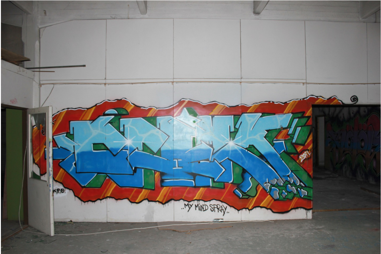
Kuva 25. Tulitikkutehtaan toisen kerroksen tiloja. Kuvassa Crimy, 2011.