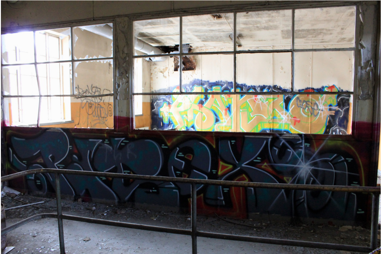
Kuva 21. Näkymä yläkertaan vievän portaikon yläpäästä tulitikkutehtaalla. Ikkunoiden alapuolella Patex. Takana olevassa huoneessa Pharao, 2011, joka on jyrätty Coosen toimesta.