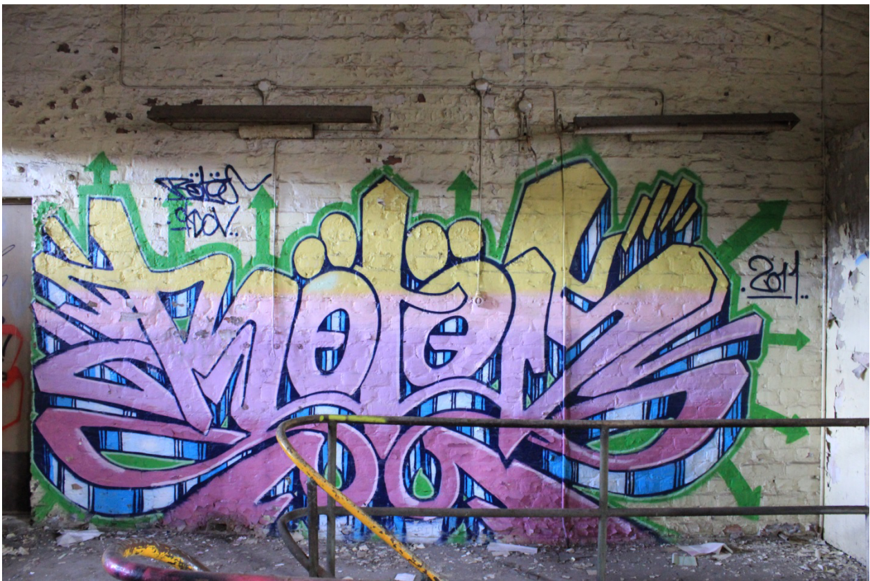
Kuva 20. Rötös, 2011. Piissi sijaitsee Tulitikkutehtaalla yläkerran tiloihin vievän portaikon yläpäässä.

Suurin maalauskeskittymä löytyy kuitenkin yläkerrasta, jossa sijaitsevat entiset henkilökunnan pukuhuoneet ja toimistotilat. Hallia halkovan seinämän toiselta puolelta löytyy nurkasta portaat (Kuva 19). Graffitit johdattelevat yläkertaan päätyville portaille, joille on kaatunut maalia. Alakerran näkymät eivät aivan täysin kykene valmistamaan ensikertalaisen odotuksia kohtaamaan portaiden yläpäässä odottavia näkymiä. Ensimmäisenä huomaa tilan päädyssä, portaikon sivussa värikkään ja yksityiskohtaisen, Rötös -piessin (Kuva 20). Toisella puolella portaikkoa avautuu näkymä ikkuna-aukkojen läpi huoneeseen, jonka seinää täyttää toinen suuri ja värikäs, Pharao -piissi. Coose on jyrännyt piessin maalaamalla sen päälle taginsa, jollaisia näkyy sisätiloissa paikoitellen muidenkin piissien päällä (Kuva 21). Ikkuna-aukkojen alle jäävää seinätilaa peittää Patex -piissi joka osuu näkökenttään yhtä aikaa ikkuna-aukosta näkyvän Pharaon työn kanssa. Maalauksissa on jotain kaoottista, mutta samalla ne tuntuvat kuitenkin järjestelmällisiltä ja tarkoituksenmukaisilta.