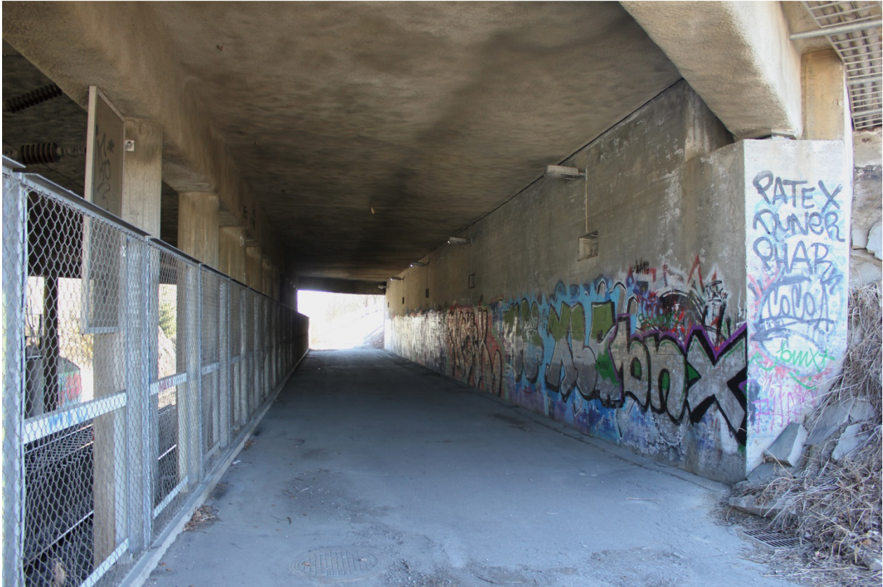
Kuva 10. Puistokadun alittava tunneli. Maalausten kerroksellisuus näkyy kevyen liikenteen tasolla olevassa seinämässä.

Kuopiolainenkin graffiti myötäilee paikoitellen junarataa, mikä näkyy radanvarren välittömässä läheisyydessä olevien seinien käyttämisessä maalaus pohjana. Keskeisimpiä radanvarsipaikkoja luvallisen graffitiseinän ohella ovat keskustan ruutukaava-alueen reunamilla sijaitseva Karjalankadun alittava kevyen liikenteen ja junaliikenteen yhteinen alikulkutunneli (Kuva 10, Kuva 8), jonne päätyy kulkiessaan lailliselta seinältä uimahallin vieressä sijaitsevan tagailtun keilahallin takaseinän ohitse. Tunnelin toisella puolella sijaitsee kuvassa vasemmalle puolelle asettuva Iso hautausmaa, ja oikealla puolella tulee vastaan ruutukaava-alueen laitaan sijoittuvien rakennusten seinät. Graffitien esiintyminen jatkuu ruutukaava-alueen reunalle sijoittuvien rakennusten radan puoleisissa seinissä ja myös paikoitellen radan tasolla sijaitsevilla seinämissä. Junarata tuntuu olevan keskeisesti graffitimaalauksien sijainnin valintaa määrittäneenä tekijänä, minkä seurauksena junarataa myötäilee nauhamainen graffitien alue lähtien edellä käsitellyltä luvalliselta graffitiseinältä kohti juna-asemaa. Rakennusten seinillä on maalauksia myös viime vuosikymmeneltä ja esillä on alueella epäaktiiviseksi muuttuneita nimiä. Maalauksia on tehty muun muassa