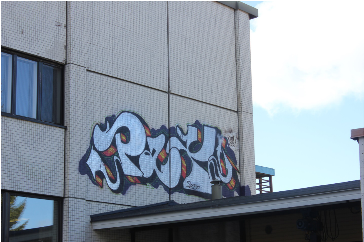
Kuva 9. Pax, 2014. Uimahallin seinään maalattu piissi.

uppeja ja rantalentopalloiluun liittyen paikalle jätetyn parakin seiniin on maalattu. Maisemallisesti muurin aluetta määrittelee keskeisesti junarata ja avoimeen kaupunkiympäristöön sijoitetut urheiluhallit: uimahalli muurin puolella ja vastapäätä muuria, radan toisella puolella sijaitseva Kuopio-halli. Niiralan montuksi kutsutulla alueella sijaitsevat uimahallin lisäksi myös keila- ja jäähalli, sekä Venäjän vallan aikaisia punatiilisiä entisiä kasarmirakennuksia. 131