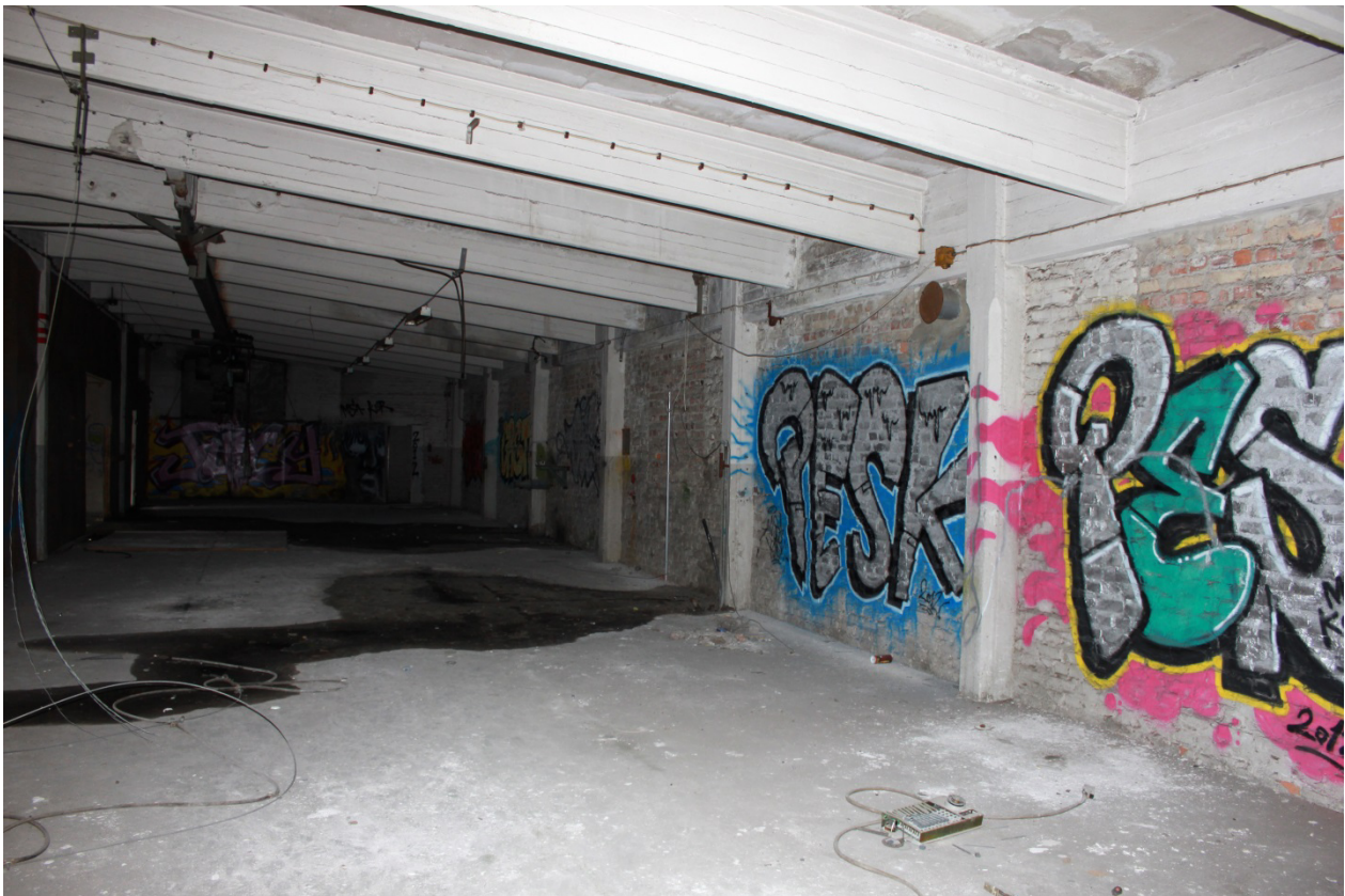
Kuva 26. Tulitikkutehtaan toisen kerroksen tiloja. Tiiliseinä tuo oman luonteensa maalauksille.