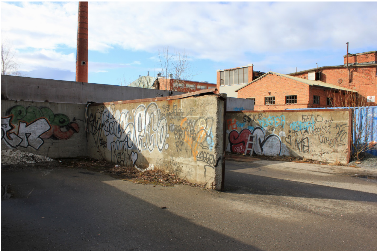
Kuva 17. Tulitikkutehtaan pihapiirin betoniseiniä.

Tulitikkutehtaan alueelle saavuttaessa voi jo aavistaa seinien kätkevän sisäänsä runsaslukuisen graffitien maailman. Tehtaan vieressä sijaitsevan, myöhemmin rakennetun hallirakennuksen ulkoseinään (Kuva 15) on maalattu pari piisiä. Saman rakennuksen sisällä on esillä hieman suurempi näyttely: Rakennuksen avoimesta, verkkoaidalla suljetusta päädyistä näkee katon alla sijaitsevan maalausten keskittymän (Kuva 16). Sisällä näkyy kaksi rakennuksen pituista tilaa seinämien halkaistessa graffitien omaehtoisen näyttelytilan kahteen osaan tarjoten runsaasti seinäpintaa. Maalauksien rivi löytyy jokaisesta neljästä betonisesta seinäpinnasta. Mielenkiintoisen havainnon voi tehdä verratessaan vierekkäisten töiden väliin jäävää tyhjän tilan määrää, jota on tavallisesti sen verran, että maalauksia pystyy tarkastelemaan yksilöinä ilman viereisten maalausten sulautumista osaksi samaa kuvaa.