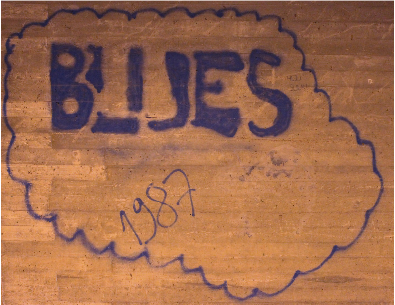
Kuva 27. Blues, 1987.

keskeiseen graffitiin. Kuitenkin kuvassa on implisiittisiä viitteitä siitä, että tekijän esikuvana ovat toimineet väljät mielikuvat piisseistä tässä ilmeisen varhaisessa kokeilussa. Maalaus saa osakseen myös nimetöntä kritiikkiä: "YOU SUCK!" on kirjoitettu pienin kirjaimin S-kirjaimen oikealle puolelle (Kuva 27).