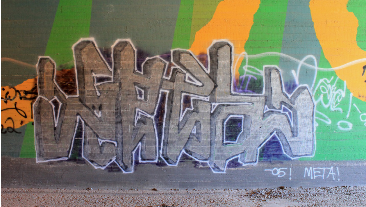
Kuva 38. Tyylien kopiointia. Meta, 2005. Maalaus sijaitsee moottoritien ja Puijonlaaksontien alittavissa tunneleissa.

kirjaimista osan ollessa muotojensa puolesta lukukelvottomia, kun taas Fiatin piississä kaikki kirjaimet ovat selkeästi tunnistettavissa.