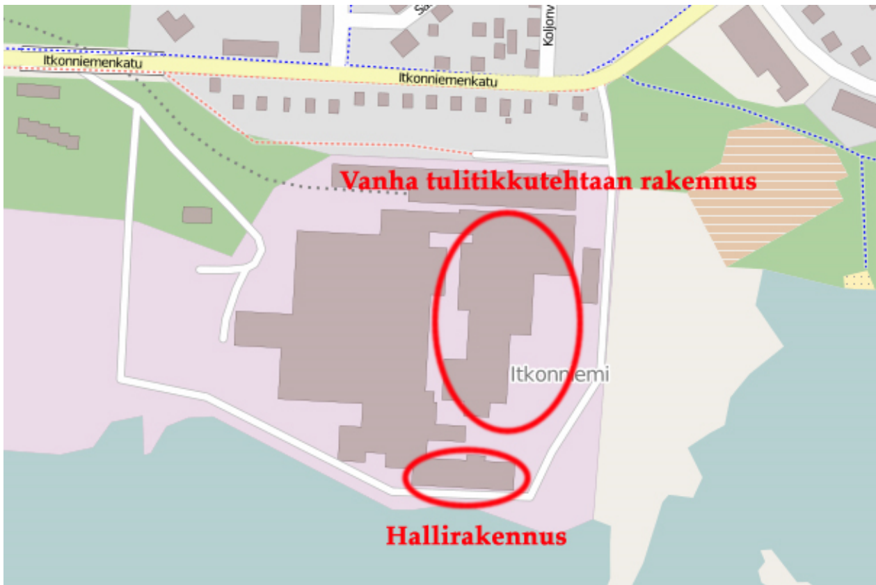
Kuva 15. Tulitikkutehtaan alueen graffitigalleriat.