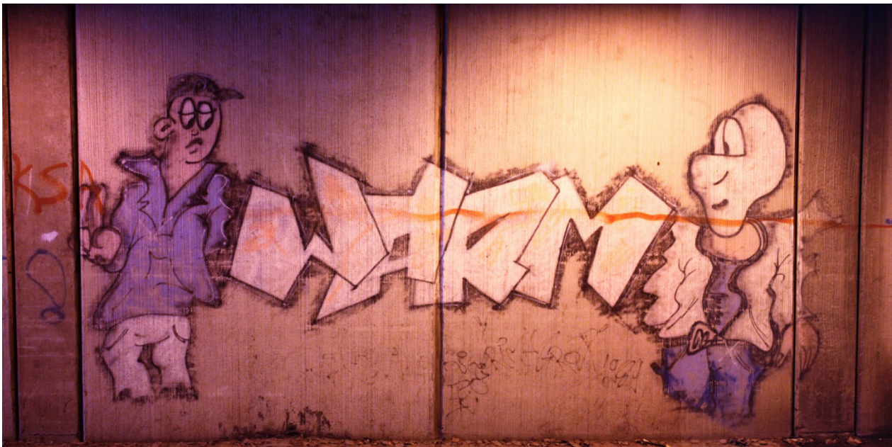
Kuva 32. Crime Group: Warm, 1989.

päälle. Futuristisessa, sarjakuvamaisesti abstrahoidussa hahmossa on jäntevää liikettä. Hahmon alapuolella esiintyvät myös nimet Kini ja Eki, joiden voisi – verrattaessa muiden kuopiolaisten ajan töiden signeeraustapaan – olettaa olevan maalauksen tekijöiden signeerauksia. Gottliebin järjestelmällä analysoimalla saan Acmelle (Kuva 31) aikaan seuraavan sarjan: A3B3C2D1E3F3G2H3I3J2K2L3L5M2. Saamani piirteiden sarja ei vastaa suoraan mitään Gottliebin korkeiden tyylien sarjoista.