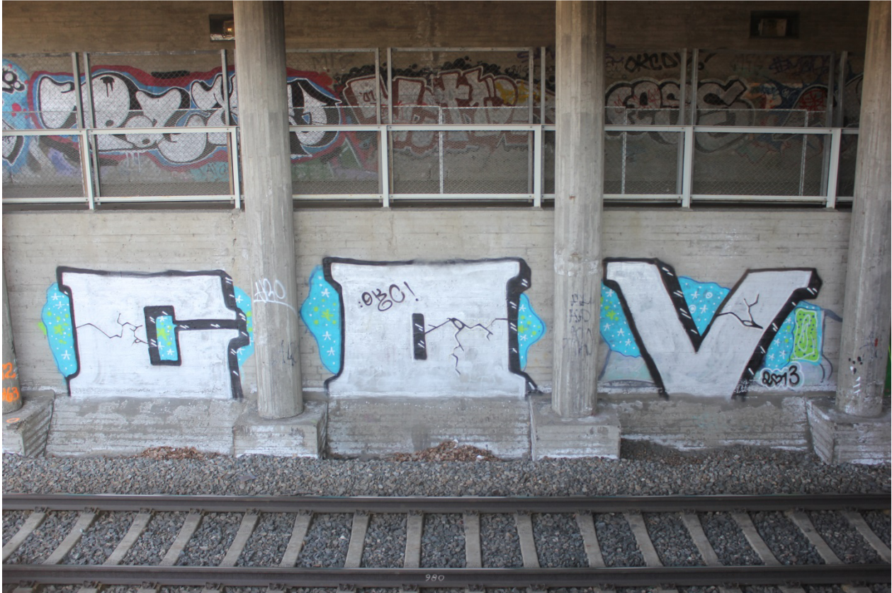
Kuva 11. Graffiteja Puistokadun alittavassa tunnelissa junaradanvarrella. Edessä alhaalla COV, 2013. Ylhäällä piissit vasemmalta oikealle Pax, Vetter & Fess.

kerrostalon pihapiirin puisen roskakatoksen seinään, punatiiliseinään ja vanhasta Kuopiosta muistuttavan, nykyisin Steinerkouluna toimivan puutalon kivijalkaan.