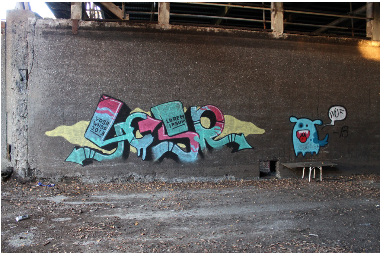
Kuva 46. Yosr, 2013. Maalaus sijaitsee tulitikkutehtaan pihapiiriin myöhemmin rakennetussa hallirakennuksessa.

Keskeytymättömän valkoisen outlinen jatkeena yksiväriset kolmedeet luovat perspektiivin, jonka pakopiste sijaitsee keskellä alhaalla. Kolmedeehen ulottuvat valkoiset viivat pilkkovat kirjaimia luoden vaikutelmaa murtumista. Toiset, mustat outlinet, ja kevyt varjostus ympäröivät kolmedeetä irrottaen työn taustastaan voimakkaalla kontrastilla. Toisen outlinen ulkopuolella sijaitsee vielä kevyt varjostus. Yksiväriset kolmedeet ja toisen outlinen luoma voimakas kontrasti vahvistavat tunnetta siitä, että maalauksessa pyritään korostamaan kirjaimia. Työstä ei löydy nuolia, mutta siinä esiintyy koristeellisia paloja. Gottliebin systemillä saan kuva-analyysistä rakennettua sarjan A2B2C2D2E1F3G2H1I3J2K2L2L3M1, joka ei vastaa korkeiden tyylien määritteleviä piirteitä.