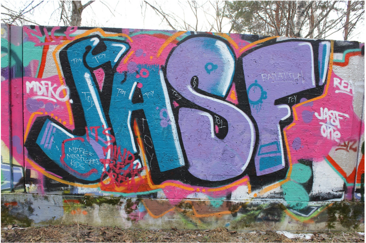
Kuva 5. Taidekriittikiä luvallisella graffitiseinällä.