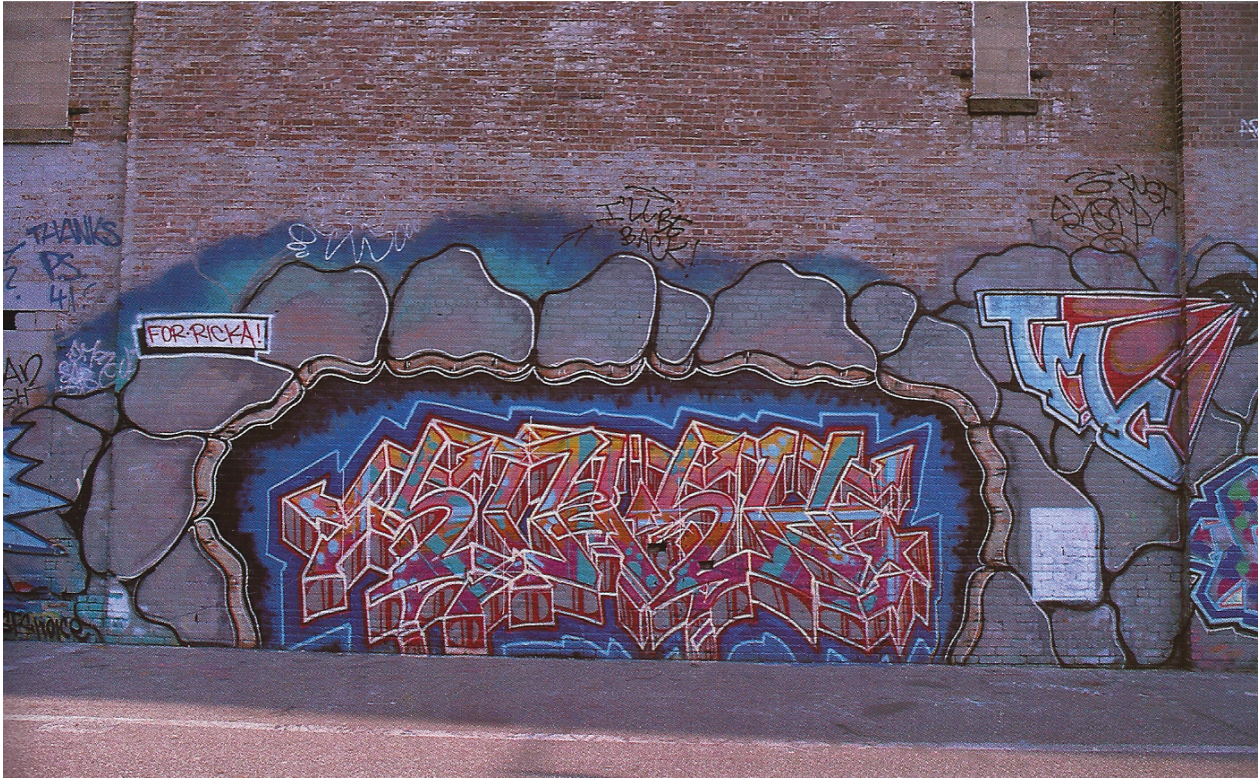
Kuva 30. Stash, 1985.

Moottoritien alittavan tunnelin luonteikkuudellaan ja toteutuksen tasolla vaikuttavimmilta tuntuvat työt ovat attribuoitavissa CGA lyhenteiselle (Kuva 31), kenties Crime Group Artists -nimiselle crew:lle. Nimi on haalistunut hieman epäselväksi, mutta Crime Group on selkeästi luettavissa kahdessa työssä, ja Artists olisi erittäin tyypillinen A-kirjaimella alkava viimeinen sana crew:n nimessä. Piissien alle kirjoitettujen tekijätietojen ja töihin liitettyjen viestien kirjainten perusteella voisi päätellä, että tunnelissa on kolme samojen tekijöiden tekemää työtä, vaikka yhden piessin tekijöiden nimet ovatkin kuluneet lukukelvottomiksi.