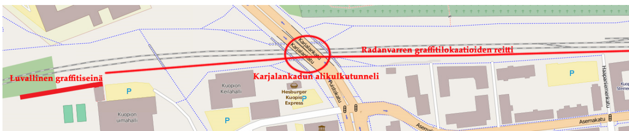
Kuva 8. Kartta luvallisesta graffitiseinästä ja radanvarren lokaatioista keskustassa. © OpenStreetMapin tekijät.

Moniväriset suuret piissit alkavat heti muurin päästä ja peittävät sen koko matkalta. Lukemattomat maalikerrokset muurin betonisella seinäpinnalla hilseilevät, mikä tuo maalauksiin paikoitellen näkyvää pintatekstuuria. Myös muurin vieressä sijaitseva pieni puinen rakennus on maalausten peitossa. Toisella puolella muuria on muutamia throw