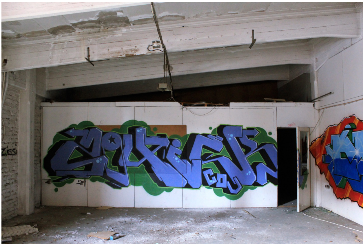
Kuva 42. 2Quick, 2011. Tulitikkutehtaan toinen kerros.

Läheisimmin sarja kohtaa CTK-tyylin määrittelevät piirteet, joista se poikkeaa luettavuuden ja outlinejen osalta.