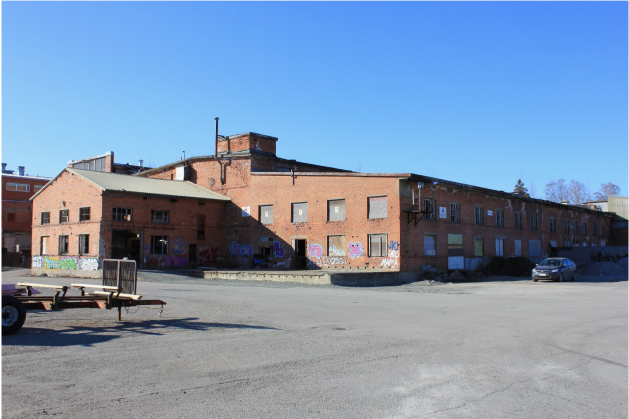
Kuva 14. Tulitikkutehdas.