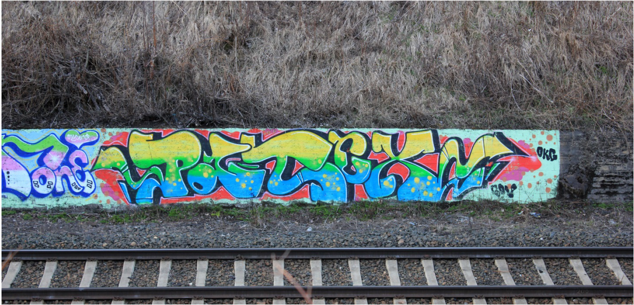
Kuva 43. Patex, 2013?. Maalaus sijaitsee keskustan ruutukaava-alueen reunassa junaradan varrella.

Keskustan ruutukaava-alueen ja Ison hautausmaan välissä kulkevan junaradan seinämässä sijaitseva piissi (Kuva 43) edustaa pientä poikkeusta tekijän tyypilliseen tyyliin, sillä johdonmukaisesti jatkuva filli on kolmivärinen monokromaattisen, silverille tyypillisen fillin sijaan. Fillin värit vaihtuvat keltaisesta vihreään ja lopulta siniseen nopeasti terävästi liukuen. Keltainen väri on läsnä myös vihreän ja sinisen yhteydessä pieninä kuplamaisina ympyröinä. Filliin tuo väriä myös kirjaimien laitamia mukailevat kiillot. Musta vahva outline rajaa hieman päällekkäin limittyviä kirjaimia. Se jatkuu vaaleanpunaisen toisen outline rajaamana kolmedeenä. Patexin kirjaimien muotoihin kuuluu olennaisesti paikoitellen liioitellut mittasuhteet ja negatiivisen tilan vähyys, jotka ovat läsnä myös junaradan varressa sijaitsevassa maalauksessa. Vaihtelevan paksuisista linjoista koostuvat kirjaimet on toteutettu kaarevilla viivoilla. Helposti luettavien kirjainten muodot painottavat sanan ylä- ja alareunoja pullistumillaan. Varsinkin P- ja T-kirjainten suuret massat tuntuvat painavilta. Kirjainten muotoilu ei tunnu johdonmukaiselta, ja voisikin olettaa, että mikäli työssä esiintyisi samoja kirjaimia, ne saisivat toisistaan poikkeavia muotoja.