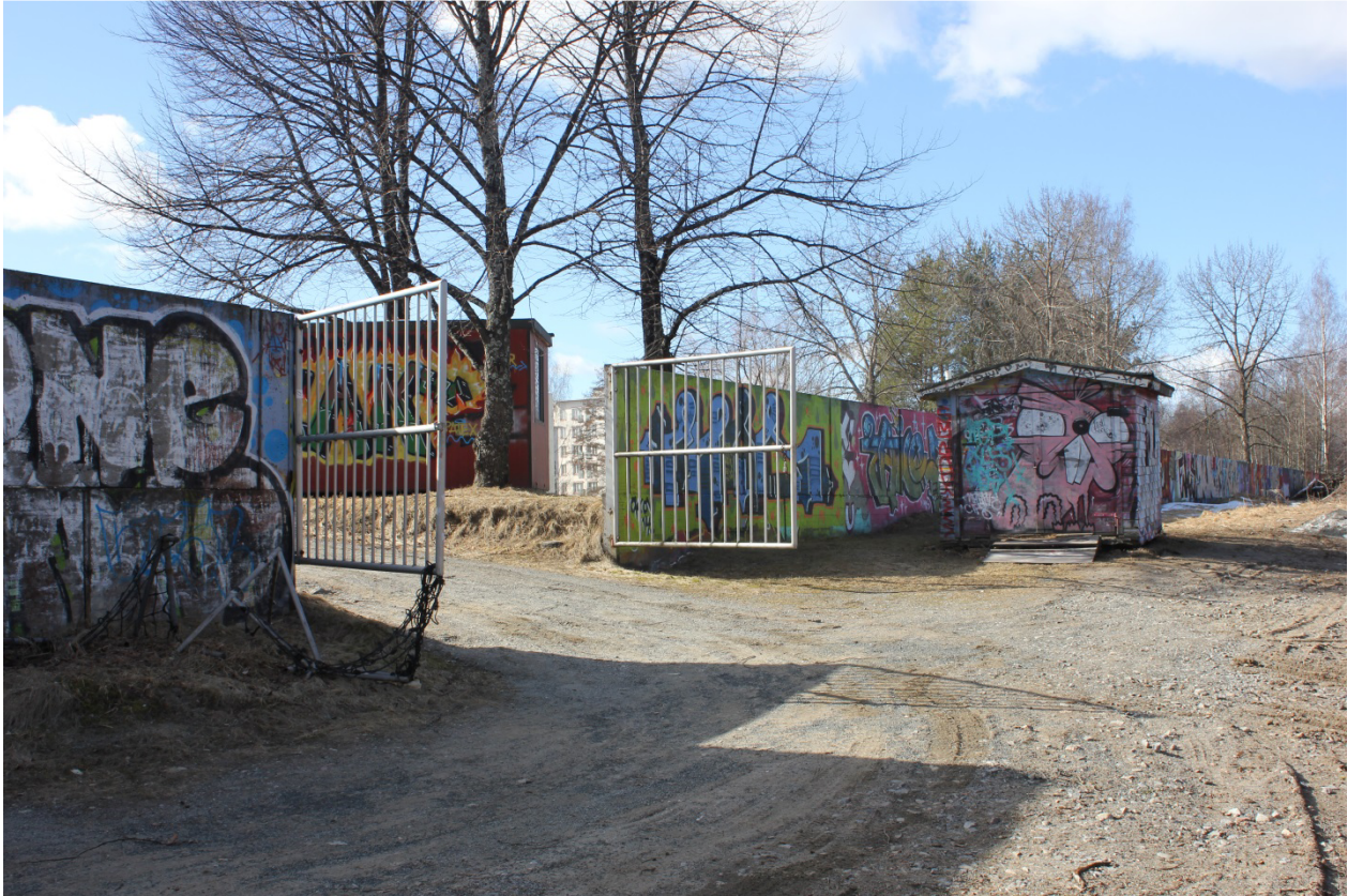
Kuva 7. Luvallinen maalauspaikka Kuopion uimahallin muurilla.

maalauksia löytyy jo uimahallin seinämistä läheltä muuria. Ensimmäisen kerroksen tasolla olevan katoksen yläpuolella näkyy Patexin uimahallin seinään maalaama Pax-piissi, jolle rakennuksen seinälaatat antavat oman luonteensa (Kuva 9).