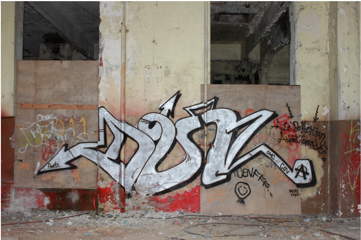
Kuva 3. Dun, 2013. " Le` Bohemian Avant Garde ". Maalaus sijaitsee tulitikkutehtaalla.

voi esiintyä myös akronyymeina. 57 Esimerkkinä kuopiolaisesta piessin yhteydessä ilmenevästä viestistä käy hyvin Dun -piessin yhteydessä kenties tekijää tai crew:ta kuvaavana viestinä toimiva " Le` Bohemian Avant Garde " (Kuva 3). Viestit voivat liittyä myös piessin onnistumiseen. 58 Esimerkkinä Mast nimeä käyttävän graffitimaalarin kirjoitus " sormet jäässä prkl " kertoo kylmistä olosuhteista, ja sen voisi nähdä kommentoivan sitä, että tekijä ei koe kyyneensä parhaimpaansa (Kuva 4). Piessin yhteydessä voi esiintyä myös crew:t – kuten Dunin piississä näkyvä OKC COV (Kuva 3), listaus oman crew:n jäsenistä tai mukana olleista graffitimaalareista 59 , omistuskirjoitus tai tervehdys muille graffitimaalareille (Kuva 47). 60