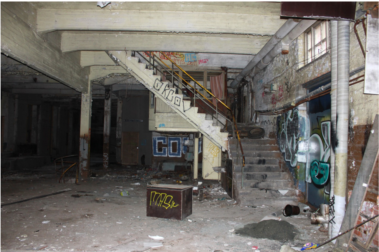
Kuva 19. Yläkertaan johtava portaikko.