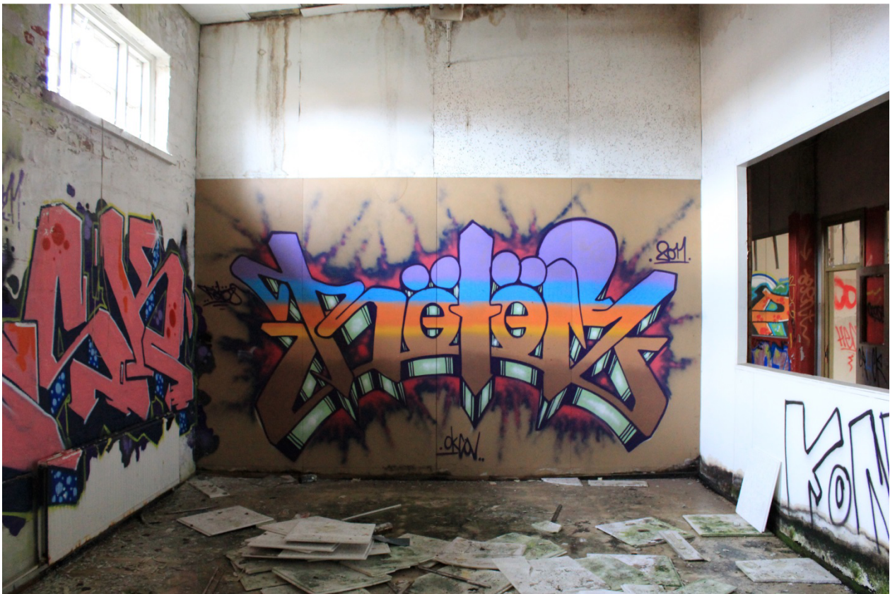
Kuva 24. Rötös, 2011. Huone tulitikkutehtaan yläkerrassa.