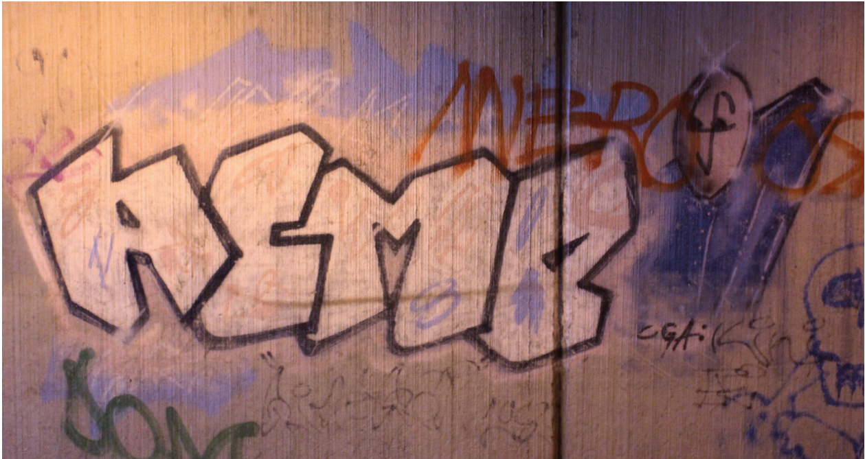
Kuva 31. Crime Group: Eki & Kini: Acme , 1989.

Hahmot vaikuttavat velton rennoilta, eikä niistä löydy edellisen Acme -piessin charan omaamaa jänteveyttä. Gottliebin systeemi keskittyy graffitin tyylin analysointiin sen sisältämän tekstin kautta, joten hahmoja siinä ei ole huomioitu. Hahmot tuovat mielenkiintoisen lisän graffitiin, sillä ne voi usein nähdä graffitimaalarin omakuvina. 201