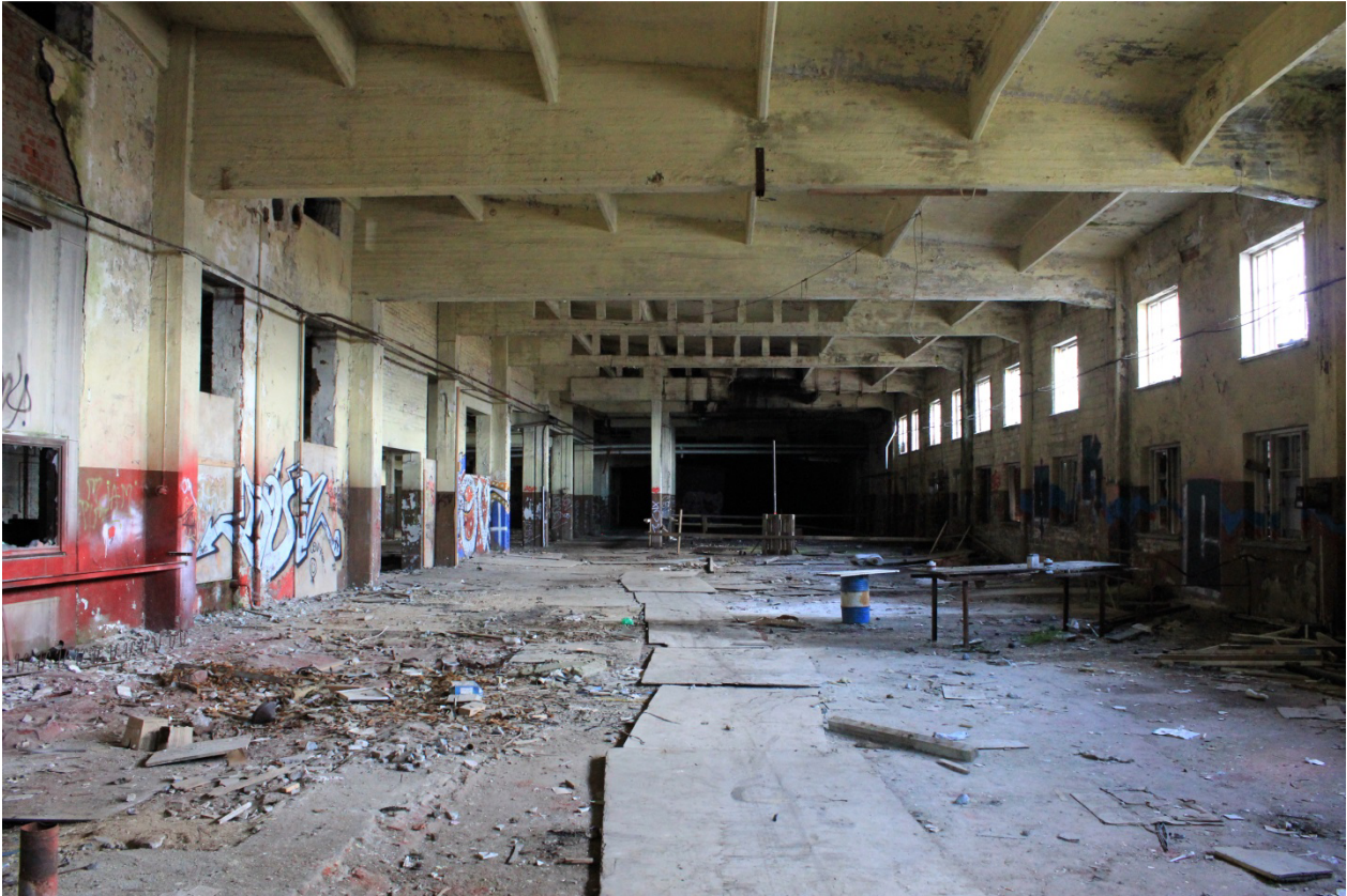
Kuva 18. Tulitikkutehtaan sisätiloja: näkymä halliin päädyn sisäänkäynnin (Kuva 14) suunnasta.