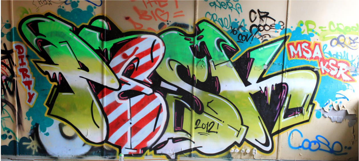
Kuva 47. Pesk, 2012. Maalaus sijaitsee tulitikkutehtaan toisessa kerroksessa.

on lähimpänä swedish train-tyyliä, mutta siihen kuuluu yhtenä määrittelevänä piirteenä rajoitettu negatiivinen tila.