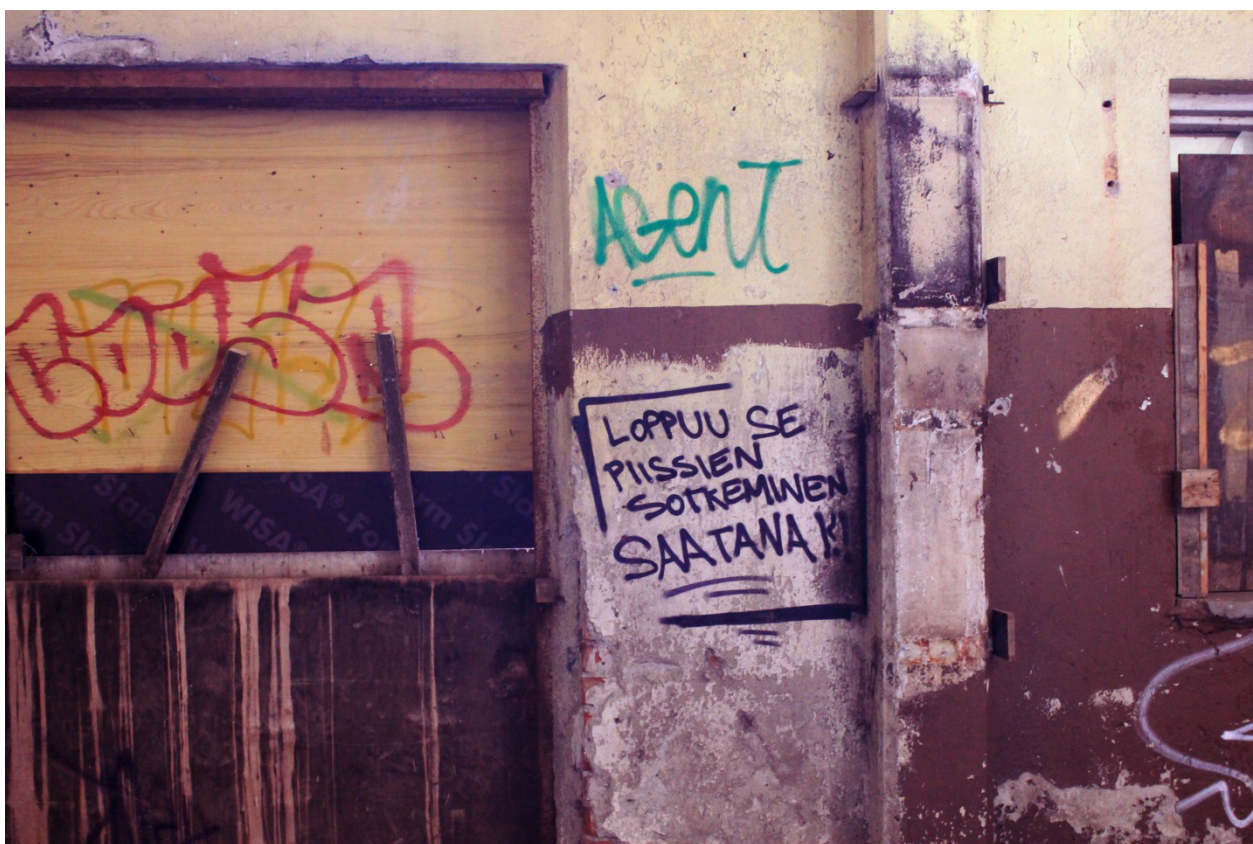
Kuva 2. "Loppuu se piissien sotkeminen saatana!!!" Viesti tulitikkutehtaan sisäänkäynnin lähellä.

mestartiteoksena, joten piissien kohdalla jyräämiseen kuuluu myös taideteoksen tuhoamiseen liittyvä kokemus, mitä kuvastaa myös Castlemanin haastatteleman Tracy 168:n analogia piissin jyräämisestä museon seinillä olevien töiden repimiseen. 55 Itkonniemen tulitikkutehtaalle kirjoitettu viesti kertoo kuopiolaisten graffitimaalareiden suhtautumisesta jyräämiseen (Kuva 2). Jyrääminen tuo esille graffitikulttuurista itsestään lähtevän väliaikaisuuden: Pieninkin maalimäärä työn päällä riittää siihen, että työn katsotaan tuhoutuneen, jolloin päälle maalaamisen kynnyks alenee. 56