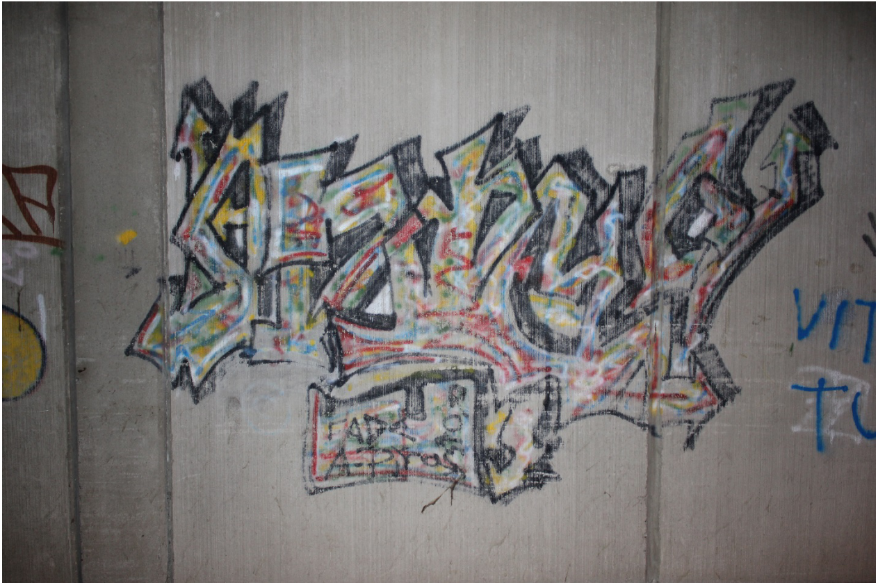
Kuva 29. Fade: Ruby?, 1990?

vuotta myöhäisemmän tyylin nähdään pohjautuvan klassiseen 1980-lukulaiseen metrograffiitiin. 198 Tämä vahvistaa näkemystäni siitä, että Andyn ja Faustuksen toteuttama maalaus voidaan kenties nähdä yleistyksenä medioiden ja populaarikulttuurin tarjoilemasta, newyorkilaiseen graffitiin liittyvästä kuvastosta ja käsityksestä.