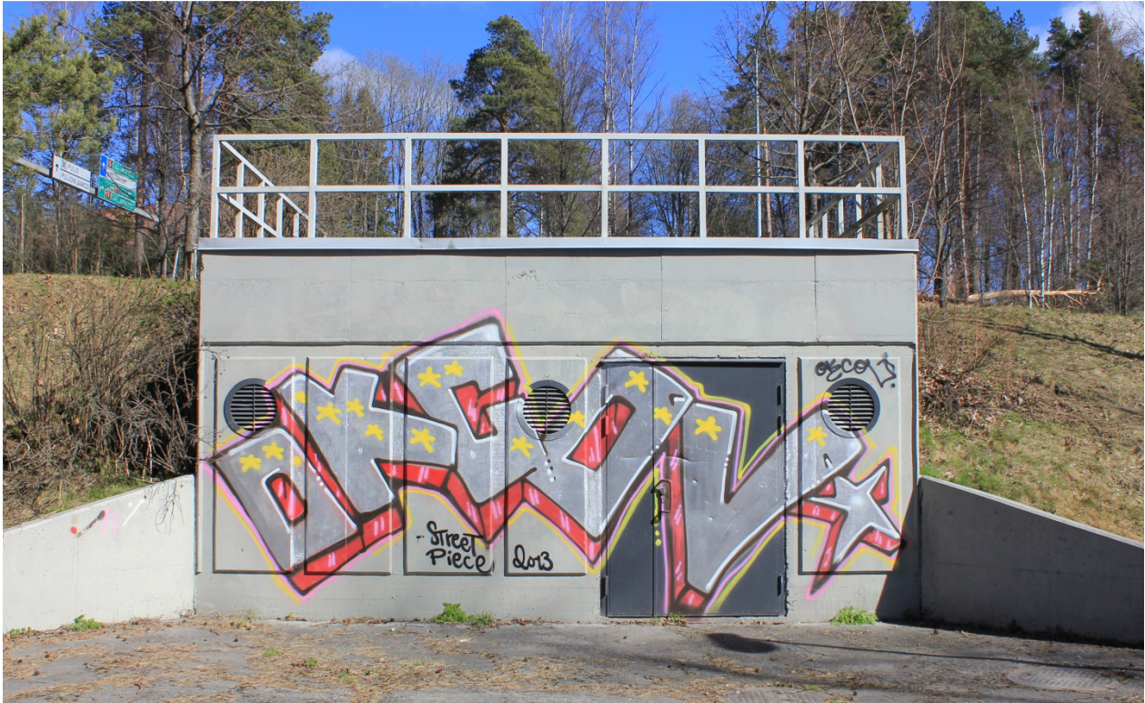
Kuva 39. OKCOV, 2013. Maalaus sijaitsee Puijonkadun ja Ison hautausmaan välissä kulkevan kevyen liikenteen väylän varrella.

Aktiivisuutensa ja ilmaisullisen moninaisuutensa vuoksi keskeisimmiksi crew:ksi nousee OKC ja COV 216 . Nimi tulee vastaan ympäri kaupunkia tageissa ja piisseissä. Se esiintyykin Kuopiossa siinä määrin, että myös Savon Sanomat ovat pyytäneet vinkkejä siitä, mitä nimi tarkoittaa ja ketkä sitä maalaavat. 217 Ison hautausmaan viereisen kevytväylän varrelta löytyvä kaareva OKCOV-piissi (Kuva 39) on edellä käsitellyn Fiatin tavoin määriteltävissä hopeaisen fillin perusteella silveriksi. Maalaus ei tarjoa tekijästään suoraa tietoa sen lisäksi, että hän tai he kytkeytyvät OKCOV:iin.