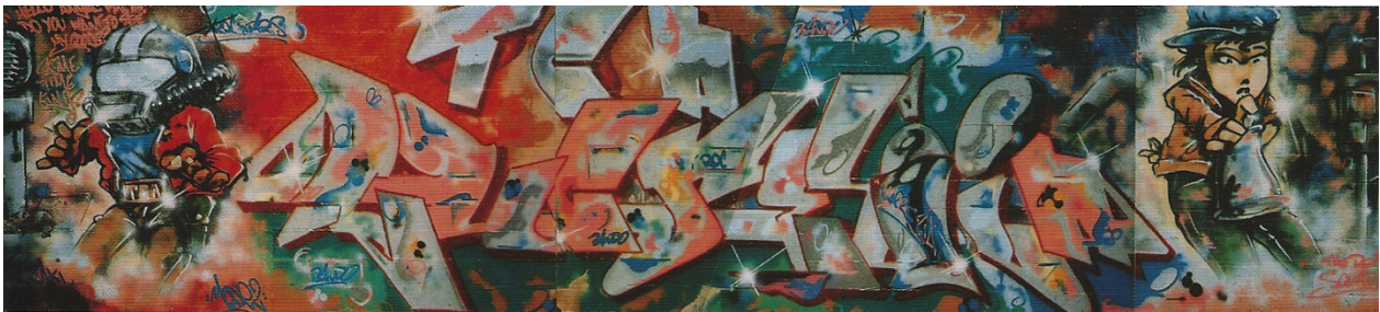
Kuva 33. Bando & Mode 2: TCA, Lucrezia, 1985.

Gottliebin luokittelujärjestelmällä sain Warmille (Kuva 32) sarjan A3B2C2D2E1F2G2H3I3J2K1L5M1, joka ei taaskaan vastaa täysin minkään tyyliisuunnan määritteleviä piirteitä. Näitä kahta CGA:n työtä tyyllillisesti yhdistävistä tekijöistä vahvimaksi nousevat graafiset kirjaimet. Töissä käytetyistä kirjaimista voisi myös vetää visuaalisen linjan suoraan 1980-luvun suurimpiin Eurooppalaisiin nimiin. Kirjainten graafinen, kulmikas ulkomuoto saa aikaan vahvan mielleyhtymän ajan keskieurooppalaisen graffitin nimekkäisiin tekijöihin, joka kuvien kautta analysoimalla vain vahvistuu entisestään.