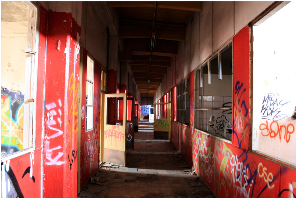
Kuva 22. Tulitikkutehtaan sisätiloja. Yläkerran toimistohuoneita.