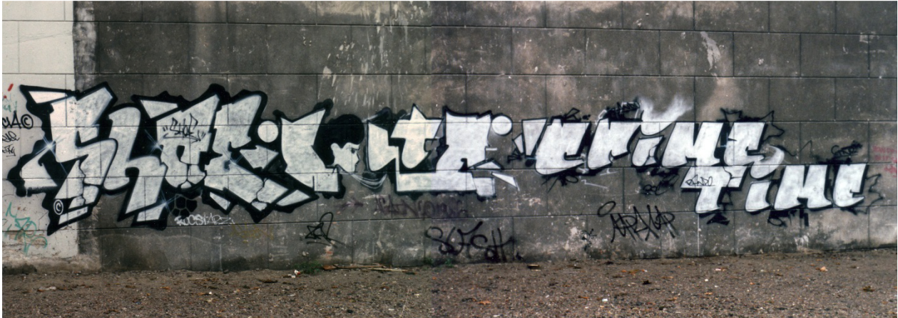
Kuva 34. Crime Time Kings piisessä Amsterdamista. Maalaukset vasemmalta oikealle: Shoe, Delta, Bando: Crime Time. Kuva: Kuvaajasta ei varmuutta, sillä kuuluu todennäköisesti kuvavaihdossa graffitimaalareilla kädestä käteen kulkeneisiin kuviin.