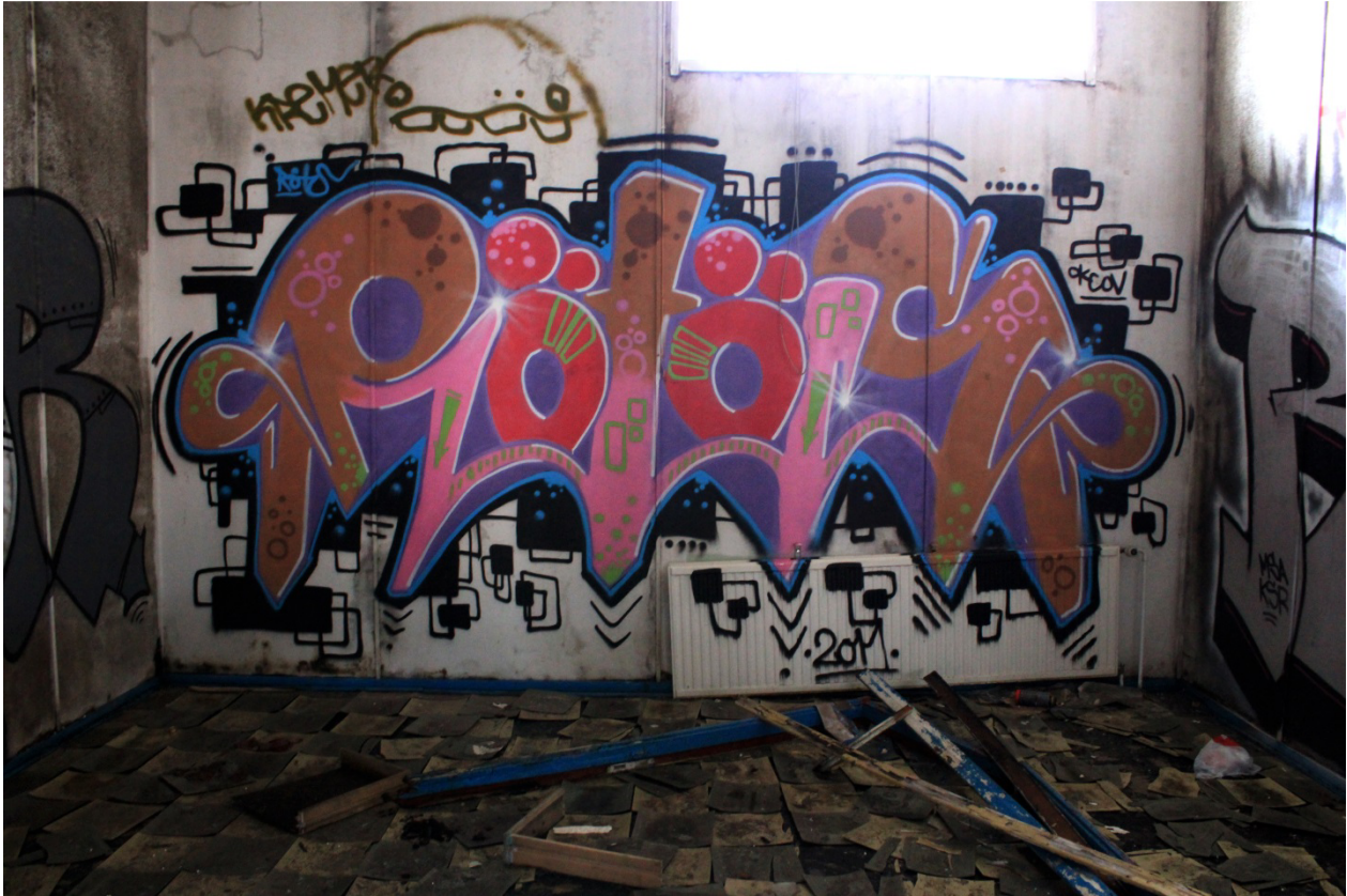
Kuva 40. Rötös, 2011. Maalaus sijaitsee tulitikkutehtaan toisessa kerroksessa.

Rötöksen kohdalla nimi tuntuu tuovan osaltansa symmetriaa sommitteluun kirjainten rytmillä. Hänen maalauksensa tuntuvatkin painottavan reunoissa sijaitsevia kirjaimia omina yksiköinä kolmen keskimmäisen tuntuessa yhtenäiseltä elementiltä, kuten myös tässä tulitikkutehtaan yläkerrasta löytyvässä monivärisen fillin omaavassa työssä (Kuva 40), jossa nimen reunimmaisien kirjaimien reunat ovat symmetriset. Blinkit tuntuvat korostavan kolmijakoista massoitteita. R-, T- ja S-kirjaimet sisältävät samanlaiset fillin väritykset jotka vaihtuvat nopeasti liukuen oranssista vaaleanpunaiseen. Nämä kolme kirjainta yhdistyvät toisiinsa vaaleanpunaisista osistaan luoden lokerot punaisille Ö-kirjaimille. Kirjaimet muuttuvat alapääteissään – ja S-kirjaimen tapauksessa rungossaan – teräviksi, samoin kuin edellä käsitellyssä Rötös -piississä. S- ja R-kirjaimien kannasta lähtevät kierteen kautta alaspäin syöksyvät nuolimotiivit. Fillin kuvioissakin näkyy liikettä alaspäin osoittavina nuolina. Vaikka filli tuntuukin sattumanvaraiselta yksittäisiä kirjaimia vertaillen, näkyy koko sanaa tarkastellessa säännönmukaisuutta sekä väreissä että kuvioissa.