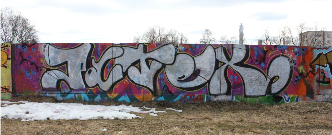
Kuva 44. Patex, 2013. Maalaus sijaitsi luvallisella graffitiseinällä.

Gottlieb'in systeemillä saan analyysin pohjalta sarjan A3B3C2D2E1F1G2H3I2J2K2L3L5M1. Se sopii korkeiden tyylien joukosta swedish train-tyylin määrittäviin piirteisiin. Myös suurin osa tyylin vallitsevista piirteistä sopii Patex -piissille analyysin pohjalta rakentamaani sarjaan. Gottlieb'in graffitiasiantuntijoiden mukaan tyyliin kuuluu tavallisesti maalauksen nopea toteuttaminen, ja se on luonteeltaan kuplamaista kirjainten saadessa liioiteltuja mittasuhteita. 221