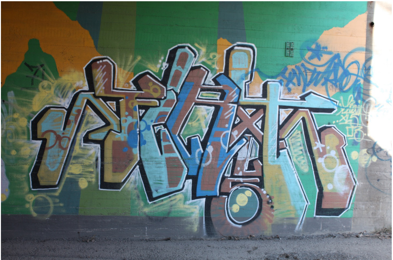
Kuva 36. Fiat, 2003. Maalaus sijaitsee moottoritien ja Puijonlaaksontien alittavissa tunneleissa.

erittäin aktiivinen, mikä riittää perustelevaan crew:n ja sen jäsenten keskeisyyttä kuopiolaisessa skenessä. Koin tarpeellisena poimia Fiatin mukaan juuri XL5 crew:n edustajana omanlaisensa, kirjaimilla leikittelevän tyylinsä vuoksi. Tekijä tuntuukin panostaneen tyylliseen ilmaisuun, ja kenties hänen käyttämässä signeerausmainen tagi (Kuva 36, näkyvissä piessin oikeassa yläreunassa) myös heijastelee graffitimaalarin näkemystä omasta tekemisestään.