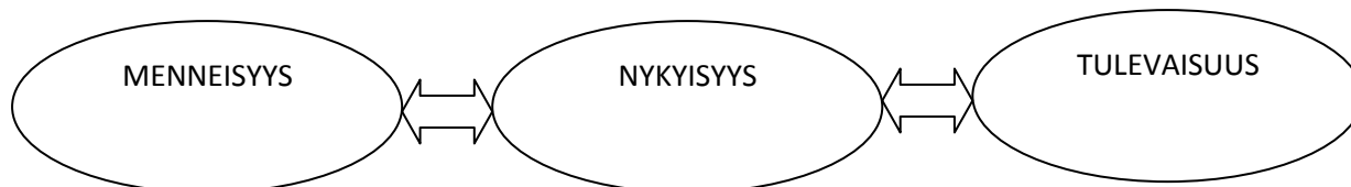
Kuvio 1. Analyysiprosessin tasot.