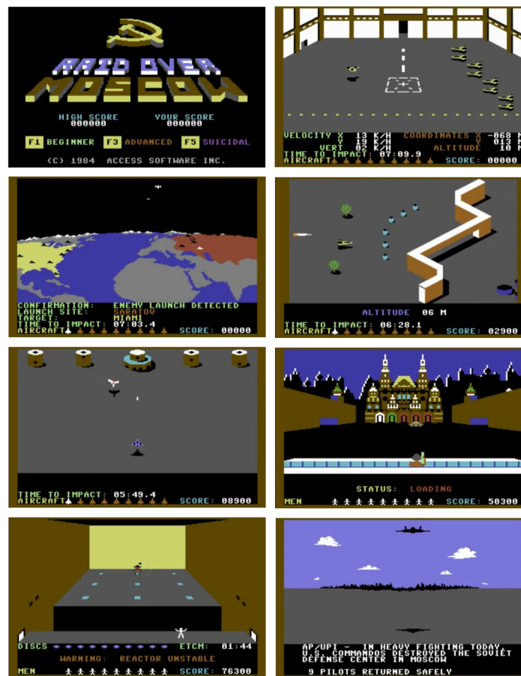
Kuva 1. Kuvakollaasi Raid over Moscow 'n kentistä

vain minuutteja aikaa tuhota robotti ja poistua reaktorihuoneesta ennen ytimen sulamista. Pelaajan päästessä viimeiseen kenttään on pelillä kaksi erilaista loppuvaihtoehtoa. Jos pelaaja ei ehdi tuhota viimeistä robottia, tulee hänen kommandoryhmästään sankarivainajia. Jos pelaaja onnistuu tuhoamaan viimei-senkin robotin ja pääsee pakenemaan, hänen kommandoryhmäänsä odottaa kotona sankariparaati. Molemmissa vaihtoehdoissa Kremlin on historiaa.