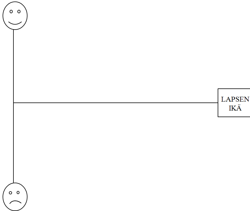
KUVIO 2. Aikajana.