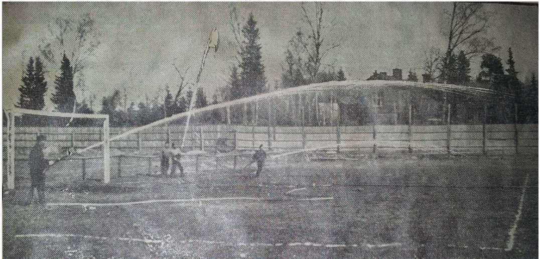
Kuva 5. Palokunta vauhditti kevään tuloa Pallokentällä ruiskuttamalla sille 90 000 litraa vettä toukokuussa 1930-luvun alussa. (Vaasa -lehti 13.5.1931)

Vuonna 1930 Pallokentän kapeudesta alkoi syntyä valituksia, ja syksyllä kenttää ryhdyttiinkin laajentamaan leveyssuunnassa. Pallokentällä pelattiin paljon otteluita, sillä sarjamuotoinen Suomen mestaruussarja alkoi. VPS:n toiminta alkoi tämän myötä muuttua riippuvaiseksi mestaruussarjan ottelutuloista. Vuonna 1932 Pallokentälle hankittiin vielä suurikokoinen kello ja tulostaulukko. (Vaasan Palloseuran toimintakertomukset 1929–1930 & 1931–1932.)