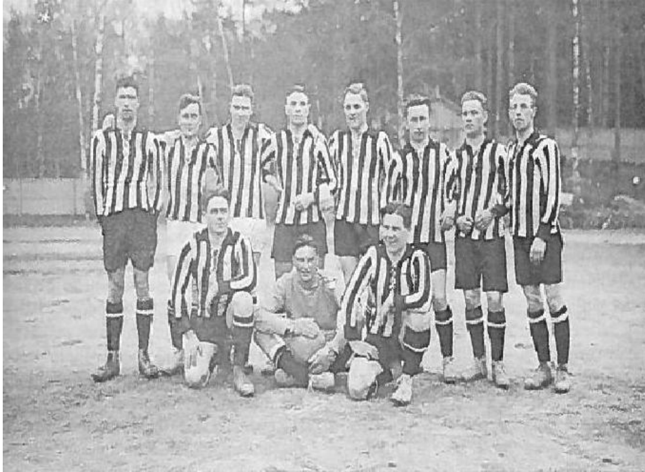
Kuva 2. Vaasan Palloseuran jalkapallojoukkue Hietalahden vanhalla kentällä vuonna 1926. (Vaasan Palloseura 1924–1999, 27.)