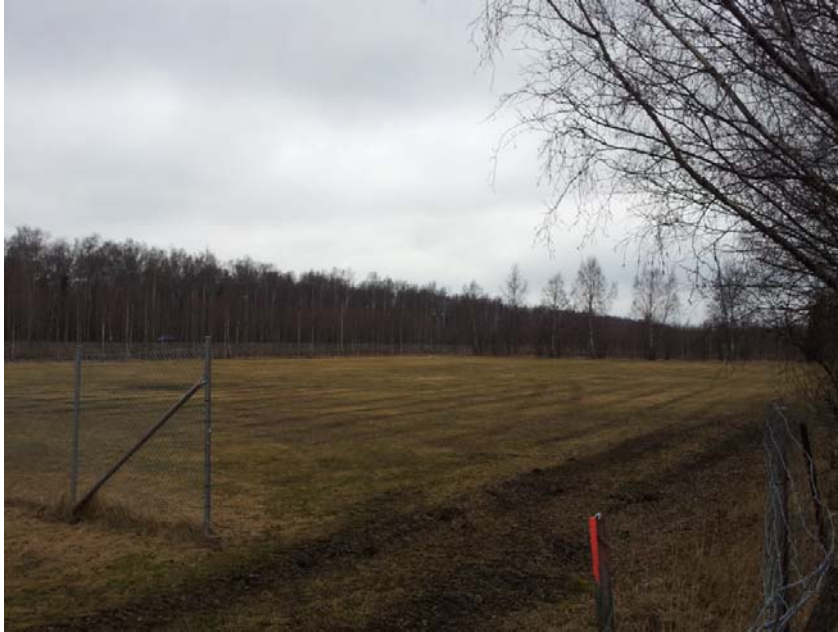
Kuva 9. Kotirannan kenttä on edelleen samalla paikalla, jolle se rakennettiin 1950-luvulla.

Kun seuran oma kenttä oli saatu valmiiksi, oli se seuran käytössä aina koko pelikauden ajan alkukevään nurmetonta aikaa lukuun ottamatta. Kentän varustelun parantamista jatkettiin tulevinakin vuosina. Vuonna 1955 pukusuojaan saatiin kuumavedenvaraaja suihkua varten ja Vaasan Palloseuralle myönnettiin veikkausvoittovaroja kenttää ympäröivän aidan rakentamiseksi. (Vaasan Palloseuran toimintakertomus 1955.) Aita rakennettiin seuraavana vuonna. Kenttä oli toimintakertomusten mukaan osoittautunut erittäin tarkoituksenmukaiseksi, etenkin kun otettiin huomioon Vaasassa vallitseva heikko kenttätilanne. Oma kenttä paransi erityisesti juniorijoukkueiden tilannetta. Harjoitusten lisäksi VPS pelasi kentällä osan kotiotteluistaan, ja järjesti junioreille tekniikkakilpailuja. (Vaasan Palloseuran toimintakertomus 1956.)