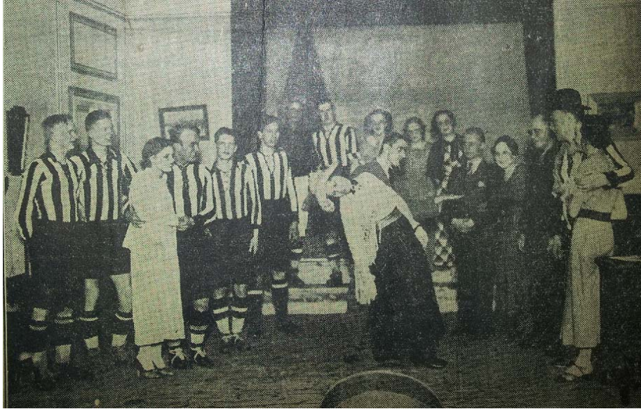
Kuva 8. Jalkapallokuningas -näytelmän esitys ruotsalaisen seurakunnan talossa Kirjastokadulla vuonna 1936. (Ilkka -lehti 16.5.1936.)