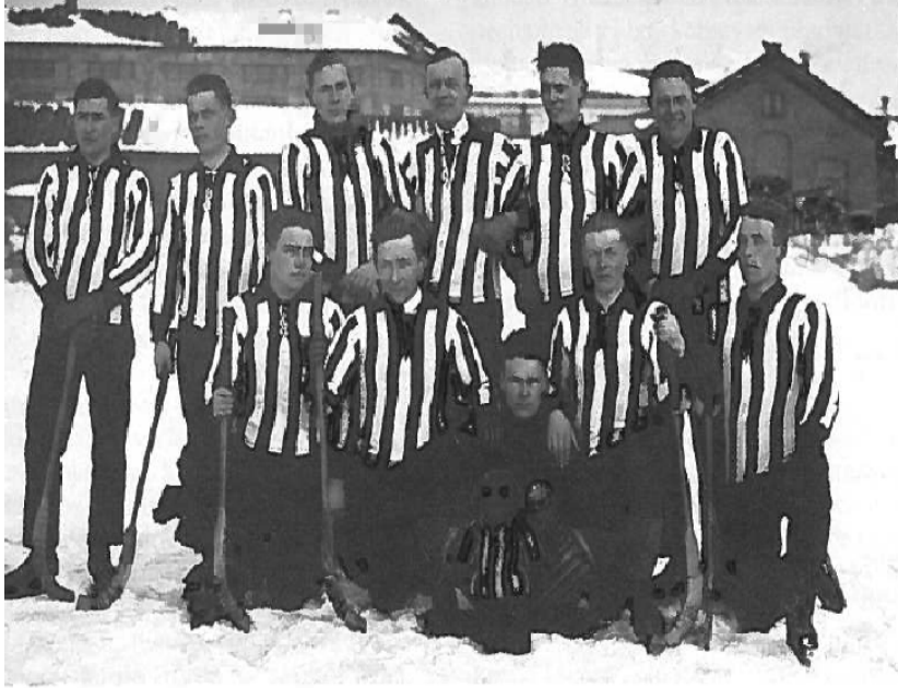
Kuva1. Vaasan Palloseuran vuoden 1925 jääpalljoukkue Onkilahden jäällä Wärtsilän edustalla. (Vaasan Palloseura 1924–1999, 23.)