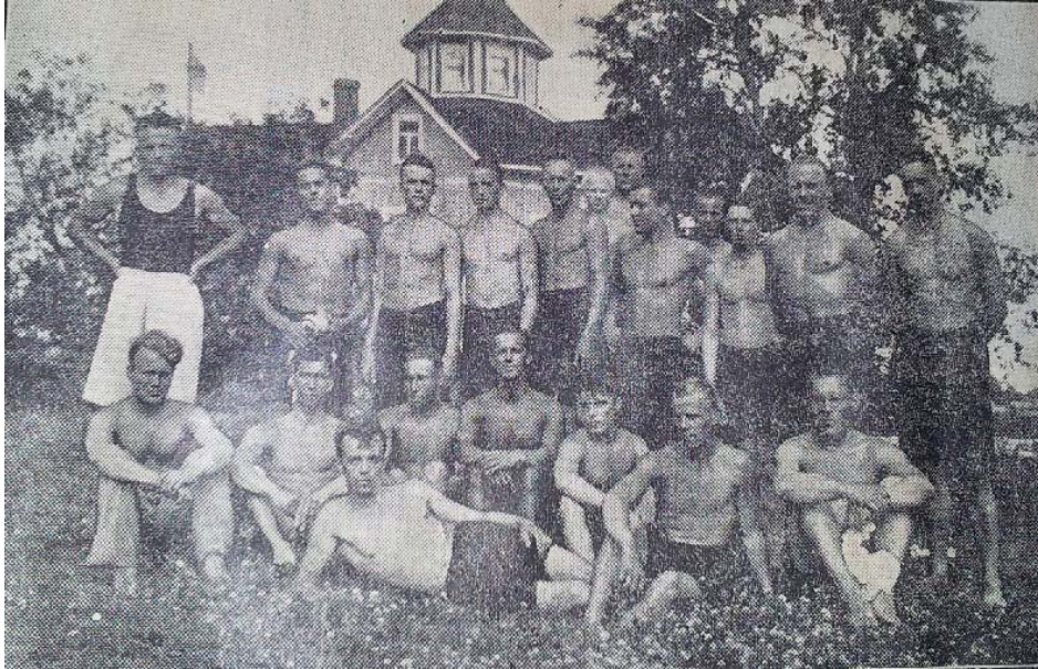
Kuva 3. VPS järjesti Suomen ensimmäisen jalkapalloseuran Karperö -järvellä. Taustalla Nuorisoseuran talo, joka toimi leirin keskuksena. (Vaasa-lehti 3.8.1932.)