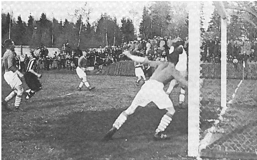
Kuva 4. Pelitilannekuva Pallokentältä vuodelta 1938 (Vaasan Palloseura 1924–1999, 15.)

Pallokentän leveys oli 60 metriä ja pituus 100 metriä. Istumapaikkoja oli 400 hengelle, ja kenttärakennuksen pukusuojassa oli pelaajille suihkut sekä hierontahuone. Kentän kokonaiskustannusarvio oli 200 000 markkaa. Historiikin kirjoittajan mukaan uuttera talkootyö ja seuran saamat lahjoitukset tekivät kentän syntymisen mahdolliseksi. (Vesanto 1999, 23.)