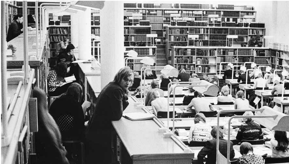
Aallon lukusali vuonna 1974.

1970-luvun alkupuolella JYK:ssa ei tehty itse atk-pohjaisia tiedonhakuja, vaan pyynnöt valmisteltiin profiileiksi jotka lähetettiin Helsinkiin tai Tukholmaan. Tällaisten atk-pohjaisten