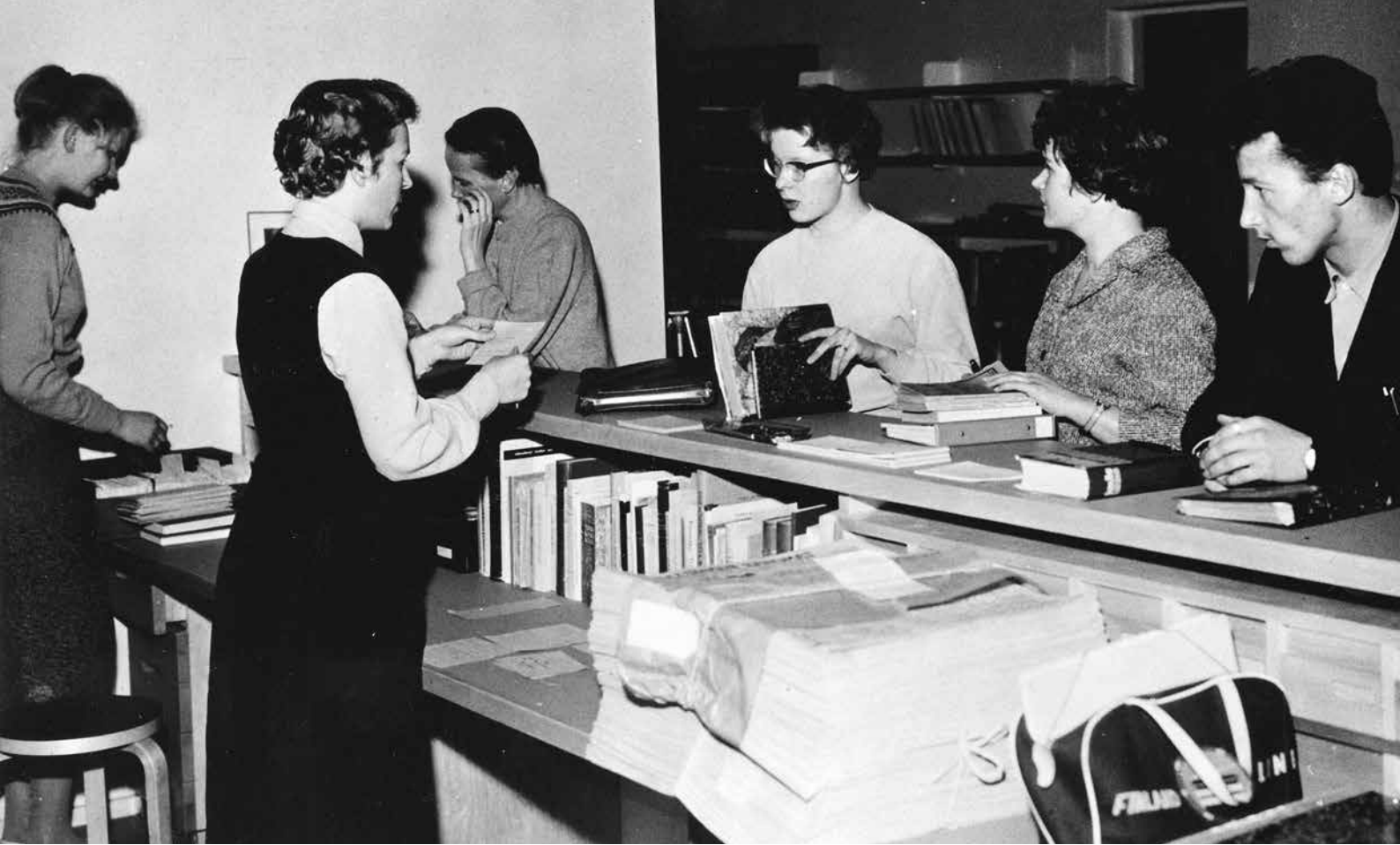
Kasvatusopillisen korkeakoulun kirjaston lainaustiski. Kuva vuodelta 1959.

lytilaisuudet uusille opiskelijoille ja opettajille sekä seminaariryhmille yhteistyössä muun kirjastohenkilökunnan kanssa, kirjaston kokoelmia esittelevien monisteiden laatiminen, Kirjaston uutisia -lehden toimittaminen ja aikakauslehtikierto. Lisäksi hän teki toimeksiantoista manuaalisia tiedonhakuja.