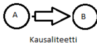
Kuva 2: Kausaliteetti.

kokemuksen. ”Pallo A” vaikuttaa ”palloon B” ja saa ”pallon B liikkeelle”, se että havaintokokemus tulee mielekkääksi ja ymmärrettäväksi kokemukseksi perustuu ymmärryksen a priori kategorioiden toimintaan. Ymmärrys tuottaa kausaliteetin kategorian mahdollistamana jäsentäen mielekkääksi pallon A osumisen pallon B. Kausaliteetin käsite järkeistää aistihavainnot ja tuottaa mielekkään aistikokemuksen. Kausaliteetin kategoria yhdistää kaksi havaintoa tehden tapahtumasta ymmärrettävän. A osuu B:hen, ja se että A osuu B:hen aiheuttaa B:n liikkeen. A on syynä B:n liikkeelle.