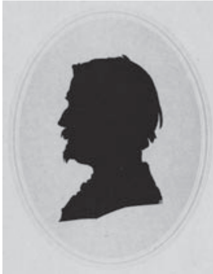
Carl Gustaf Estlander (1834–1910).

Valtiopäivillä Koskinen toimi vuosina 1872, 1877–1878 ja 1882 pappissäädyssä ollen 1870-luvun lopulta alkaen säätyjensä johtava hahmo. Vuoden 1882 aateloinnin jälkeen hän osallistui valtiopäiville aatelissäädyssä, jossa