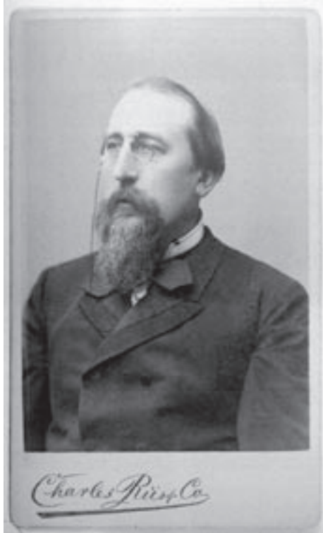
Leo Mechelin (1839–1914) oli paitsi perustuslaillisen rintaman näkyvimpiä hahmoja, myös merkittävä kulttuuripoliitikko.

Asian eteneminen viivästyi, kun liberaalit ja fennomaanit eivät päässeet yhteisymmärrykseen. Yrjö-Koskisen ja fennomaanien edustama näkemys