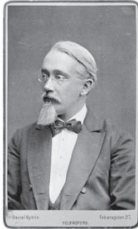
Yrjö Sakari Yrjö-Koskinen (1830–1903).

Yleisen historian professoriksi Koskinen nimettiin 1863 ja vuonna 1876 oppituoli vaihtui Suomen historian puolelle. Tutkimuksissaan Koskinen haki Suomen kansalle historiaa. Oppikirja Suomen kansan historiassa realisoi tätä tavoitetta – ja C. G. Estlander leimasi sen puoluehengen synnyttämäksi ja epätieteelliseksi.