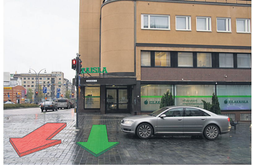
Päin punaista ei saa kävellä, koska saisi sakot, mutta kun kävelee suojatien vierestä voi tien ylittää huoletta punaisesta valosta huolimatta.