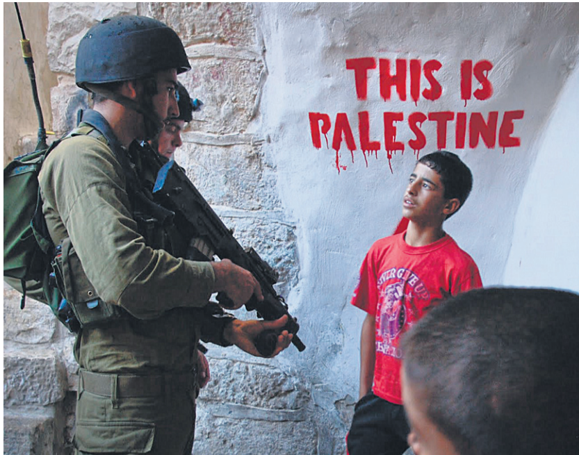
Palestiinalainen poika ja Israelin sotilas Hebronissa.