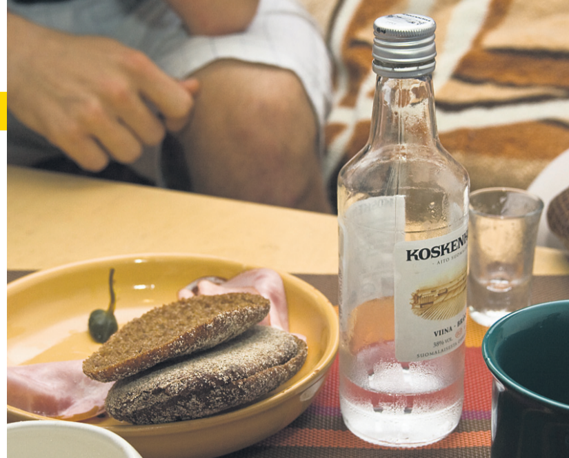
Venäjäällä, mutta suomalaista leipää ja viinaa.

Azadeh Okhovatille tärkeitä perinteitä ovat muun muassa käsin tehdyt pöytälinat ja keramiikka.