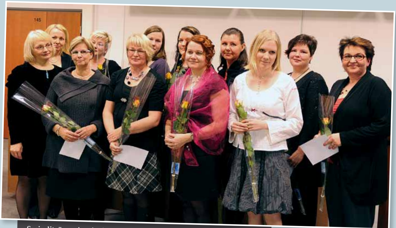
Sosiaalityön maisteriopinnoista valmistui ennätysmäärä uusia maistereita. Heistä osa ehti osallistua maisterien valmistujaisjuhlaan syksyllä.