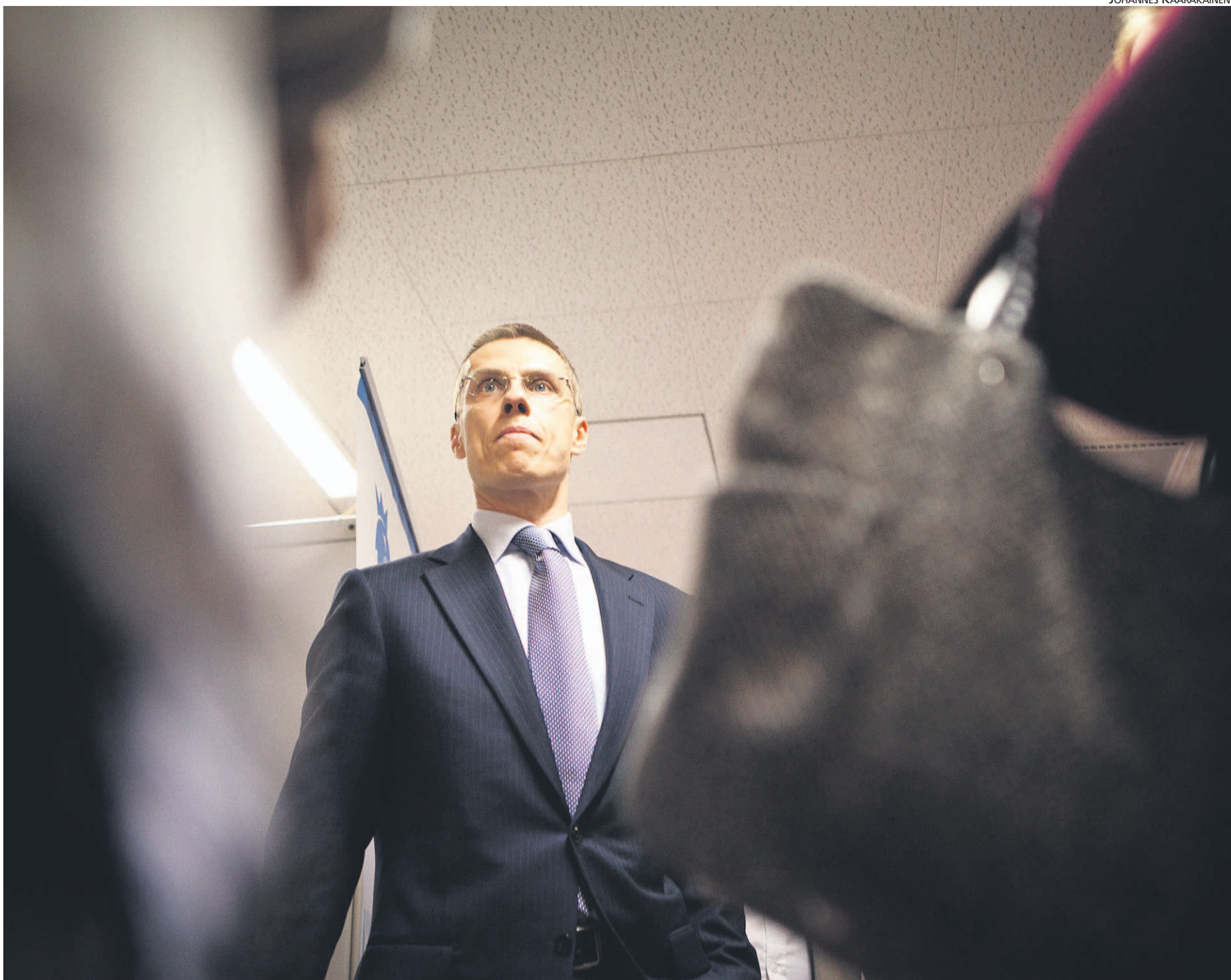
Alexander Stubb antoi opiskelijoille katsauksen "ulkopoliittiseen skeneen".