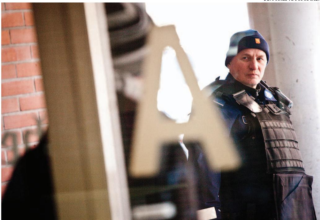
Perjantaina puoliltpäivän Mattilanniemen A-rakennuksen WC-tiloista opiskelija ilmoitti kuulleen aseensa latausäänen. Poliisi eristi rakennuksen noin kymmenen poliisipartion voimin. Tyhjennetyt rakennukset tutkittiin, mutta asetta tai muuta konkreettiseen uhkaan liittyvää ei löydetty.