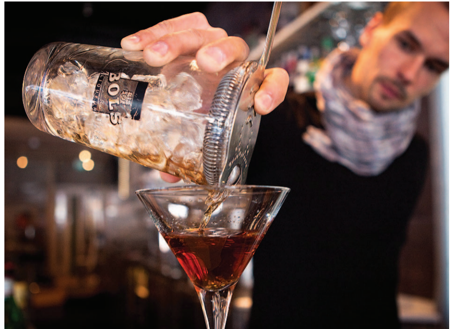
Kirkkaat juomat valmistetaan perinteisesti sekoittamalla. Jäät jäädyttävät ja jatkavat juomaa. Ravistaminen tekisi Manhattanista samean.

”Baarimestarien ammattitaito on noussut niin, että kiinnostus cocktailien historiaankin on herännyt. Toinen tekijä on, että vihdoinkin Suomestakin on saatavilla kunnollisia alkoholeja”, Suomela sanoo.