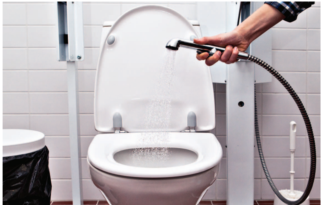
You can also use alapesusuihku to clean up the mess in toilet.

The alapesusuihku is a handy innovation that you will find in practically every Finnish WC. Also known as käsisuihku and in less refined circles, pillupuhelin, this bit of plumbing functions like a handheld bidet and is intended to give