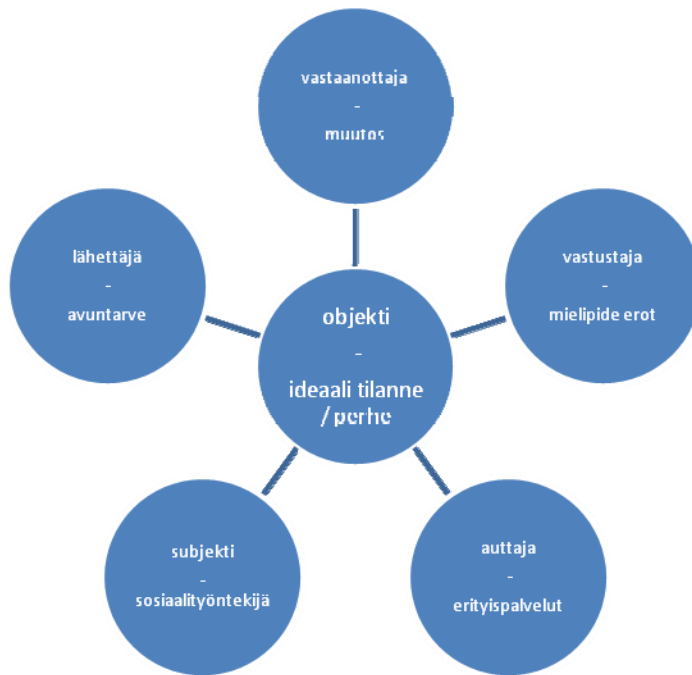
KUVIO 3. Aktanttimalli perheen ollessa lastensuojelun asiakkaana.