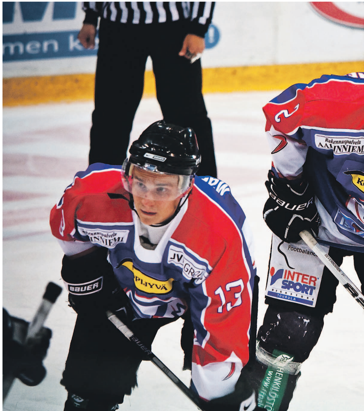
D Team -jääkiekkjoukkueen pelaajat ovat saaneet ohjausta yliopisto-opintoihinsa nyt kahden vuoden ajan.

Esimerkiksi Lius nostaa tilanteen, jossa D Teamilla oli vierasottelu peräti kuutena peräkkäisenä keskiviikkona. Samaan aikaan alkoi uusi kurs-