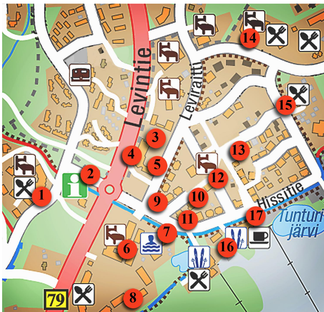
СХЕМА 1 Места использования русского языка в центре Леви 1

В плане 1 мы очертили нумерованными красными кругами, в каких местах в центре Леви можно встретить русский язык. Мы думаем, что таких мест мало, так как в Леви работают десятки, даже сотни предприятий (см. раздел 3.2), но в нашей схеме русский язык использован только в 17 местах. Важно помнить, что информация, собранная в схеме дает только общую характеристику распространения мест, где русский язык используется, потому что сбор информации основывался на беседе с туристами, опросах и наших наблюдениях, и он не являлся систематическим. Таблица 2 показывает места, где русский язык использован либо в устной, либо в письменной форме.