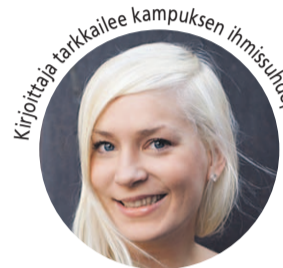
Kirjoittaja tarkkailee kampuksen ihmishuippuikkaita.