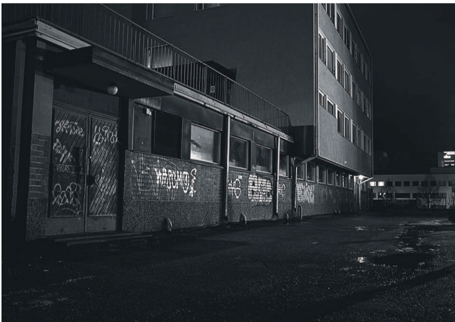
Aren aukiolta lähtee synkkä reitti kohti Matkakeskusta.