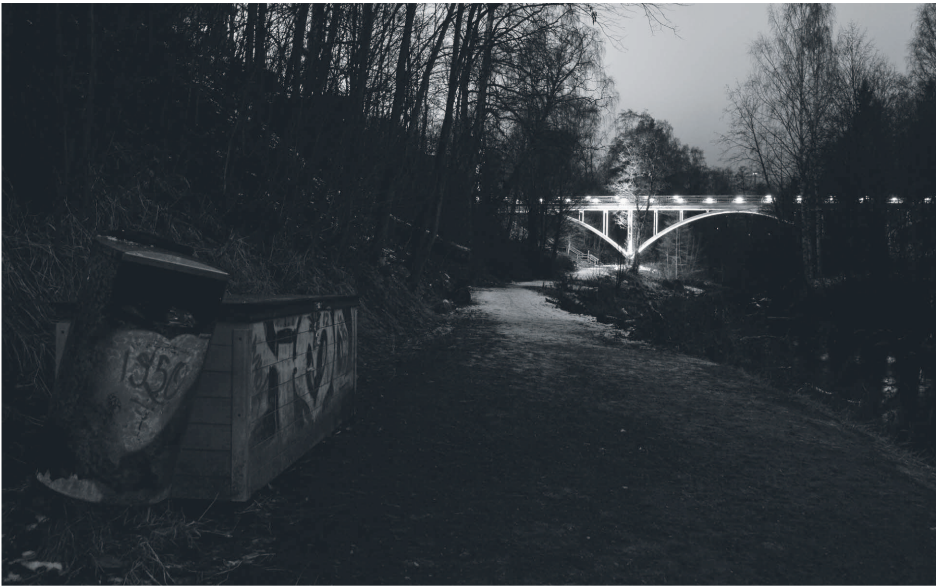
Tourujoen ylittävä silta on kauniisti valaistu, mutta rantaraittia pitää tarpoa täydessä pimeydessä.