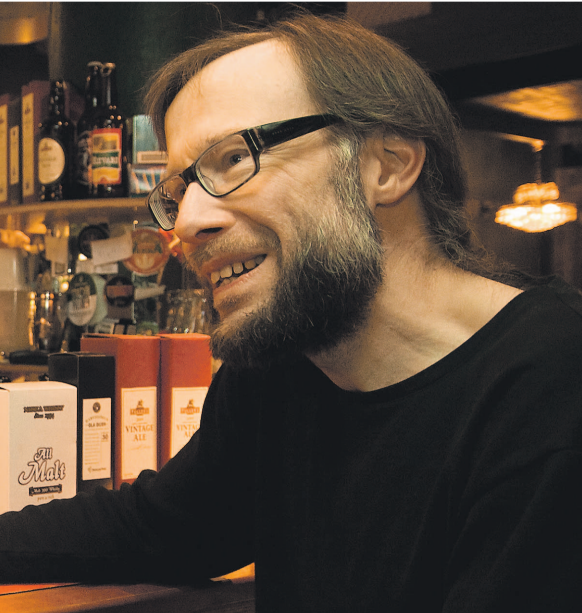
ffeemaista Caledonian 80 Shilling -alea Skotlannista.