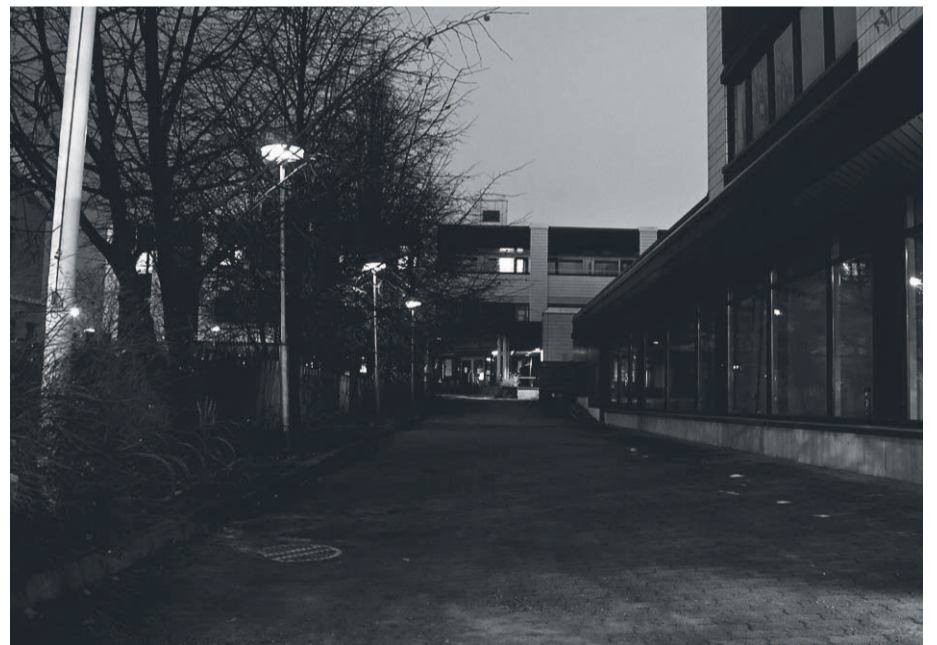
Hannikaisen-, Väinön- ja Vapaudenkatujen välinen virastokortteli ei houkuttele asioimaan.