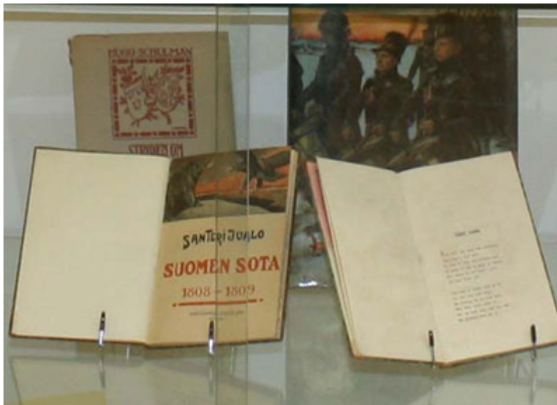
2009.

Suomen sota ja Suomeksi mielletyn maantieteellisen alueen siirtyminen Venäjän keisarin alaisuuteen kiinnostivat tutkijoita 1800-luvun puolivälissä. Vuosisadan lopulla ja 1900-luvun alussa tutkimus ammensi motivaationsa suomalaisen kansakunnan olemassaolon oikeutuksen puolustuksesta. Tässä taistelussa suomalaiset historiantutkijat, oikeusoppineet ja yhteiskunnalliset vaikuttajat vetosivat Aleksanteri I:n Porvoon valtiopäivillä ilmaisemaan lupaukseen säilyttää maan lait ja säädökset sellaisena kuin ne olivat Ruotsin vallan aikana. Ongelmana oli, että venäläisillä ja suomalaisilla oli erilainen käsitys siitä, mihin lakiin silloin vedottiin.