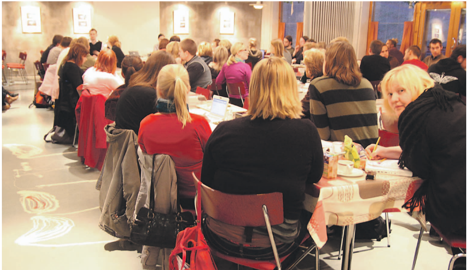
Liki kuusituntiseksi venähtänyt edustajiston kokous tiistaina 13. lokakuuta koetteli edaattorien turnauskestävyyttä.

”Think big – Vote green. Vote for: 1. Free education for all: No tuition fees for Finnish students. No tuition fees for foreign students. 2.Green campus: Carbon neutral and wasteless university, energy efficiency and proper recycling. 3.Democracy on Campus: Students have a strong part in decision making when it comes to their own education, university and campus. 4.Legal protection of student rights. We need to know our rights and act on violations. Green manifesto – Election themes for student union election in 2009: 1.Free and high-quality education, 2.Happiness and social welfare, 3.Jyväskylä – student city, 4.Green campus, 5.Free time is a basic right, 6.Academical community is a part of the society. Get familiar with the green manifesto and get to know our candidates: www.jyvioni.org.”