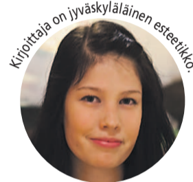
Kirjoittaja on jyväskyläläinen esteetikko.