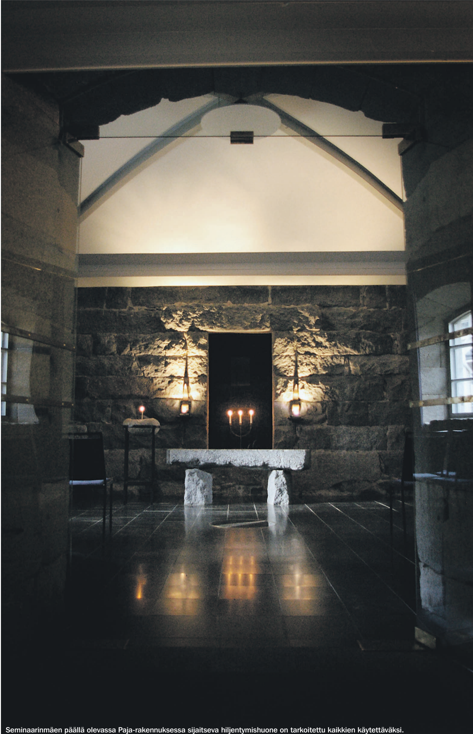
Seminaarinmäen päällä olevassa Paja-rakennuksessa sijaitseva hiljentymishuone on tarkoitettu kaikkien käytettäväksi.