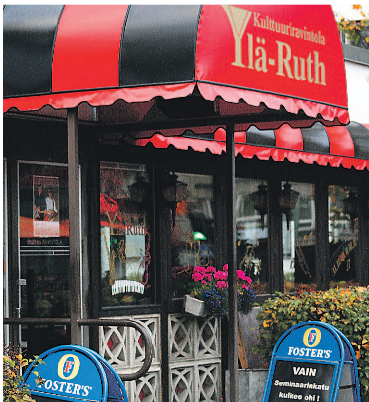
Ylä-Ruthin oven yläpuolella lukee vielä ”kulttuuriravintola”, vaikka tai-teilijat pysyvät sieltä yhä useammin poissa.