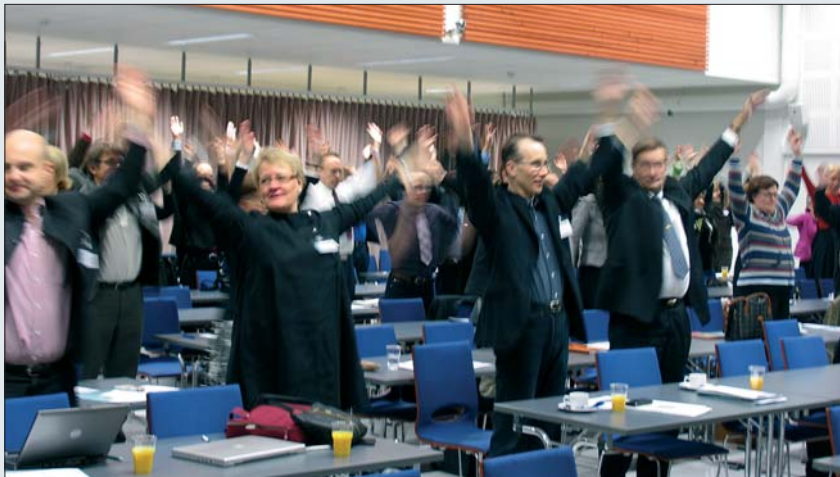
Seminaaripäivä käynnistyi aamujumpalla.