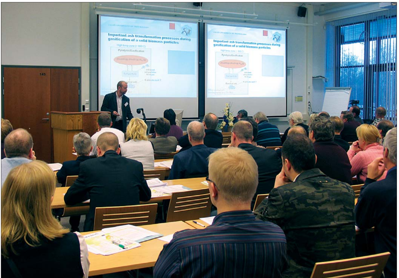
Kansainvälinen High Bio –seminaari marraskuussa veti yliopistokeskuksen Ulappa-salin täyteen kuulijoita.