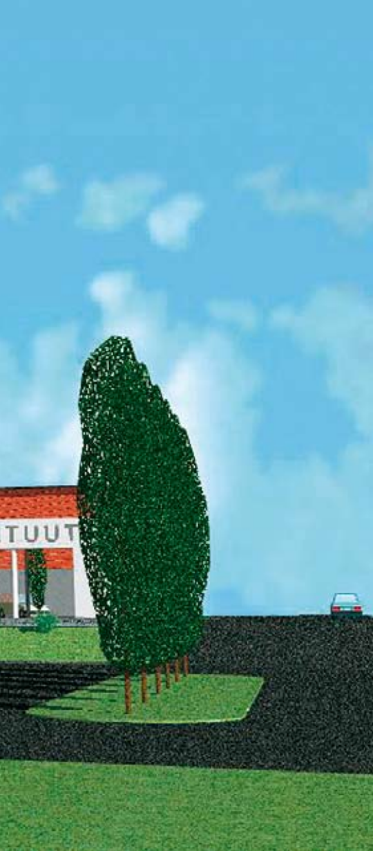
PIIRROS ARKKITEHTITOIMISTO JORMA PALORANTA