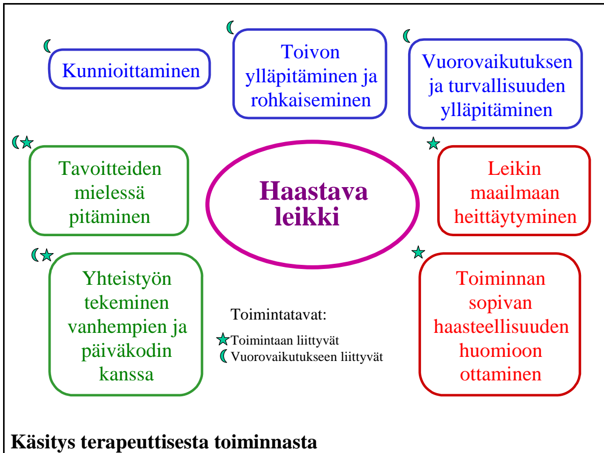
Kuvio 3. Haastavaa leikkiä kuvaavat toimintaterapeutin toimintatavat ja niistä muodostunut käsitys terapeutisesta toiminnasta. (Sario 2004)