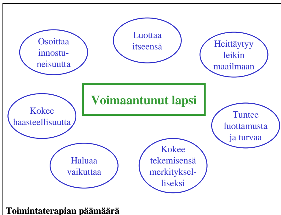
Kuvio 4. Toimintaterapian päämäärää kuvaavan voimaantuneen lapsen ominaisuuksia. (Sario 2004)

Toimintaterapian päämäärää kuvaava voimaantunut lapsi – yhdistävä kategoria hahmottui vähitellen analyysiprosessin edetessä. Aineistosta (yht. 35 s.) nousee runsaasti kuvauksia itseensä luottavasta, leikkiin innostuvasta terapialapsesta. Sitä ilmentäviksi yläkategorioiksi muodostui ”kokee haasteellisuutta”, ”haluaa vaikuttaa”, ”tuntee luottamusta ja turvaa”, ”heittäytyy leikin maailmaan”, ”kokee tekemisensä merkitykselliseksi”, ”luottaa itseensä” ja ”osoittaa innostuneisuutta” Ks. kuvio 4.