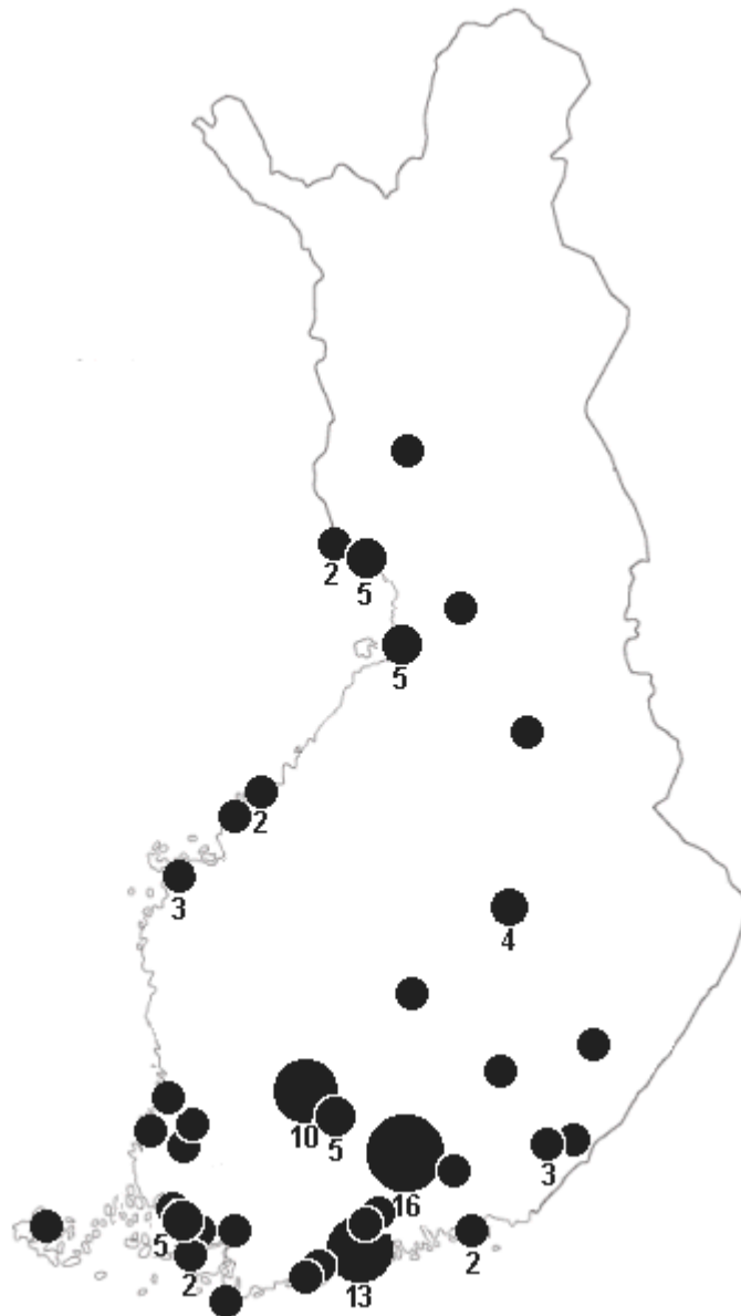
KUVA 4. Vuosien 1965, 1985 ja 2005 maajoukkuepelaajien kasvattajapaikkakunnat.

laajempaa tutkimusta, mutta jo lyhyellä vertailulla alueet vastaavat niin hyvin toisiaan, että pesäpallon suosion voi katsoa vaikuttavan.