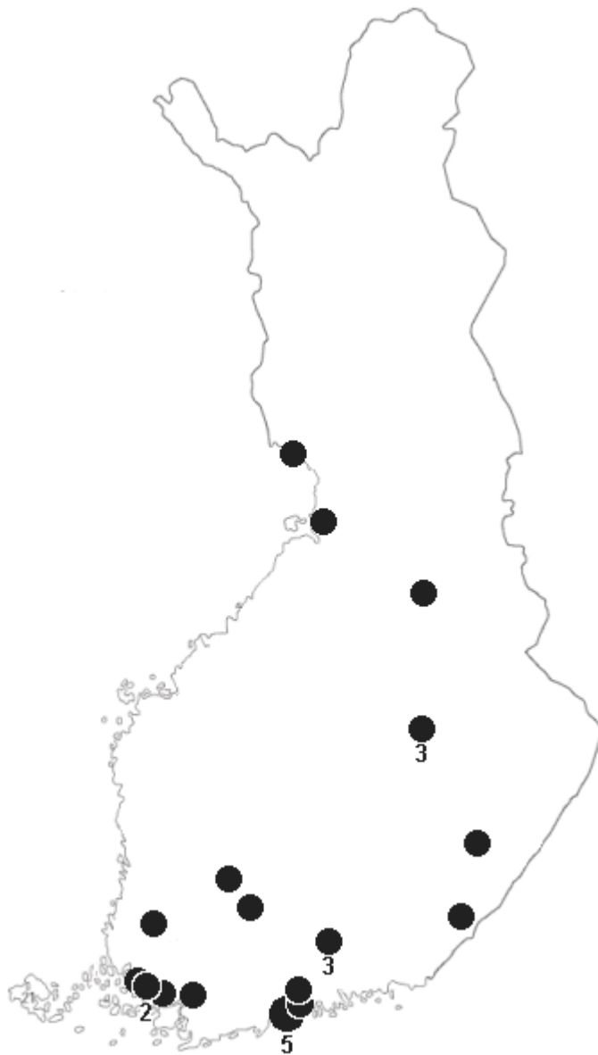
KUVA 2. Vuoden 1985 maajoukkuepelaajien kasvattajapaikkakunnat.

Kasvattajakaupunkitaulukon kärkipäätä vuoden 1985 osalta hallitsevat selkeästi suurehkot kaupungit. Helsingistä, Turusta, Kuopiosta ja Lahdesta tuli jopa yli puolet tarkasteluvuoden maajoukkuepelaajista (taulukko 3). Näissä kaupungeissa oli myös viisi pääsarjatasoa seuraa, joissa pelasi maaotteluhetkellä yhtä monta maajoukkuepelaajaa kuin alueet olivat kasvattaneetkin. Tämä voidaankin katsoa merkittäväksi asiaksi tiettyjen kaupunkien jalkapallokulttuurin ja sen kehittymisen kannalta. Kun kaupunki tuottaa huippupelaajia aina maajoukkueetasolle asti, ja saa vielä pidettyä heidät