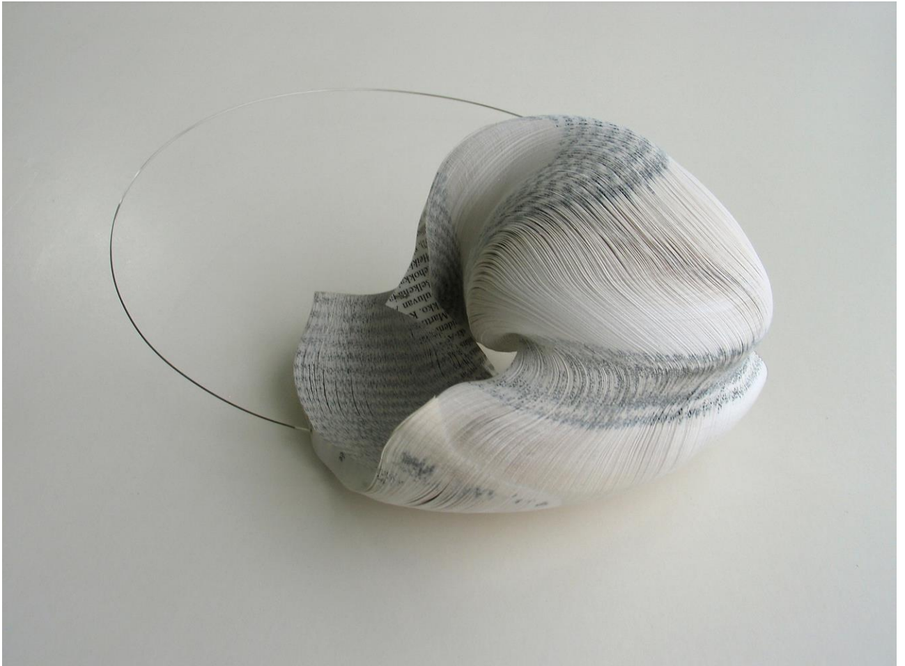
Kuva 11: Janna Syvänoja; kaulakoru, 2011. Materiaali: kierrätetty paperi, teräs. Koko: 14 x 10 x 9cm.