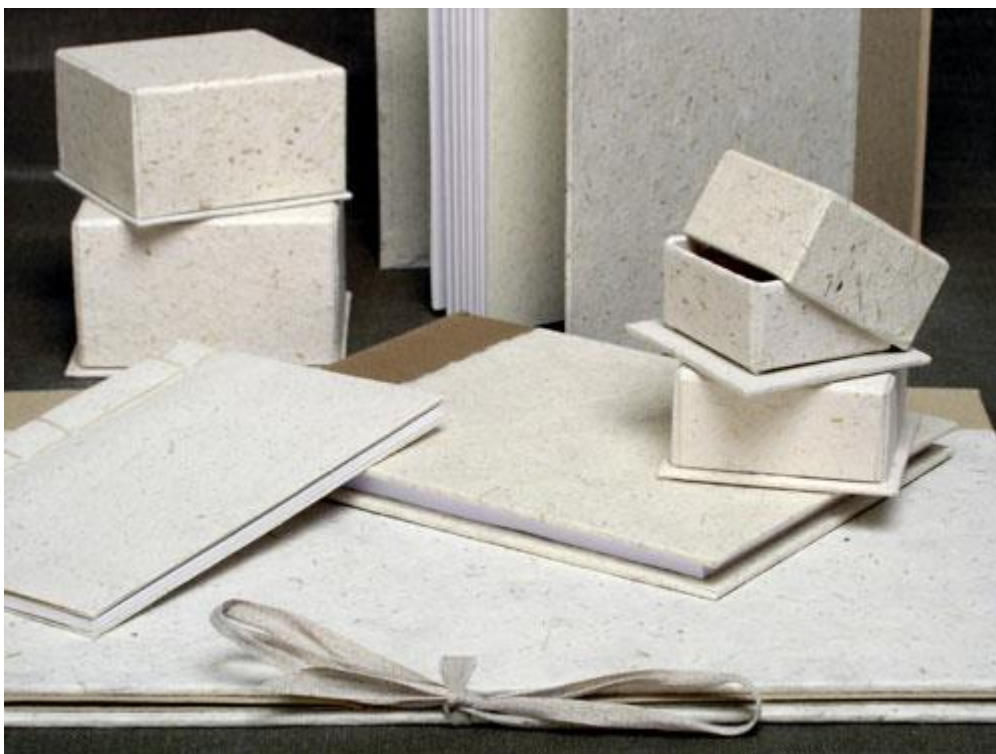
Kuva 6: Erja Huovila; käsintehtyillä paperilla päällystettyjä rasioita ja kansioita, 2009.