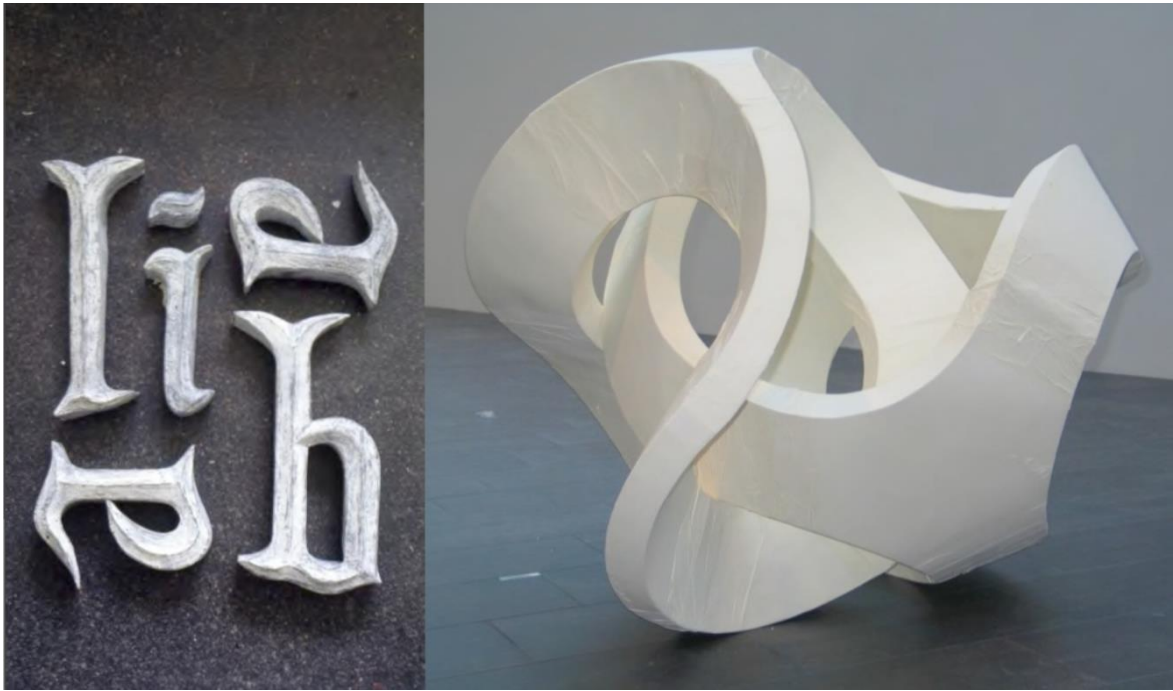
Kuva 9: Kai Rentola; Liebe (vasen). Materiaali: taivutettu akvarellipaperi, mehiläisvaha, pigmentit. Koko: kokonaisuus n. 50 x 60m. Fusion (oikea). Materiaali: taivutettu raakaselluarkki, pintaliima, kellertävä raamattupaperi. Koko: 250 x250 cm.