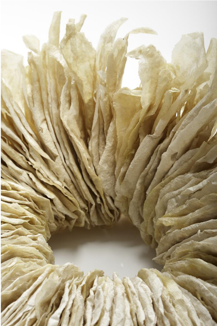
Kuva 13: Annaliisa Troberg; yksityiskohta teoksesta, 2009.