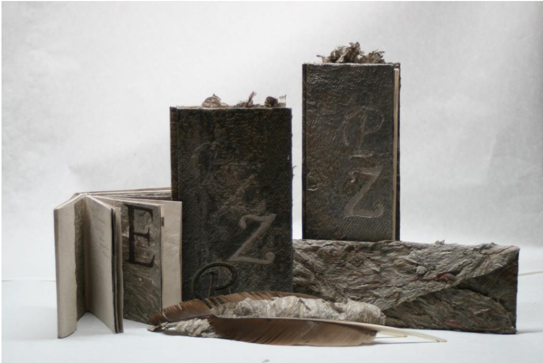
Kuva 1: Aulis Harmaala; Sanakirjoja ampiaisten kieleen ja kirjekuoria ampiaisten paperista, 2006.

sulkia. Paperimateriaalit ovat taiteilijan itsensä tai ampiaisten valmistamia. Kirjeen muoto toistuu teoksissa, ja ampiaisenpesä materiaalina kuvaa ampiaisten kirjoitusta.