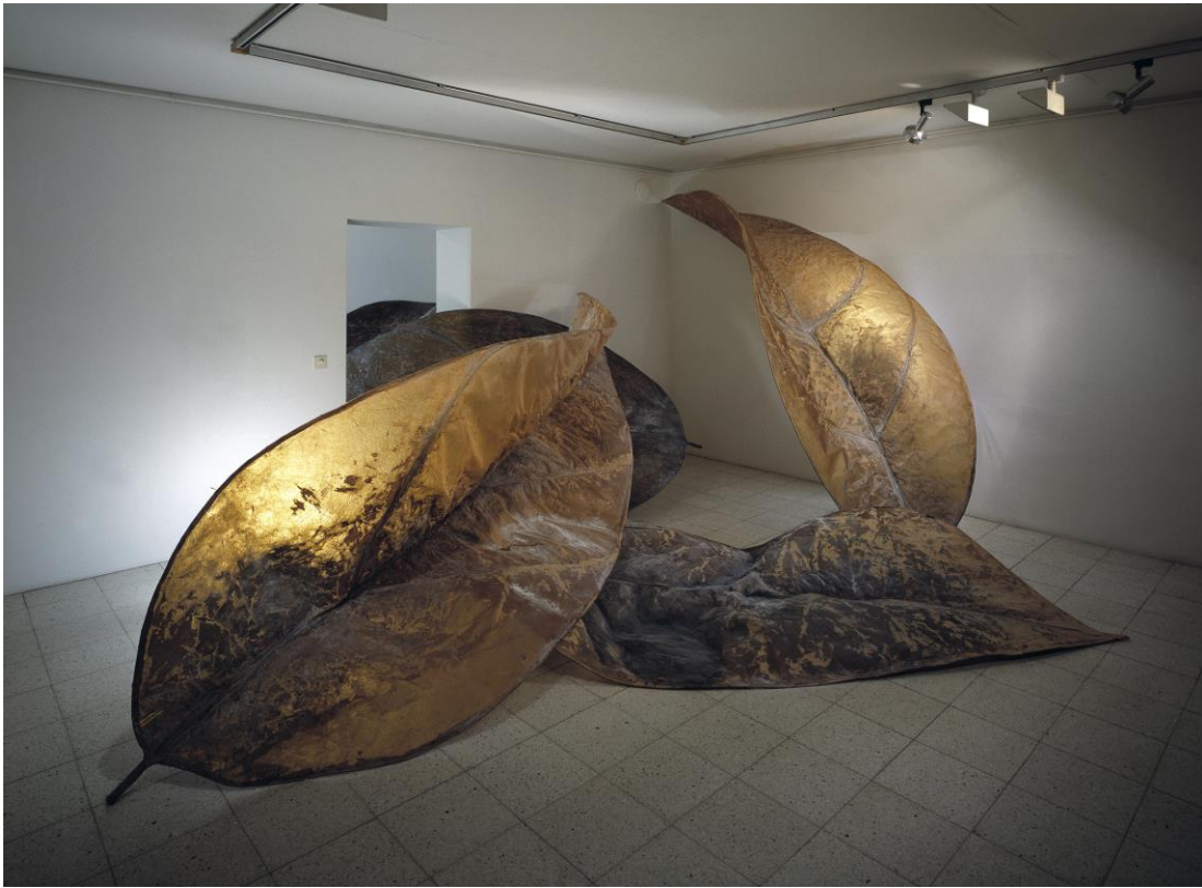
Kuva 7: Kaarina Kaikkonen; Ja tuuli käy sinun ylitsesi, 1992. Materiaali: voimapaperi, lasikuitu.