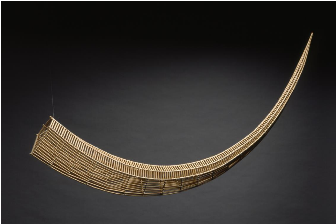
Kuva 15: Merja Winqvist; Sarvi. Materiaali: paperi. Koko: 220 cm.