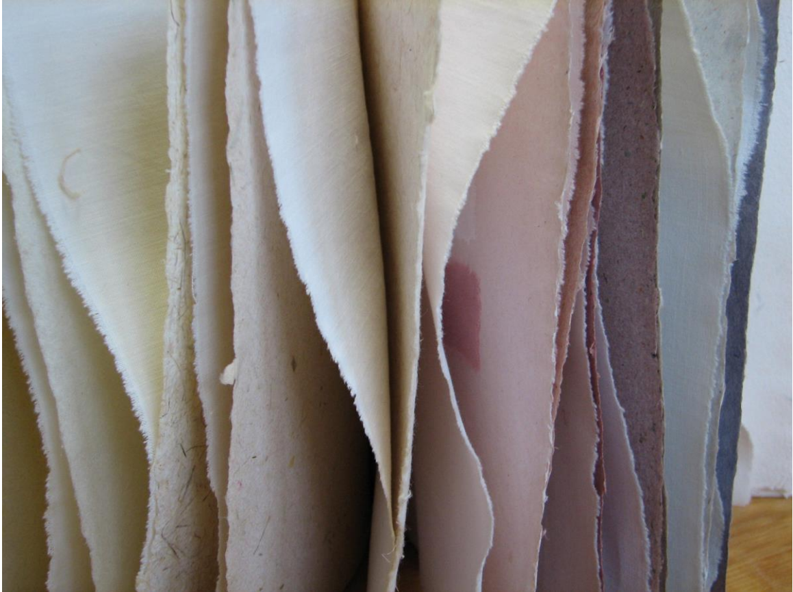
Kuva 5: Erja Huovila; käsintehtyä paperia, 2009.

intentioita. Huovilan valmiit teokset ovat käyttöesineitä, kirjoja, rasioita ja paperiarkkeja. Teokset ovat uniikkeja, jokaisen esineen kohdalla materiaalit on valittu huolella ja valmistettu itse alusta alkaen. Käsityötaituruus on tässä viety huippuunsa. Kuvassa 5 on yksityiskohta käsintehtyistä paperiarkeista. Kuvassa 6 on käsintehtyistä papereista valmistettuja kansioita, rasioita ja kirja.