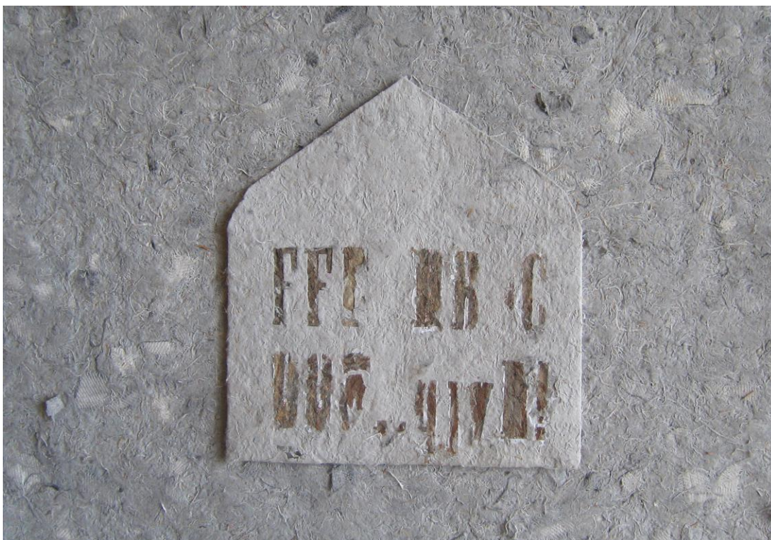
Kuva 2: Aulis Harmaala; Raoul Hausmanin julisteruno ampieisten paperilla, 2006. Materiaali: ampieisenpesää pigmenttivärjätyle luppupaperille.