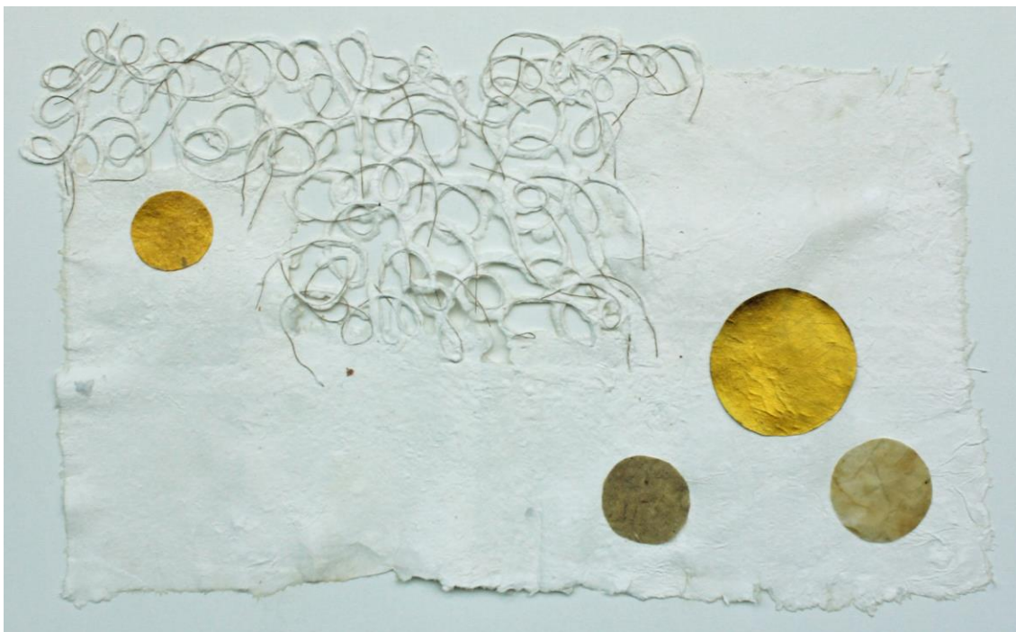
Kuva 4: Leenakaisu Hattunen; Anima, 2011. Materiaali: käsintehty paperi, kultaus, kollaasi.