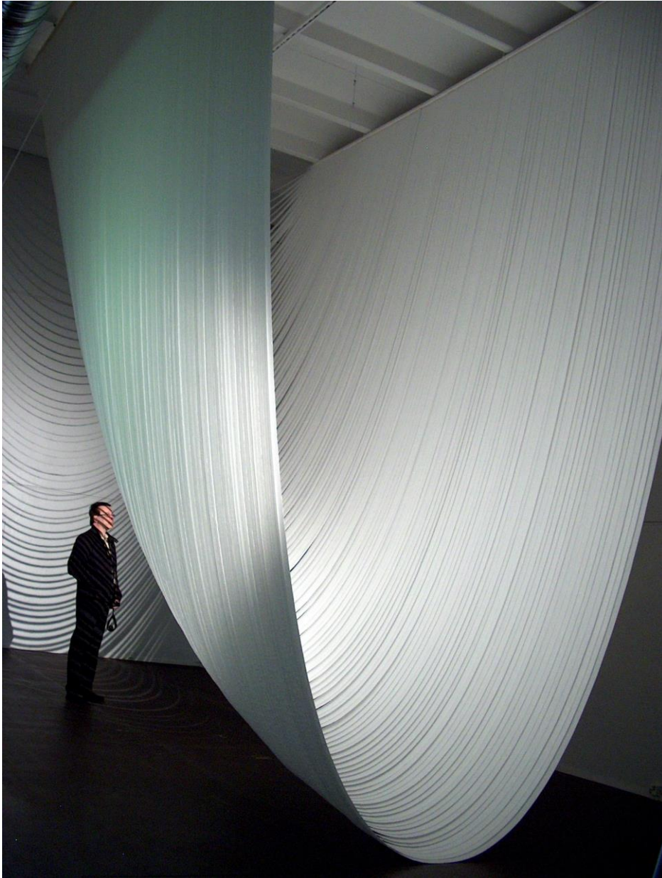
Kuva 8: Kaarina Kaikkonen. Ääriiviivani, 2005. Materiaali: wc-paperi.