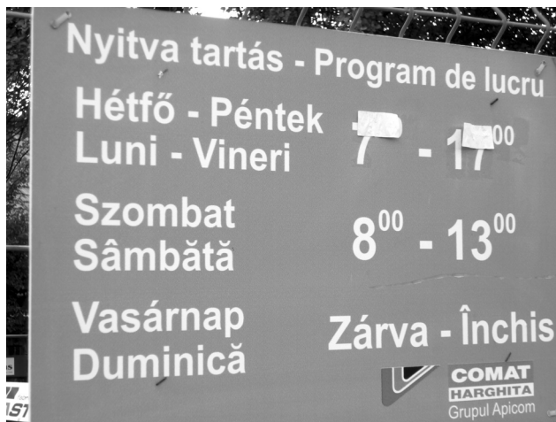
3. fénykép: Kereskedelmi tábla

A román Strada van ugyan felül és balra, illetve a számot a román Nr. rövidítés jelzi, de maga az utcanév csak magyarul olvasható. Ilyen utcanévtáblákkal a hat falu közül csak Csíkszentdomokoson találkozhatunk. A kétnyelvű kereskedelmi feliratok között sem ritka, hogy a magyar nyelv van elől: