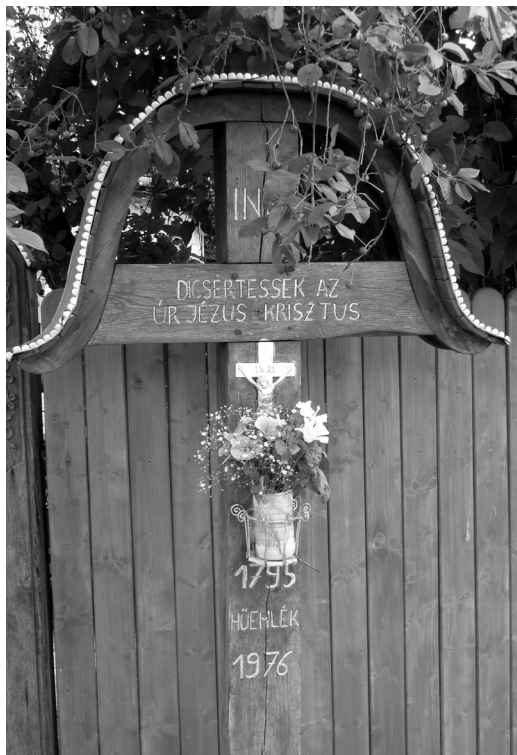
7. fénykép. Egynyelvű magyar felirat kereszten

Mivel Székelyföldön többek között a vallás különbözteti meg a magyarokat és a románokat, az inkább információs – és kevésbé szimbolikus – jelentéssel bíró feliratok (férfi-női WC. stb.) is csak magyarul található meg. Szlovákiában ezzel szemben az ilyen „funkcionális” feliratok a magyar katolikus közösségek esetében is csak szlovákul szerepelnek (de a szimbolikus jelentésűek többnyire csak magyarul).