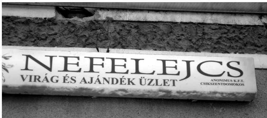
8. fénykép. Neonfényes tábla egynyelvű magyar szöveggel

Érdeemes megfigyelní, hogy a Nefelejcs virágüzlet tábláján olyan elemek is magyarul vannak, amelyek pl. Szlovákia esetében ritkán fordulnak elő magyarul: a cégtípus ( K.F.T. ) és a magyar helynév ( Csíkszentdomokos ). Virágüzleteknek, ajándékboltoknak és használtruha-üzleteknek vannak jellegzetesen egynyelvű magyar feliratai.