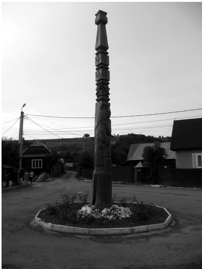
11. fénykép. Faragott faoszlop, rajta: „Állította Csíkszentdomokos községe az Úr 2011-ik esztendejében a Család éve tiszteletére”

Az odalátogató vendég szemében a sok kapu és fafaragás ad a falu tájképének székely jelleget. A településtábla kivételével, ahol a román nyelv periferikus nyelvként van jelen, ezeken mind egynyelvű magyar feliratokkal találkozhatunk. Érdekes, hogy a kárpátaljai Visk községben találkoztam hasonló fafaragásokkal és azokhoz kapcsolódó nyelvhasználattal, Aldobolyban pedig kétnyelvű feliratok is láthatók faragott kapukon.