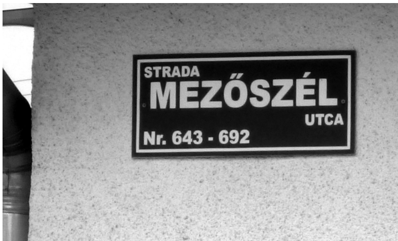
2. fénykép. Csíkszentdomokosi utcanévtábla

A román Strada van ugyan felül és balra, illetve a számot a román Nr. rövidítés jelzi, de maga az utcanév csak magyarul olvasható. Ilyen utcanévtáblákkal a hat falu közül csak Csíkszentdomokoson találkozhatunk. A kétnyelvű kereskedelmi feliratok között sem ritka, hogy a magyar nyelv van elől: