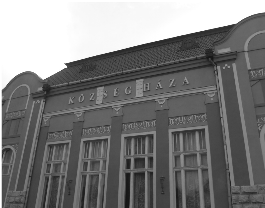
10. fénykép. Egynyelvű „dekoratív” önkormányzati felirat

Itt a felirat ideiglenes jellege – egy másik ajtóhoz irányít – talán magyarázza, hogy a különféle központi ellenőrök stb. számára miért nem írták ki románul is a kifejezést. Emellett természetesen leginkább a szimbolikus jelentőséggel bíró feliratok jelennek meg magyarul. Például a községi intézmények (iskola, községháza, művelődési ház) homlokzati, „dekoratív” feliratai csak magyarul láthatók.