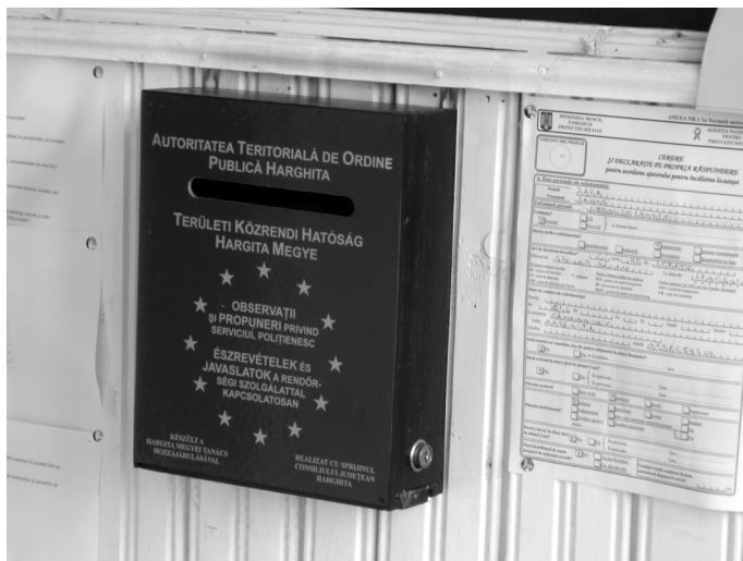
1. fénykép. Harghita megye által állított kétnyelvű panaszláda a csíkszentdomokosi községházán

egy felirat, annál nagyobb a valószínűsége, hogy így van. Például az egyik, a településen kívülre mutató tábla esetében: