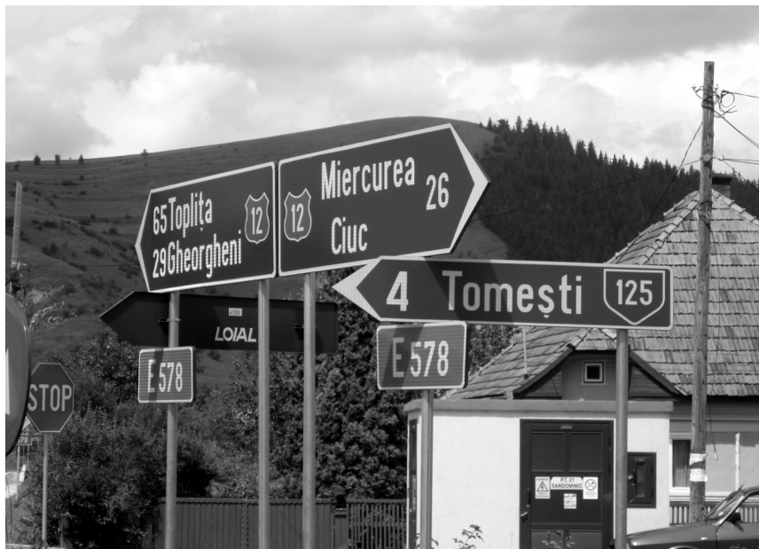
5. fénykép. Román egynyelvű útjelző táblák

Az útjelző táblák esetében Székelyföldön gyakran lehet látni kétnyelvű táblákat is, de ezek talán leginkább a városokból kivezető utak mellett helyezkednek el. Szlovákiában ilyen táblák egyáltalán nincsenek két nyelven, Kárpátalján pedig előfordulhatnak ugyan, de ott sem gyakori, hogy magyar felirat is szerepelne rajtuk.