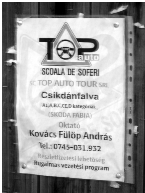
4. fénykép. Kétnyelvű szöveg, amely mind a két nyelv ismeretét feltételezi

Itt a SCOALA DE SOFERI (autósiskola) szöveg nem szerepel magyarul, a többi szöveg viszont csak magyarul van. A hosszabb magyar szöveg és az oktató neve is arra utalhat, hogy az oktatás és a vizsgáztatás is magyarul történhet, habár erre nem tér ki konkrétan a szöveg. Ez a hirdetés is arra enged következtetni, hogy bizonyos fokú kétnyelvűség általánosan elterjedt a domokosiak körében. Ilyen feliratok egyébként általában mindenütt ritkának mondhatók.