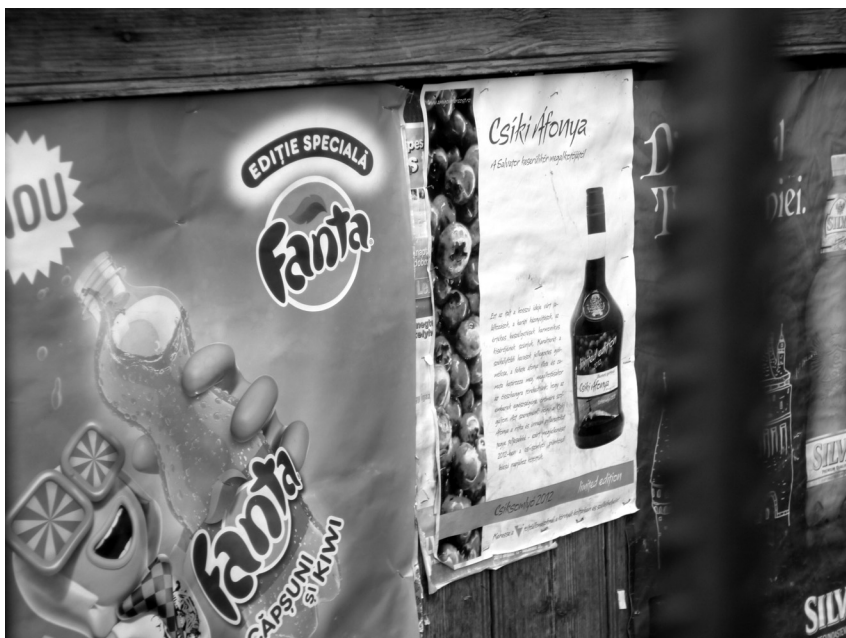
6. fénykép. Párhuzamos egynyelvűség: Fanta és Csiki Áfonya

Itt a nemzetközi termék és a helyi termék nyelvválasztása hangsúlyozza a helyi és a nemzetközi kötődések különbségét. Általában a helyi termékeket (pl. Góbé termékek) kétnyelvűen hirdetik – igaz, a román nyelvű szöveg többnyire periferiális elemként szerepel. Szlovákiában és Kárpátalján nem találok ilyen helyi, magyar nyelven (is) hirdetett helyi kereskedelmi termékekkel. A régebbi és szélesebb körben terjesztett székelyföldi termékek (pl. Ciuc sör) közül néhányat nem hirdetnek magyarul. A magánemberek feliratai között összesen kettőt találtam, amely egynyelvű román volt, az egyik egy harapós kutyára vonatkozó figyelmeztetés, a másik egy parkolást tiltó tábla.