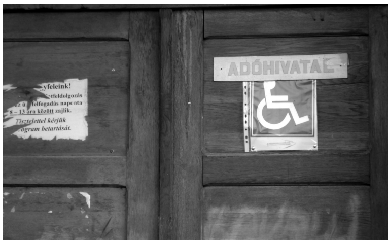
9. fénykép. Egynyelvű hivatalos jellegű magyar felirat

Az önkormányzati vagy közösségi szférában is találhatunk viszonylag sok egynyelvű magyar feliratot. A hivatalos jellegű feliratok általában románul (is) vannak, de találtam egy, csak magyar nyelven tájékoztató feliratot: