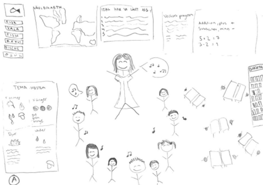
KUVIO 1. Tulevaisuuden kielikylpyopettajuutta heijastavia teemoja (ÅA24).

Kielikylpyopettajan tärkeä kielellinen rooli ja vuorovaikutus monine erilaisine opetusmetodeineen ovat kuvion 1 keskiössä. Kuvassa korostuu kielikylpylapsien kielen omaksuminen esimerkiksi laulamisen avulla. Opiskelija ÅA24 on lisäksi kuvassaan tuonut esiin kielen opetuksen integroinnin oppiaineisiin, mikä näkyy esimerkiksi kielen ja oppisisältöjen yhteensovittamisessa. Kuviossa näkyy myös kielikylpylle luonteenomainen teemaopetus ( Tema hösten ), ns. eheytetty opetus, jossa syksyyn liittyvät käsitteet ja kielelliset ilmaisumuodot ovat osa oppimisympäristöä. Näiden lisäksi kalakäsité ilmaistaan kuudella eri kielellä. Opiskelija ÅA24 korostaa kuvassaan kielenomaksumista tukevia oppimisympäristön "ei-kielellisiä" osa-alueita (sosiaaliset normit, arvot, turvallisuudentunne, me-henki jne.) selventämällä kuvaa näin: