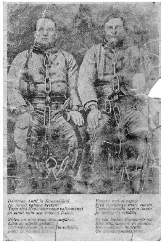
Kuva 5. Postimuseo.