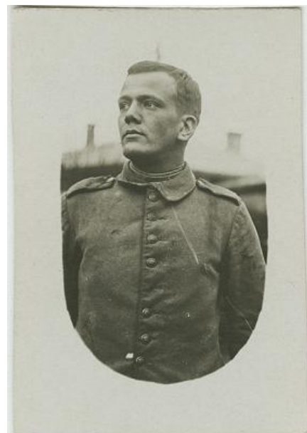
Kuva 9. Pohjois-Pohja 30.4.1939.