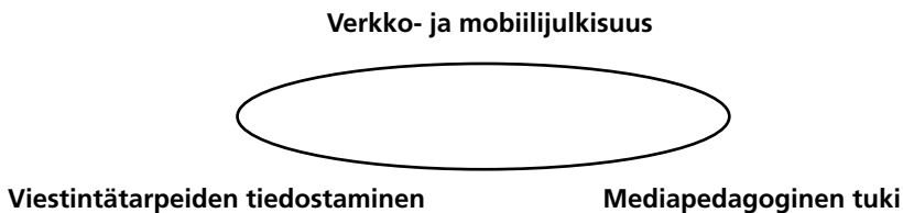
Kuvio 2. Kansalaisten verkkojulkaisemisen ehdot

Pedagogisen tuen merkitys on havaittu myös aikuisten kansalaisverkkokokeiluissa. Esimerkiksi tamperelaisen Mansetorin ja oululaisen Naapurit.net-sivuston kehittämisessä asukkaiden ja yhteisöjen vahvistumiseen ja verkkojulkisuudessa osallistumisen edistämiseen tarvittiin seuraavia elementtejä, joista Vaikuttamossa toteutuvat ainakin verkkojulkisuus ja mediapedagoginen tuki (Kotilainen 2004, 296):