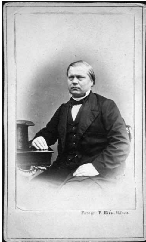
Paavo Tikkanen (1823–1873) kuului Suomettaren perustajiin 1847 ja oli useaan otteeseen sen päätoimittaja 1840–1860-luvulla. Hän oli innokas suomalaisuusmies ja tutkija, joka 1859 jätti tarkastettavaksi yhden ensimmäisistä suomenkielisistä väitöskirjoista. Kuva on otettu 1860-luvun alkupuolella.

Keitä olivat nämä ”miehet metsien takana”, jotka kirjoittivat Sanan-Lennättimeen ? Selvitys kirjoit-