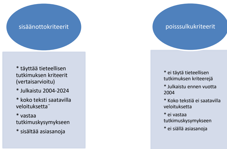
KUVIO 3 Tutkimusaineiston kriteerit

Aineistoa tutkielmaani etsiessäni ja aineistoa rajatessani, tärkein asia oli, että aineistossa oli tutkittu vanhemman päihteiden käytön vaikutuksia lasten elämään tai lasten kokemuksia elämästä haitallisesti päihteitä käyttävän vanhemman kanssa. Aineistoa valikoidessani tavoitteena oli löytää kokemuksia siitä, miten vanhempien haitallinen päihteidenkäyttö näkyy ja/ tai vaikuttaa lasten elämään.